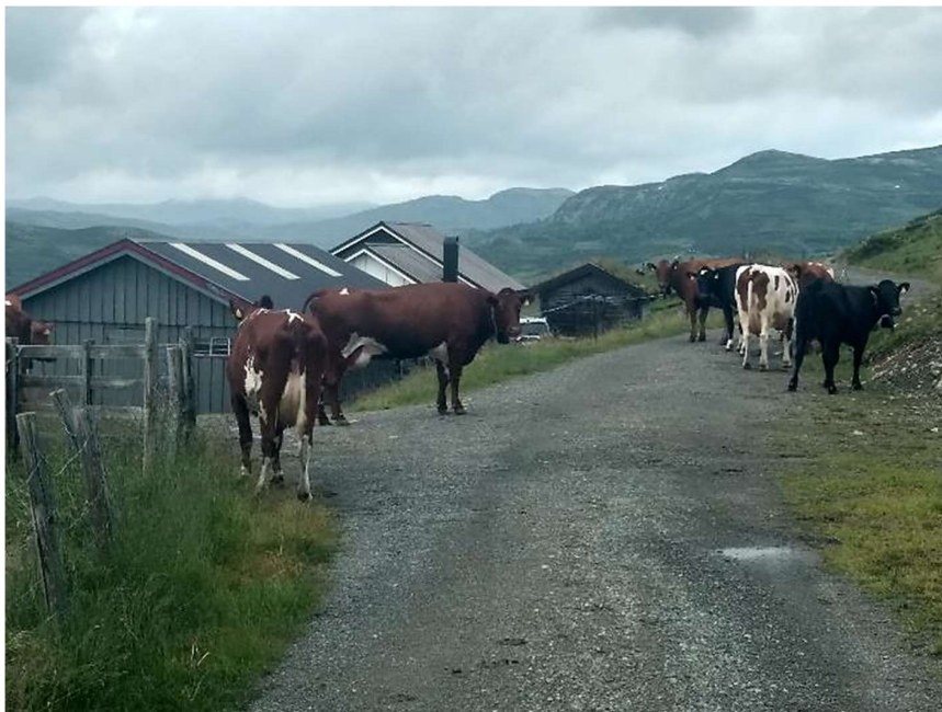
Ved Hellebu, Liagardsåsen