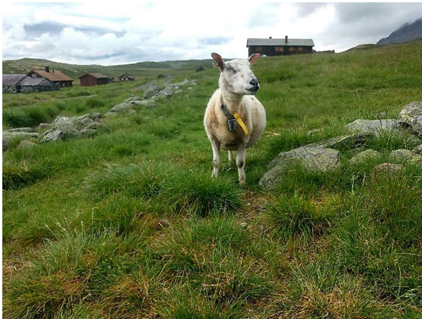
Eitrestølen, under Reineskarvet