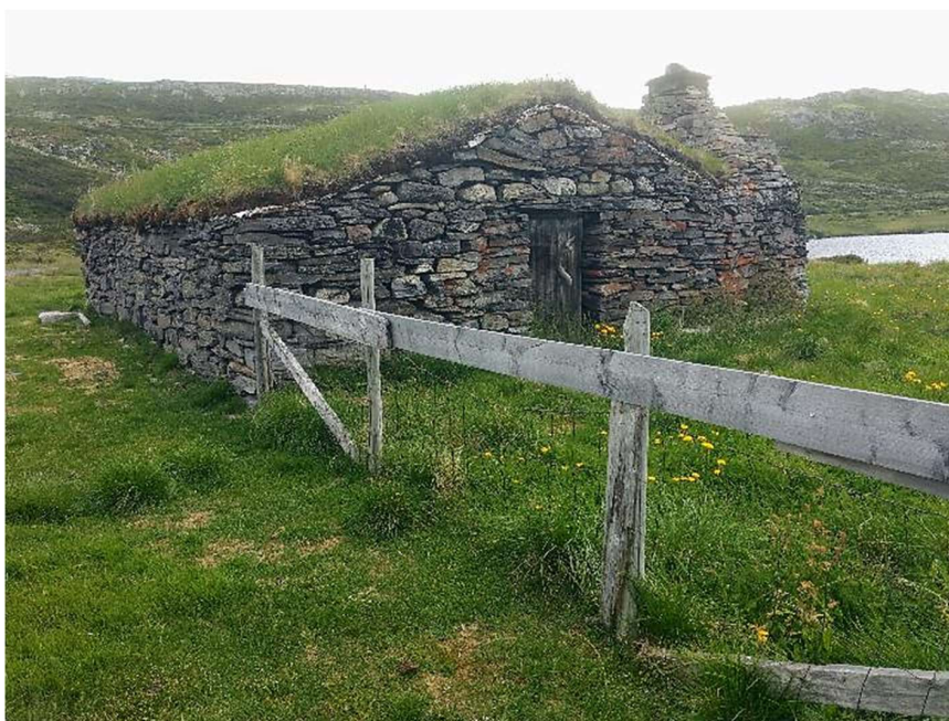
Nedre Blomestølen, under Reineskarvet