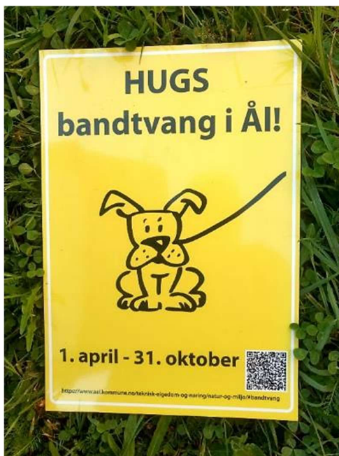
Ny permanent plakat

STIGAR: Turvegar, skilt og postkasser vert ikkje sjekka systematisk, men oppsynet ser til at alt er i orden, når han er der lell.