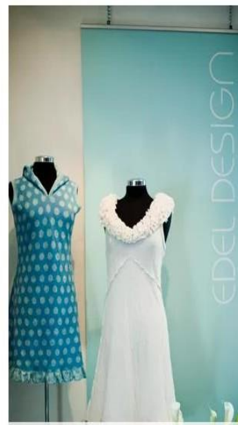
EDEL DESIGN GALLERIBUTIKK