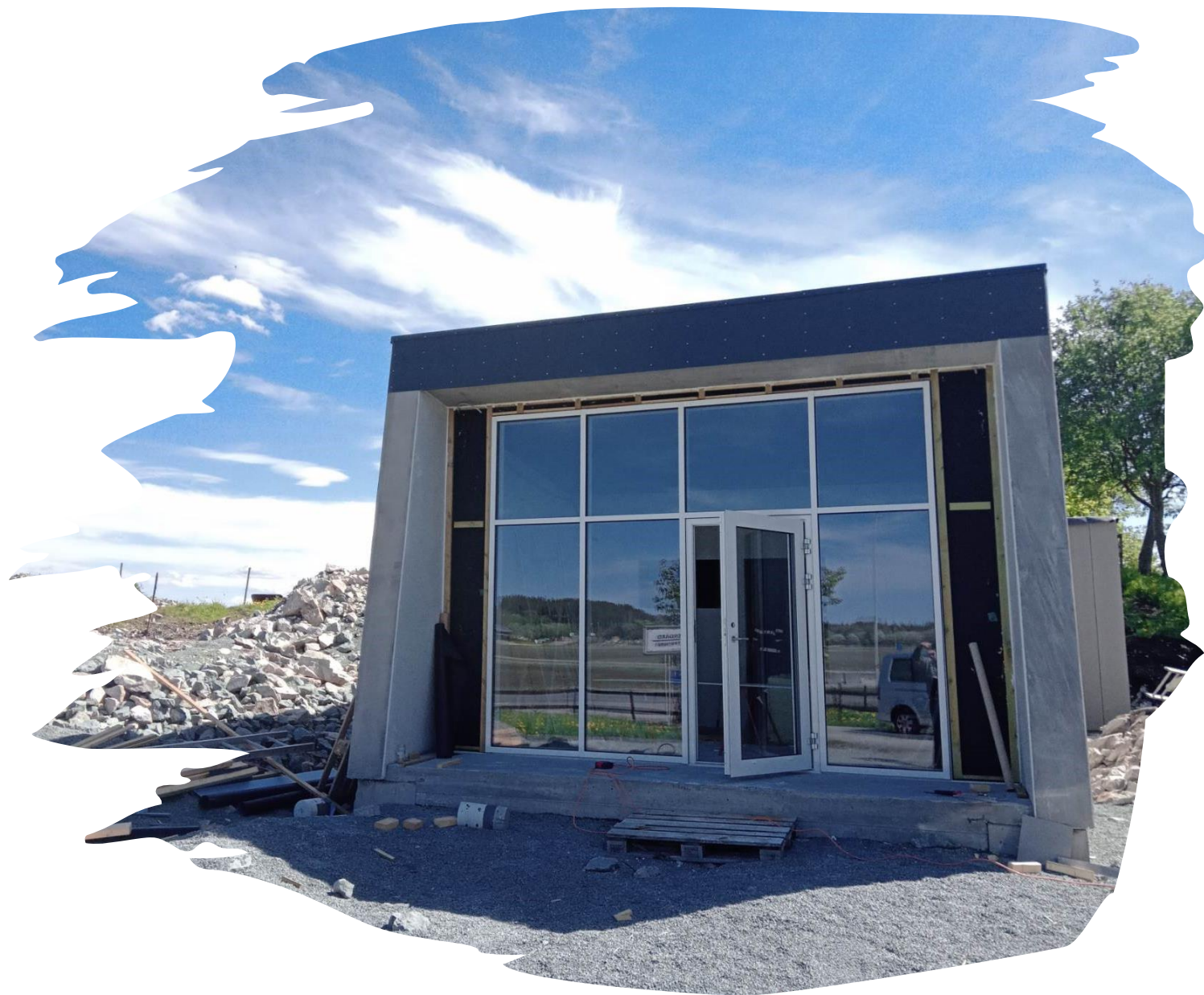
Utsalg fersk økologisk gårdsmelk fra Hovsvangen