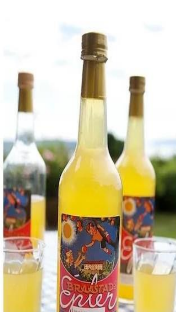
GÅRDSBUTIKK BRAASTAD EPLER