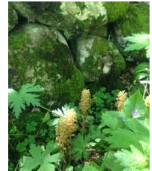
Rusaset våtmarksbiotop og Austråttlunden landskapsvernområde