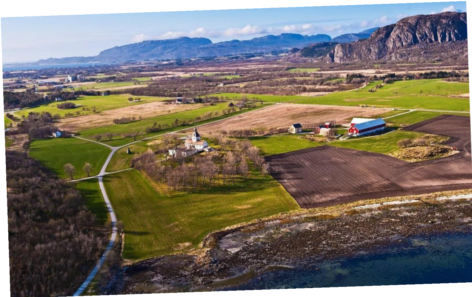
Austråttlandskapet med Austråttborgen og Austrått gård.