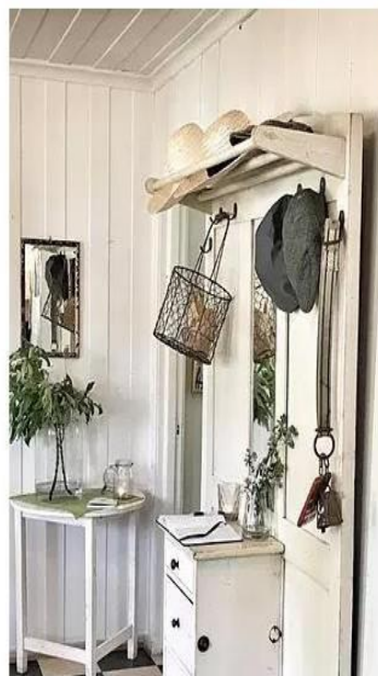
SKAFFERIET PÅ HOVINSHOLM