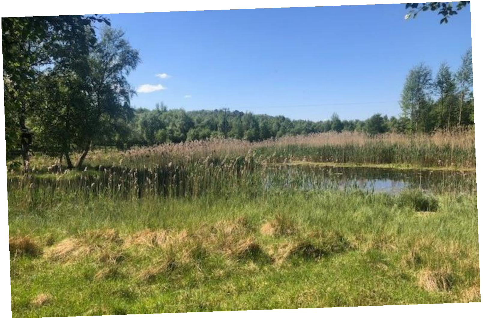
Lundabakken gård, Austrått