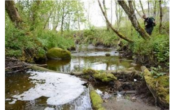
Hovsfjæra Ramsar-område og fuglereservat