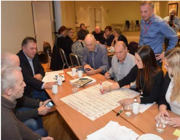
Kommunereforma - Kristiansund kommune Ærlighet, raushet og respekt var tre av ordene som gikk igjen da 7 kommuner på Nordmøre møttes til sonderingsmøte 17. november, skriver Tidens krav. http://