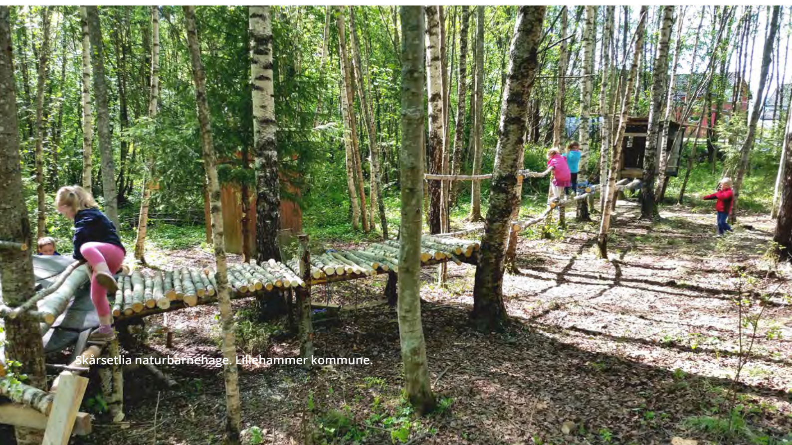
Skårsetlia naturbarnehage, Lillehammer kommune.

Urban fortetting og transformasjon gir gjerne positiv effekt i forhold til dagens bustad-, areal- og transportplanlegging. Dette opnar for at ein i større grad kan ta framtidens transportauke