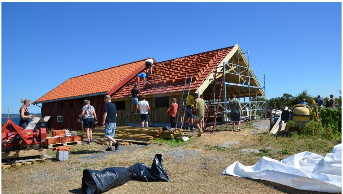
Nytt sauefjøs på Stråholmen