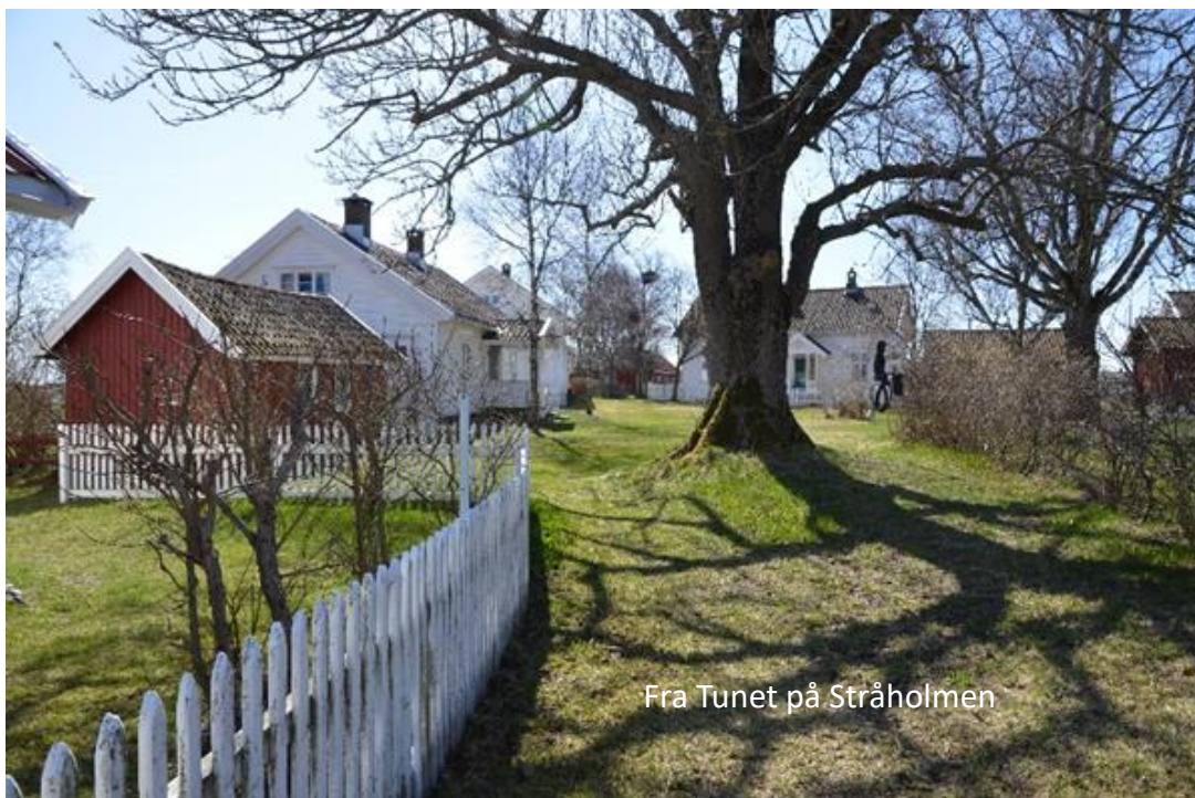
Fra Tunet på Stråholmen