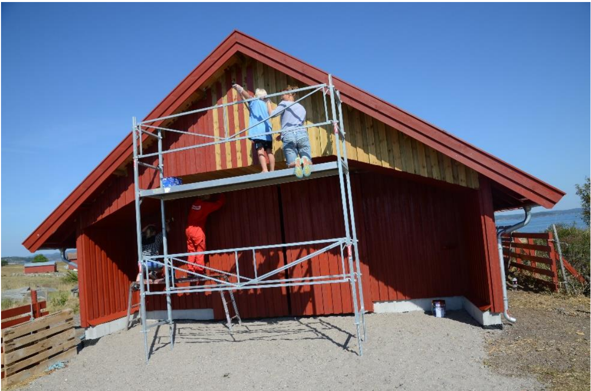
Maling av det nye sauefjøsset på Stråholmen

En stor takk til alle dem som har deltatt i dugnader eller som på annen måte støttet opp om å bevare øyenes egenart og viktige biologiske- og kulturelle verdier!.