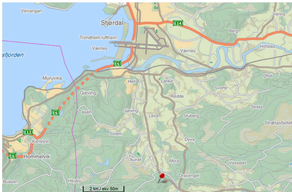
Figur 1: Fossberga pukkverk. Kart: finn.no

Hensikten med beregningene er å sammenligne støy fra pukkverket med gjeldende grenseverdier.