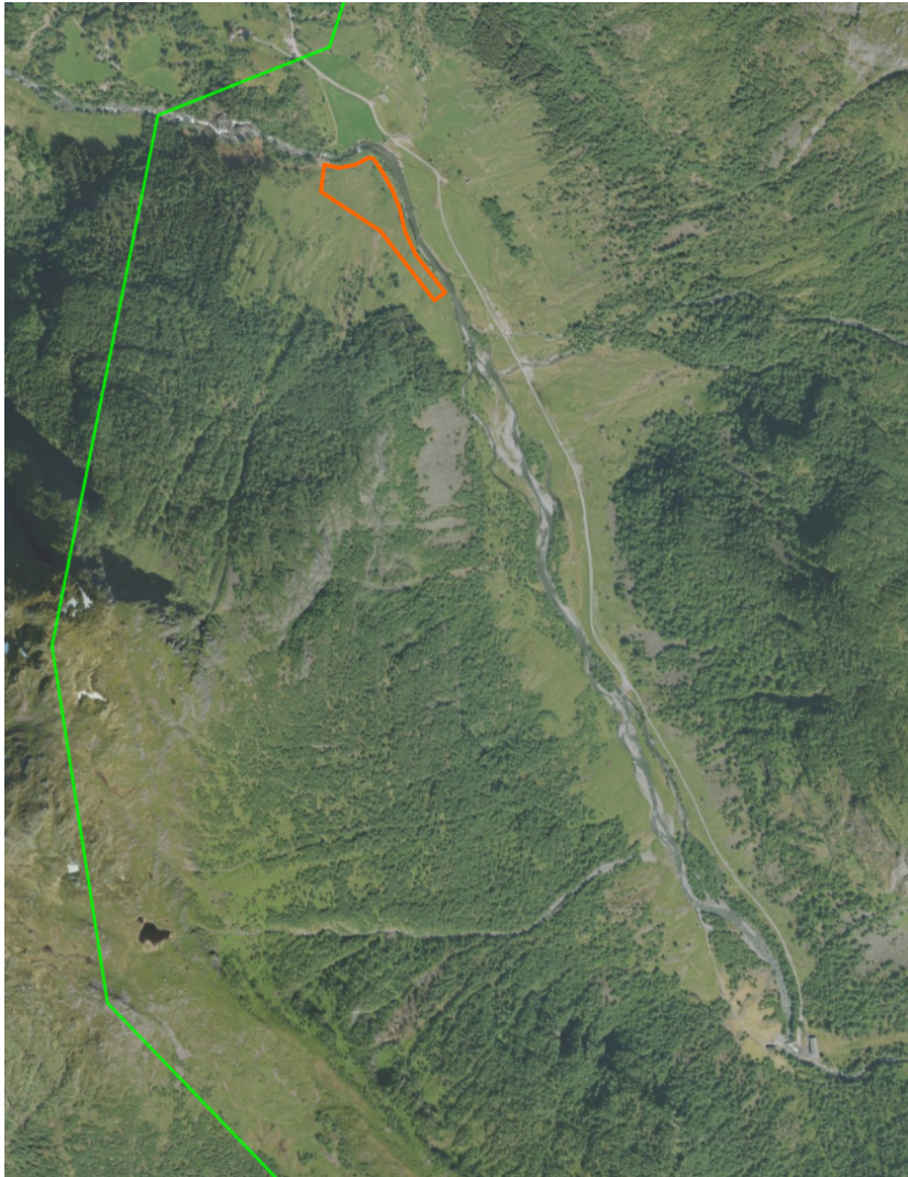
Figur 4: Bilete som viser Hattbergsdalen frå lufta. Arealet på gnr. 87 bnr. 12 kor det tidlegare har vore søkt om løyve til å dyrka er markert med raud line.

Det er 4-5 gardsbruk i Rosendal som har beitedyr i området, både med storfe og sau. Eit av desse er det aktuelle gnr. 87 bnr. 12 som etter det vi kjenner til haustar gras frå 4-5 små bruk i bygda, til saman om lag 50 dekar dyrka jord, pluss 150 dekar innmarksbeite i og utanfor Hattbergsdalen. Dei driv med kring 15 storfe og 20 vinterfôra sau. Føremålet med nydyrkingsprosjektet er å styrke drifta med eiga jord og i tillegg utvide drifta med fleire beitedyr. Det vil ikkje føre til stor auke i beitebruken, men likevel bidra til nyrekruttering og skjøtsel innanfor og utanfor verneområdet.