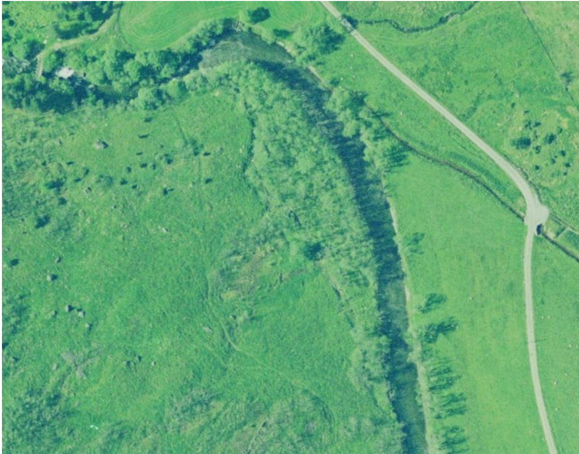
Figur 2: Bilete som viser kantvegetasjon mellom hovudløp og flaumløp/sideløp i 2003.