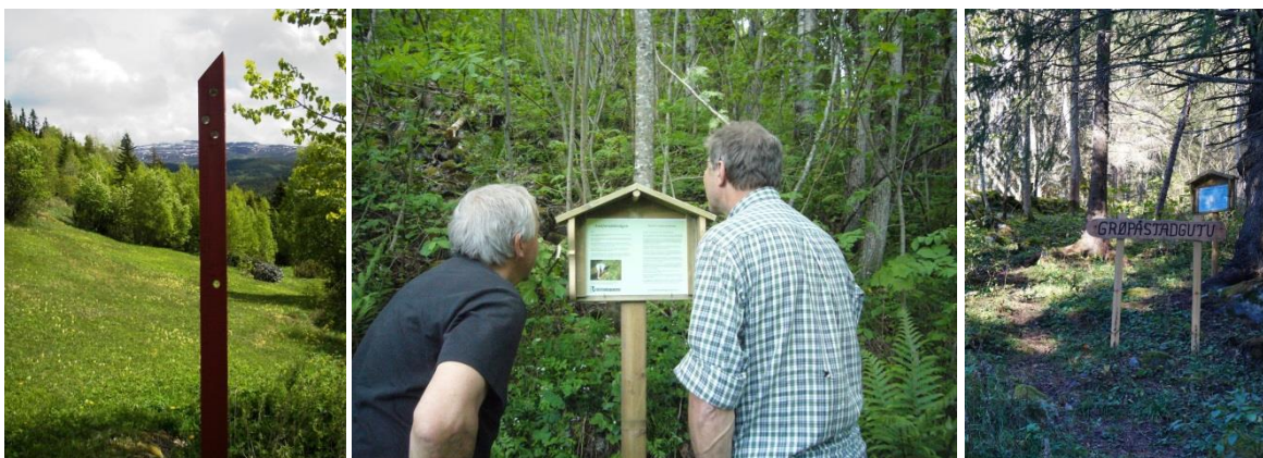
Figur 18. Glimt frå Gullstigen, Ambjørndalsstigen og Grøpåstadgut.