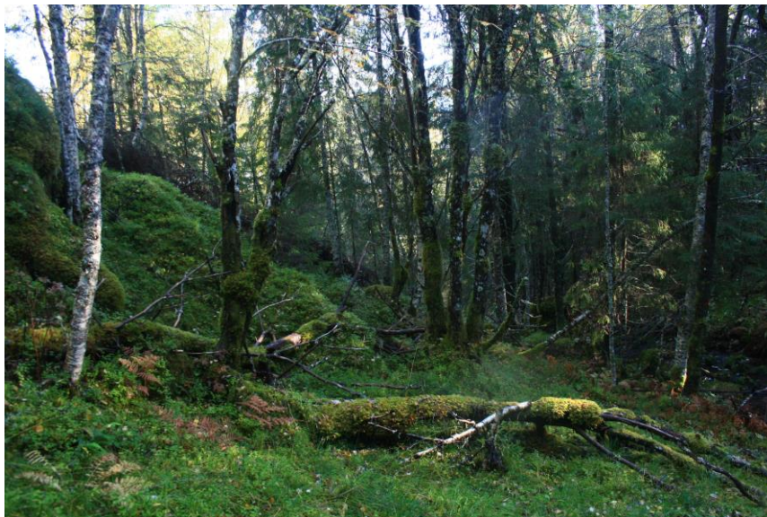
Område med boreal regnskog, østsida mot Namsenfjorden