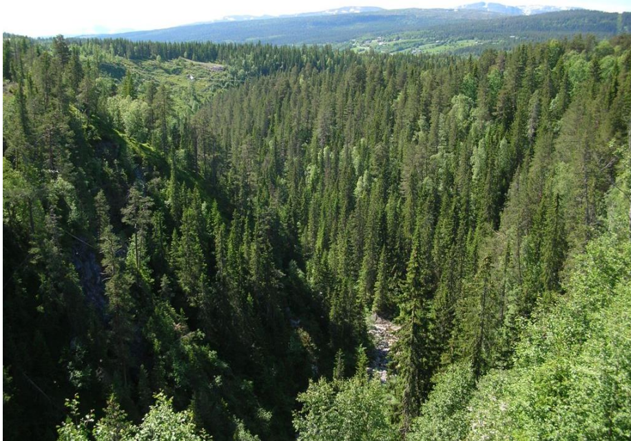
Stavåa sett fra brua over E6.

Utvidelsen er ei markert bekkekløft østover fra det eksisterende naturreservatet og opp til E6. Området har stor variasjon og mye rik vegetasjon og med viktige bekkekløftkvaliteter. Verneverdi: **, regional. Areal: 126 dekar.