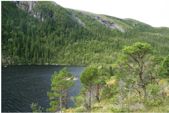
Fra vestsida (t.v.).

Verneverdi: **, regional. Areal: 7292 da