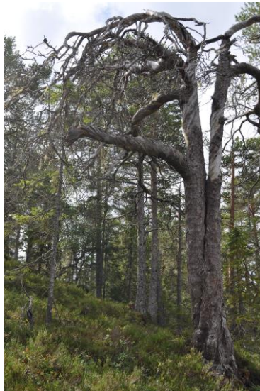
Overveiende et furuskogområde.

Området med ganske høytliggende og til dels svært gammel furuskog med oseanisk preg. Verneverdi **, regional. Areal: 2144 da.