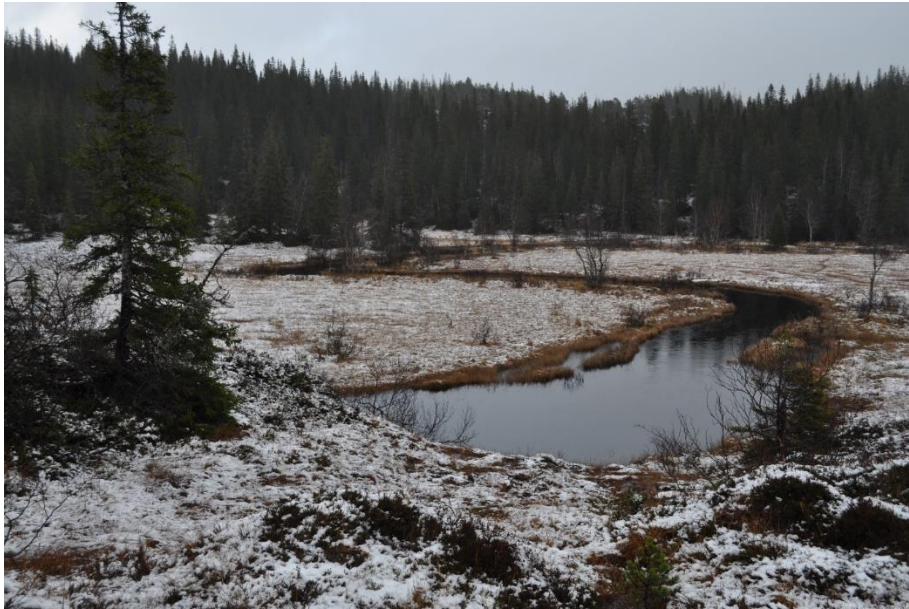
Fra Vargøybekken øst for Lona

Verneverdi **, regional. Areal: 1737 dekar.