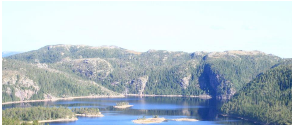
Utsikt mot deler av vestsida langs Statlandsvatnet

Området er svært variert med eksponering mot sør, vest, nord og øst, og går fra sjøen og i til snaufjell, med både med rike og fattige naturtyper. Området er til dels svært bratt. I alt er det registrert i alt 11 naturtypeområder, bl.a med boreal regnskog, høgstaudeskog – bl.a. med kalkinnslag, samt andre rike skogtyper som høgstaudebjørkeskog og innslag av alm. I de høyereliggende deler er det innslag av svært gammel furu. Verneverdi: **, regional. Areal: 4487 da.