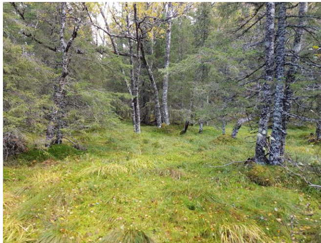
Sumpskog og flommarskoger langs elva

Område med boreal regnskog, forekomst av sterkt truede arter som trønderringlav, samt meandrerende elv, innslag av sumpskog og flommarskog. Området grenser nesten til Beingårdsmyra naturreservat og utgjør også en del av et helhetlig landskap. Verneverdi, som naturtype: Svært viktig. Areal: 3054 da.