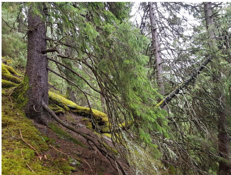
Bratt, gammel skog ovenfor E 6.

Overveiende svært bratt område ovenfor E6 i Vuddudalen, med gammels skog, rik berggrunn. beliggende i sørboreal sone. Området er også variert i den forstand at i flatere partier er det yngre skog i form av or/bjørk, samt at det i vest er noe almeskog. Området ligger i sørboreal sone, som er prioritert. Området betraktes som et spesialområde. Verdi: *-**, regional/lokal. Areal: 324 da.