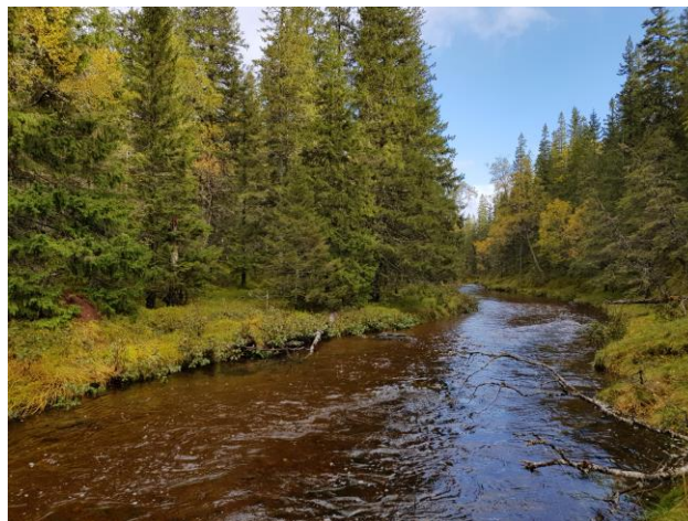
Mefosselva meandrerer mye, her kantskoger på en rettstreknin