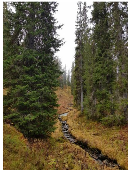
Mariafjellet, Limingen statskog: Glissen, grov høgstaudekog, delvis i mange ravinedaler. Høstbilder, tåke