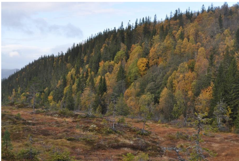
Fra brattlia ved Juliuspynten.

Området er en utvidelse av Sjettenberglia naturreservat vestover, og ligger nordøst for Storstvatnet. Området utgjøres i hovedsak av ei bratt sørvendt li med rik vegetasjon i form av høgstaudeskog og lågurtskog av lauv og gran, herunder med noe alm. Deler er kalkskog. Verneverdi **, regional. Areal: 1017 dekar.