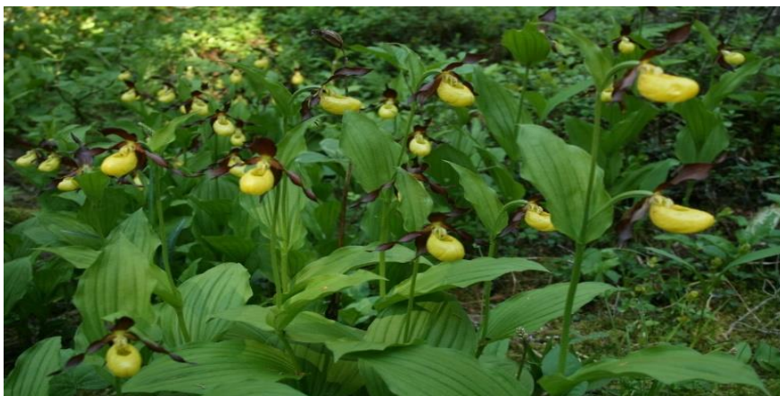
Marisko i Finnsåsmarka (arkivbilde, ikke i utvidelsesområdet)

Liten utvidelse av Finnsåsmarka naturreservat østover, som gir bedre og mer naturlig arrondering i enden av reservatet, og gir mer dybde i område hvor den sjeldne orkideen huldreblom er registrert. Finnsåsmarka er et av de viktigste kalkskogområder i Norge, med svært store forekomster av bl.a. orkideene marisko og flueblom. Finnsåsmarka har nasjonal verdi. Areal, utvidelse: Ca 12 da.