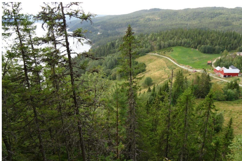
Lia nedenfor Varmdal gård ned til Selbusjøen inngår i området.

Området ligger vest for Storvika naturreservat og utgjør ei bratt sørvendt li ned mot Selbusjøen i sørboreal vegetasjonssone. Området er kalkskog med rik, godt beitet lågurtskog med artsrik karplanteflora og soppflora. Gran er vanligste treslag, men noe gråor-heggeskog inngår, samt noe furu, osp, selje og hassel. Verneverdi: **, regional. Areal: 77 dekar.