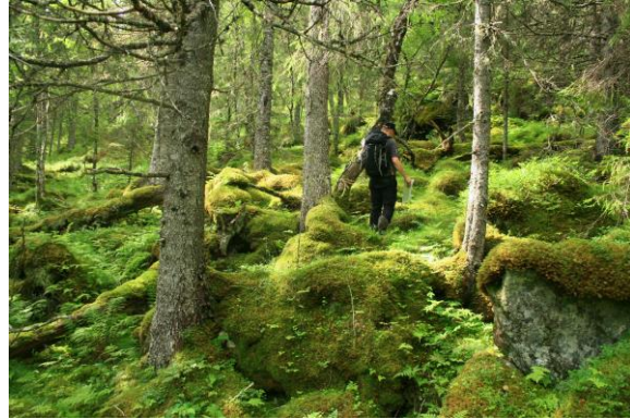
Boreal regnskog nordvest i Storvatnet.