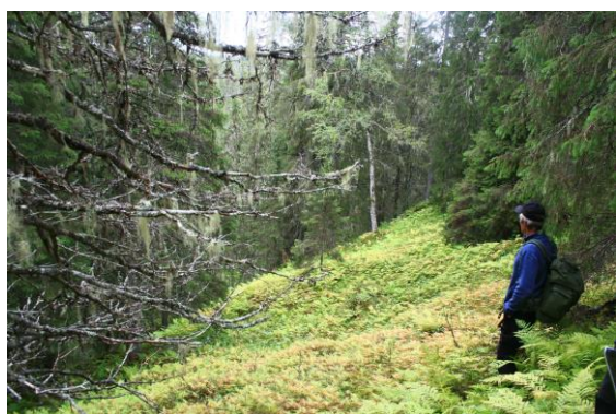
Rik, svært gammel skog i øst.

Område i Snåsa med svært gammel og rik skog i den østlige delen, med kalkskogpreg, samt områder med gammel skog, av fukt karakter og mye hengelav. Sentrale deler har stor dekning av viktige naturtyper. Verneverdi: **, regional. Areal: 3272 da.