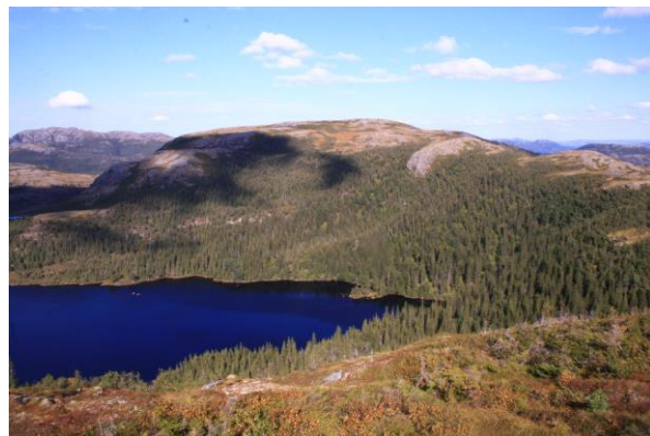
Landskapsrommet ved Gøllaustjønna, overveiende rik høgstaudeskog (t.h).