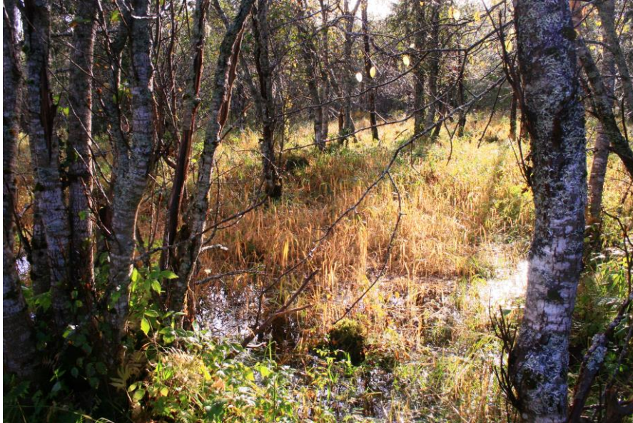
Flommarkskog og sumpskog

Variert område med sumpskog, flommarkskog, meandrerende bekk og elv – herunder med kroksjøer, og område med gammel granskog, og sjeldne arter, verdiklasse A. Taigabendellav, kritisk truet, er funnet i området tidligere, men er ikke bekreftet registrert etterpå. Verneverdi: **, regional. Areal: 629 da.