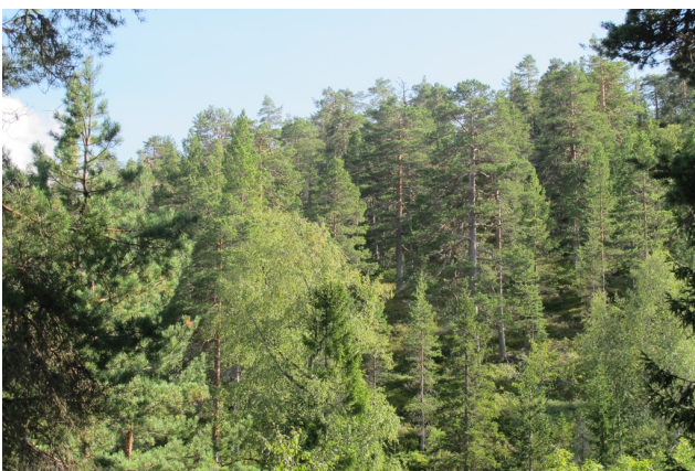
Relativt lavtliggende produktiv og gammel blåbærfuruskog i Barmen utv. gir en skogstruktur i stående skog som på landsbasis knapt finnes.