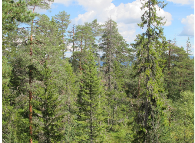
Også på platået er skogen meget grovvokst og tildels høyvokst.