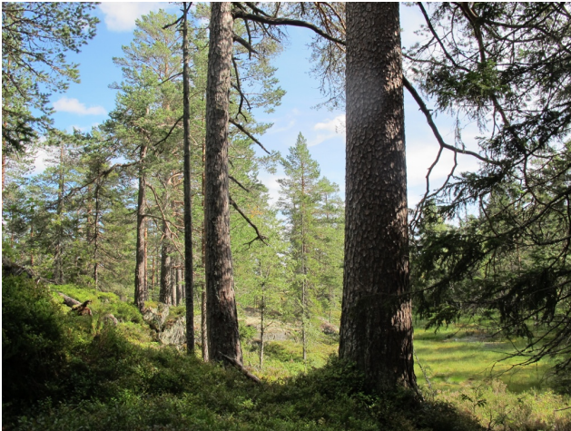
Store furuer og kjempefuruer. Barmen utv. har dimensjoner man sjelden finner i norske skoger.