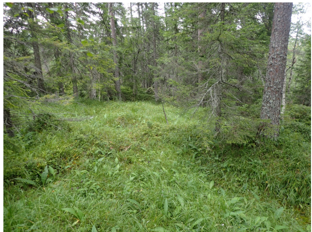
Kalkrike sig i KO14