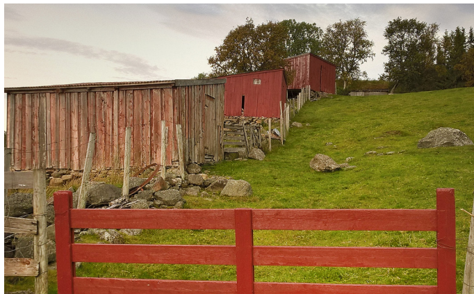
Kulturlandskap i Kvæfjord

I Troms gjelder tilskuddet for landbruks- regionen kystbygder Troms som er definert i www.nordatlas.no .