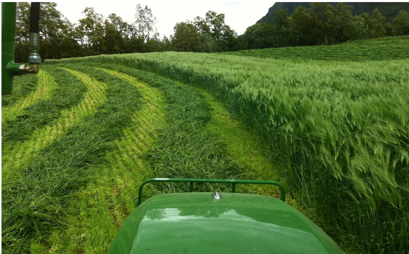
Høsting av bygg i Finnmark