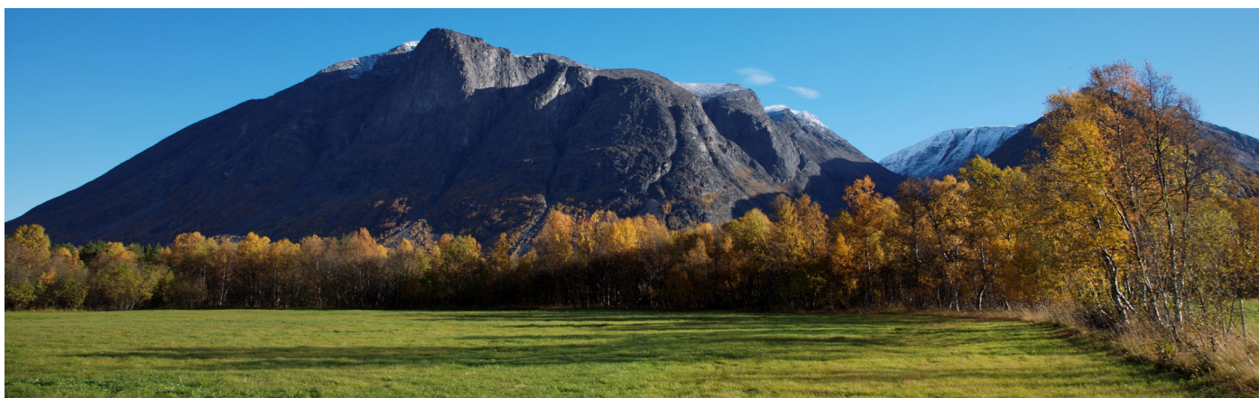
Parti av Reisdalen, Nordreisa.

Hvis du skal søke om dispensasjon sender du søknaden din til kommunen. Kommunen vurderer søknaden din og anbefaler hvilket vedtak Statsforvalteren bør gjøre. Statsforvalteren bestemmer om du får dispensasjon. Hvis du ikke er enig i Statsforvalterens vedtak kan du klage til Landbruksdirektoratet.