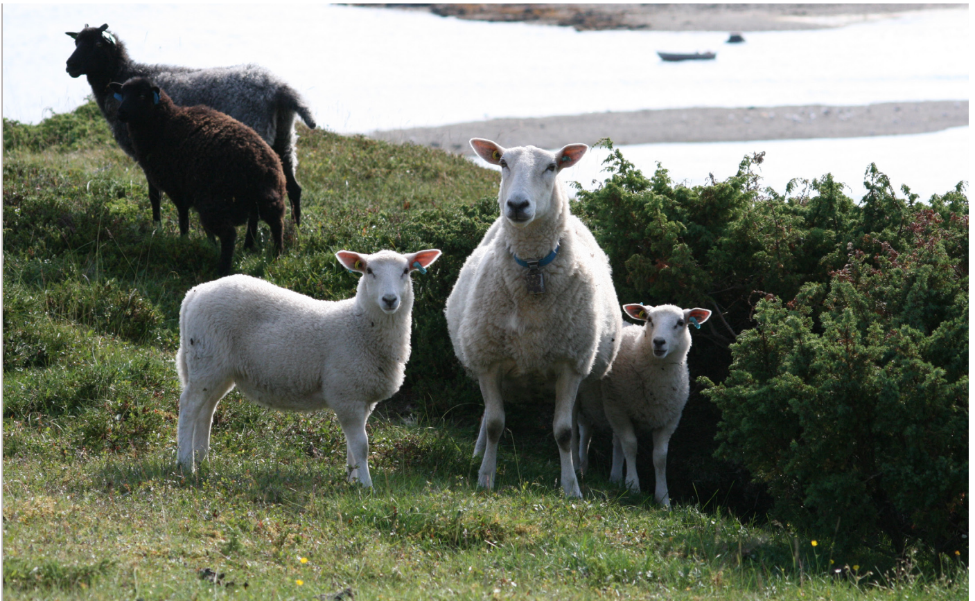
Gode pleiere av kulturlandskapet i Porsanger.