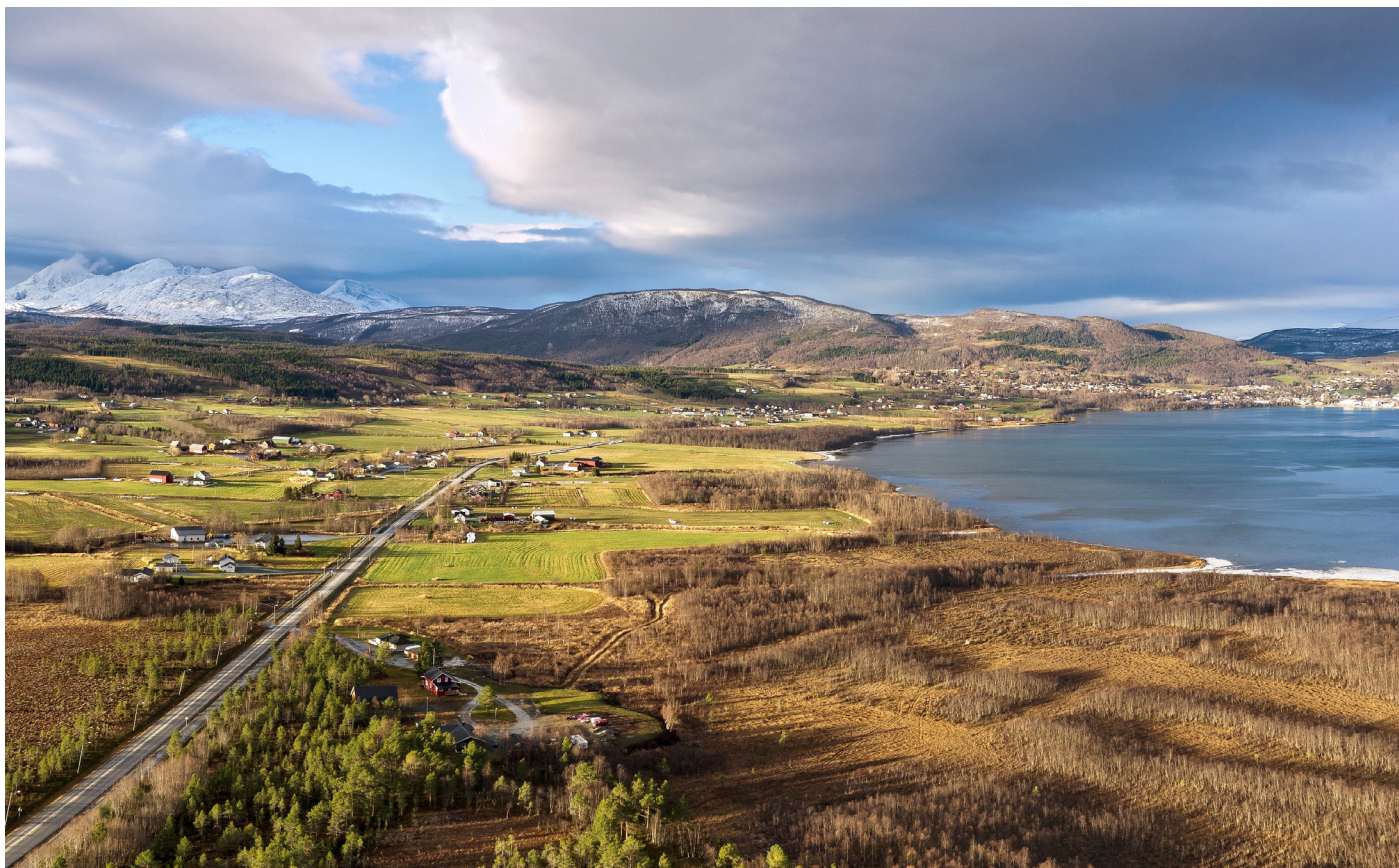
Storsteinnes i Balsfjord.