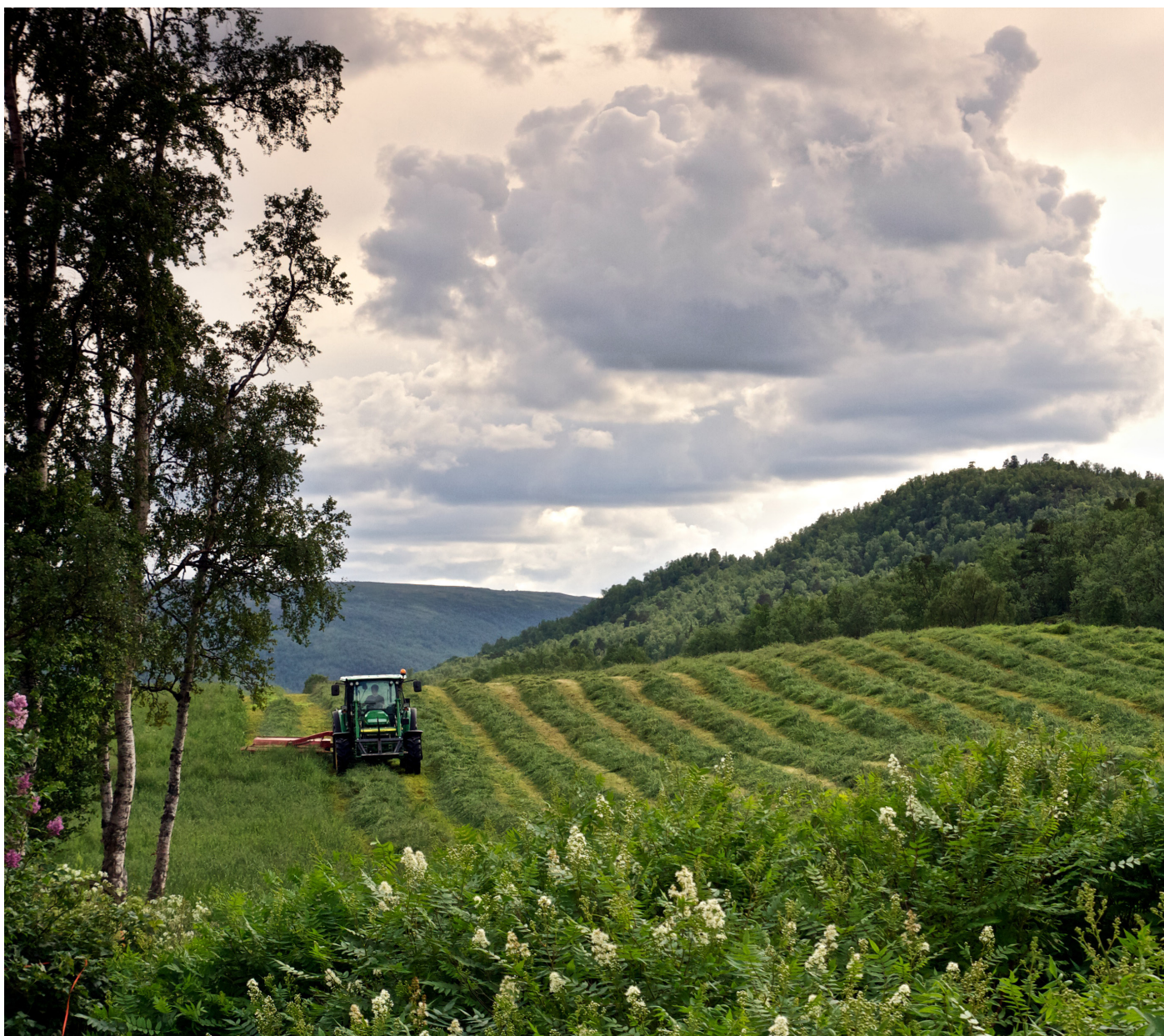
Grasslått i Finnmark