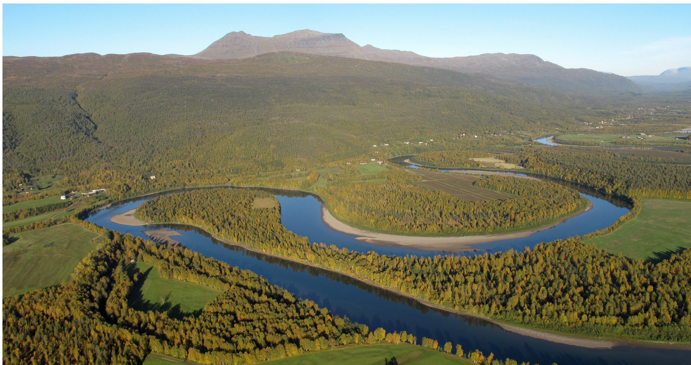
Parti av Målselvdalen