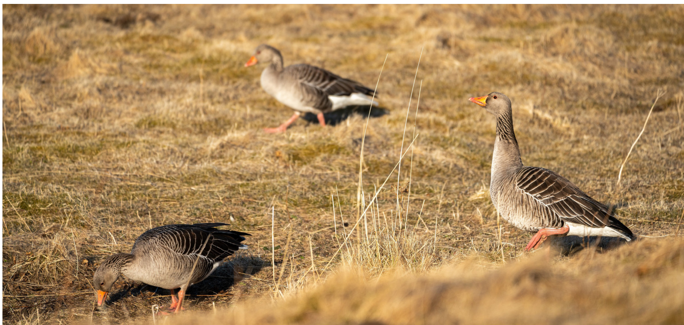
Beitende gjess på innmark.

Den foreløpige satsen er 500 kroner per dekar med lav tilrettelegging. Du kan maksimalt få utbetalt 30 000 kroner for dette tiltaket.