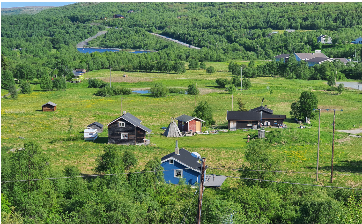
Skoltebyen i Neiden