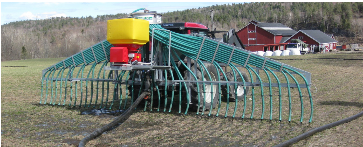
Nedlegging av husdyrgjødsel med tilførselsslange.