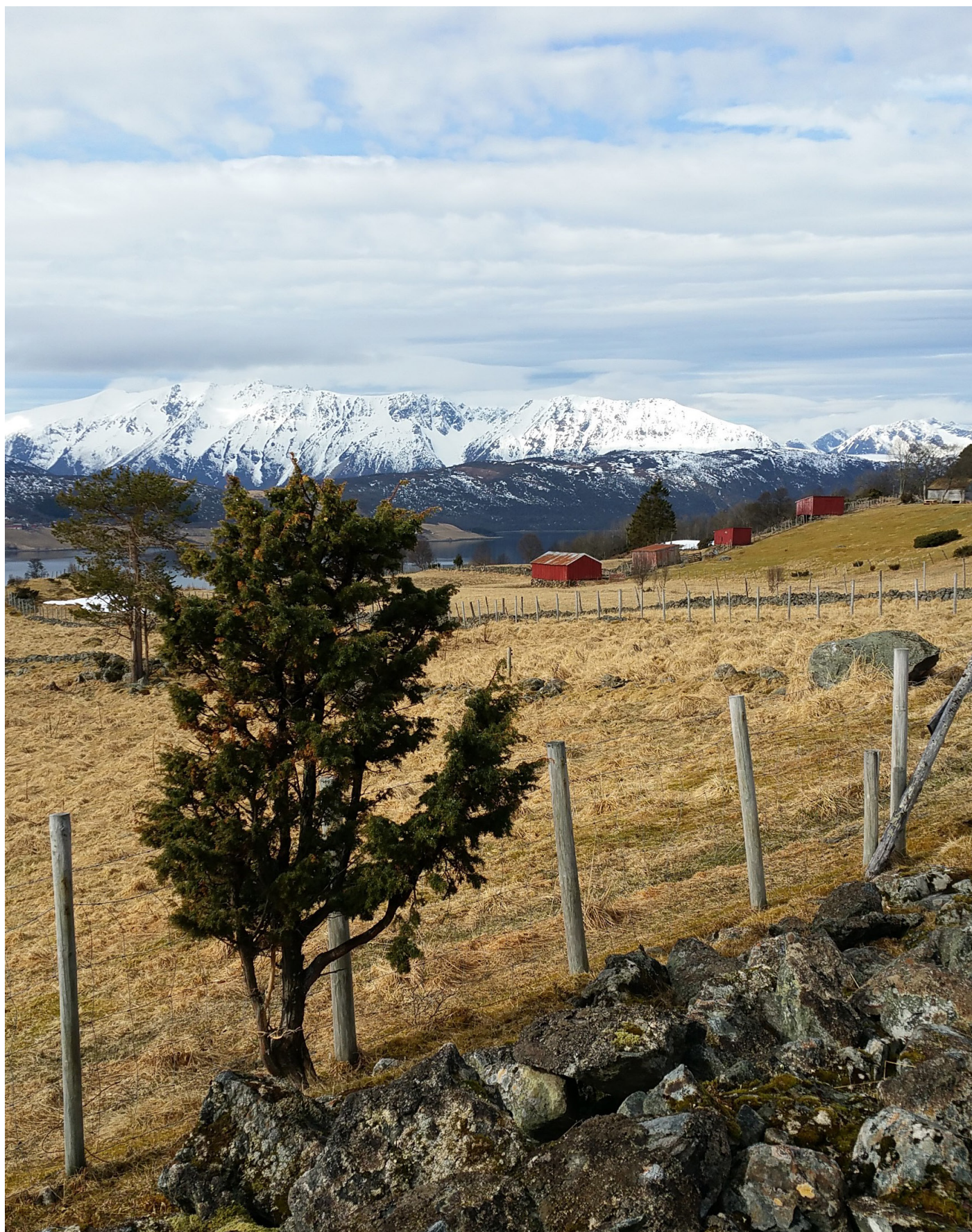
Kulturlandskap i Kvæfjord

En fullstendig oversikt over alle satsene finner du også på www.statsforvalteren.no/tf/rmp .