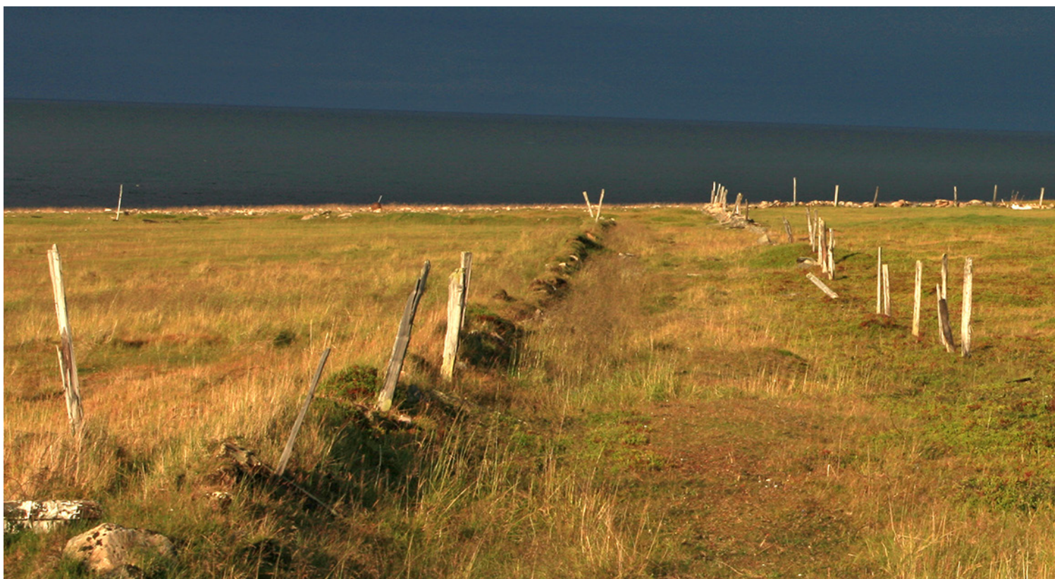
Gammel driftsvei og løe ved Skallneset i Vadsø