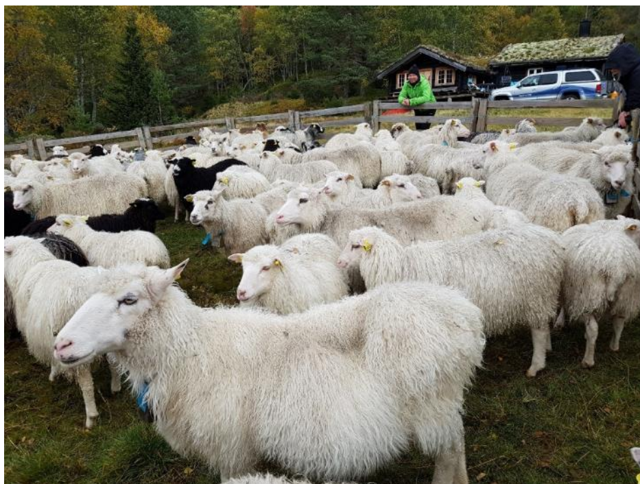
Samling av sauer på heia i Valle.

Tilskuddet utmåles per dyr som er sluppet på beite.