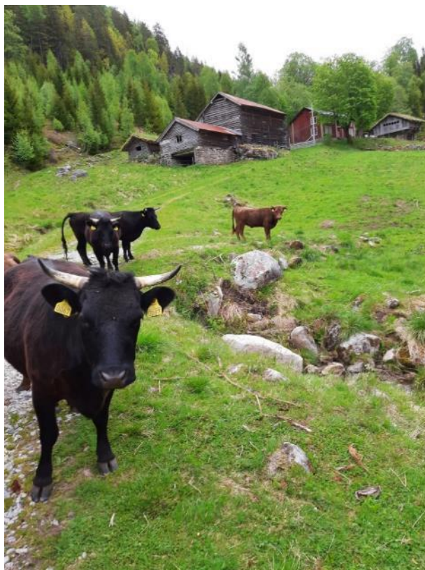
Dexterfe i bratt lende på Skåre i Bygland.