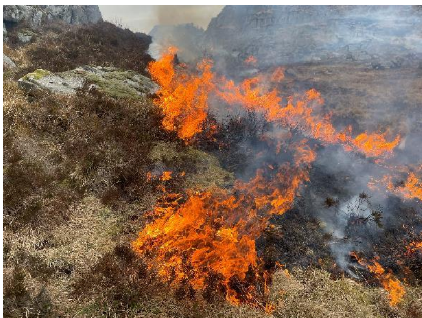
Brenning av kystlynghei, Jølleheia i Farsund.