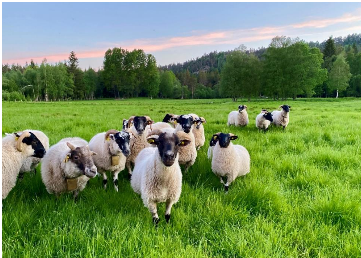
Svartfjes på beite, Birkedal i Grimstad.

Formålet med tiltakene under miljøtema Kulturlandskap er å ivareta jordbrukets kulturlandskap utover det en oppnår gjennom de nasjonale ordningene. Drift av bratt areal og Drift av beitelag skal bidra til å opprettholde tradisjonell drift, mens Beiting av verdifulle jordbrukslandskap skal bidra til å ivareta mer spesielle kulturlandskapsverdier i de prioriterte områdene.