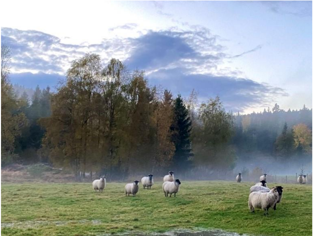
Sauer på beite, Grimstad.

Feil opplysninger i søknaden og brudd på vilkår kan føre til avkortning av tilskuddet.