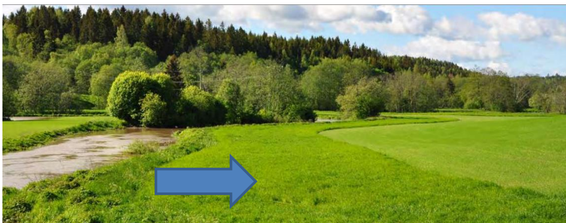
Kantsone i eng (markert med pil).