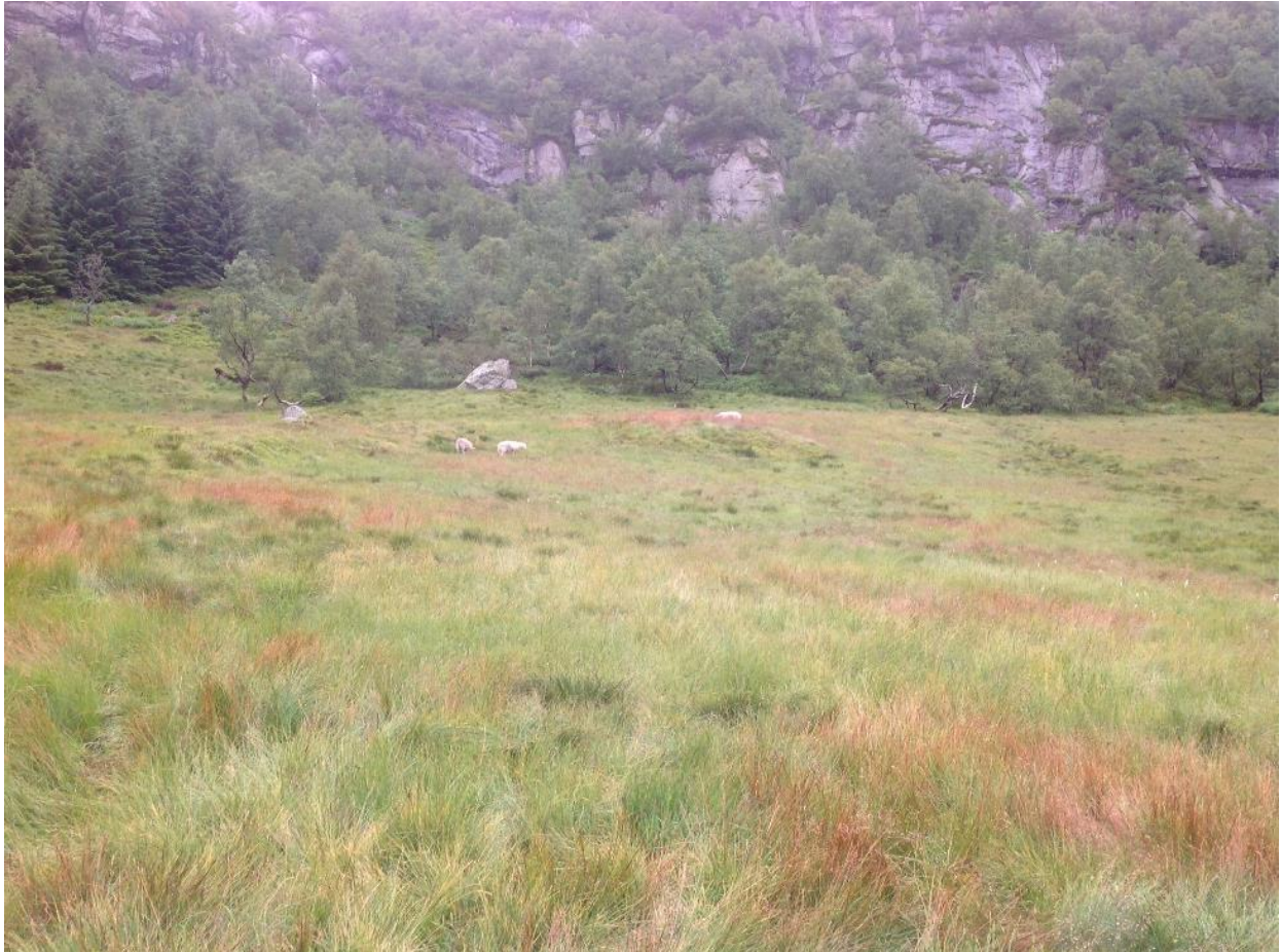
Slåttemark på Bryggesåhommen i Hægebostad.