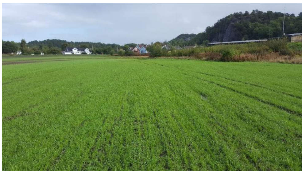
Fangvekster: Raigras og rug sådd etter høsting av tidligpotet, Søgne.

Det er ikke maksimalt tilskudd per foretak for dette tiltaket.