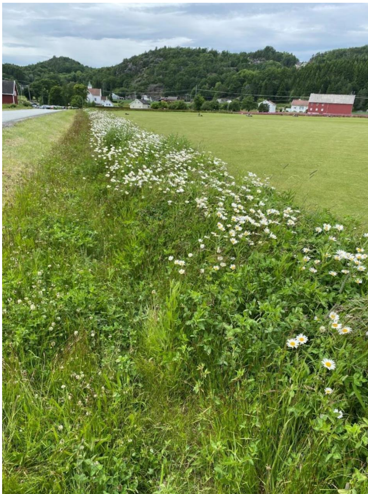
Blomsterstripe på jordbruksareal (Egen stripe, regional frøblanding), Landvik i Grimstad.