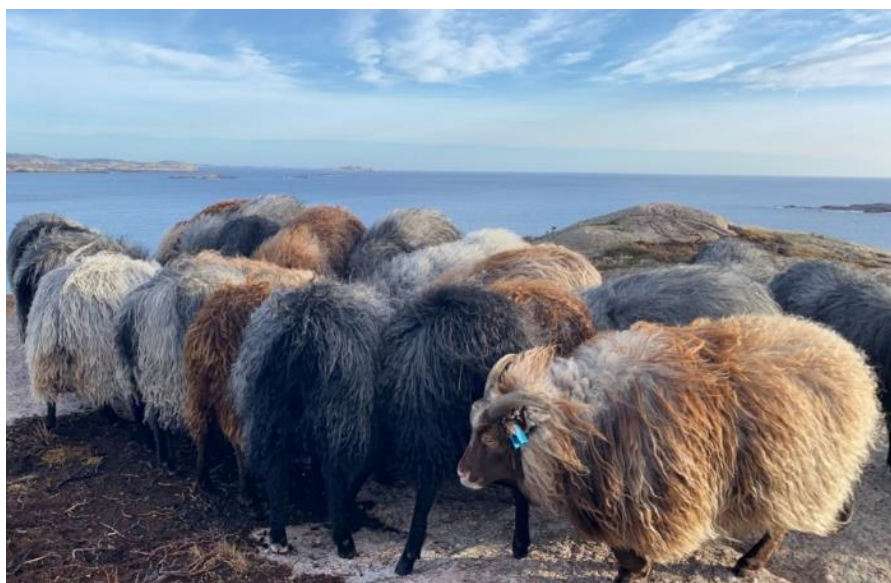
Gammel norsk spælsau på beite, Hillebunga i Lindesnes.

Det kan bare utbetales ett tilskudd til samme beitedyr for en beitesesong der samme område både er prioritert etter § 6 og § 7 for eksempel øya Hille utenfor Mandal. Søker må da velge å enten søke for jordbruksareal i § 6 eller søke for beitedyr på alt areal som beites i § 7.