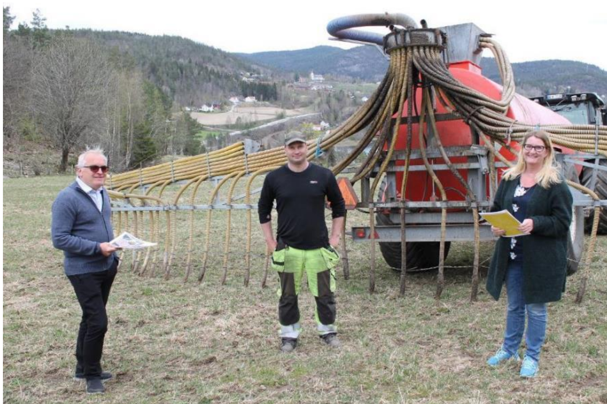
Gjødselvogn med spredebom for nedlegging av husdyrgjødsel. Fylkespolitikere på besøk hos leder av Agder Bondelag i Gjerstad kommune.