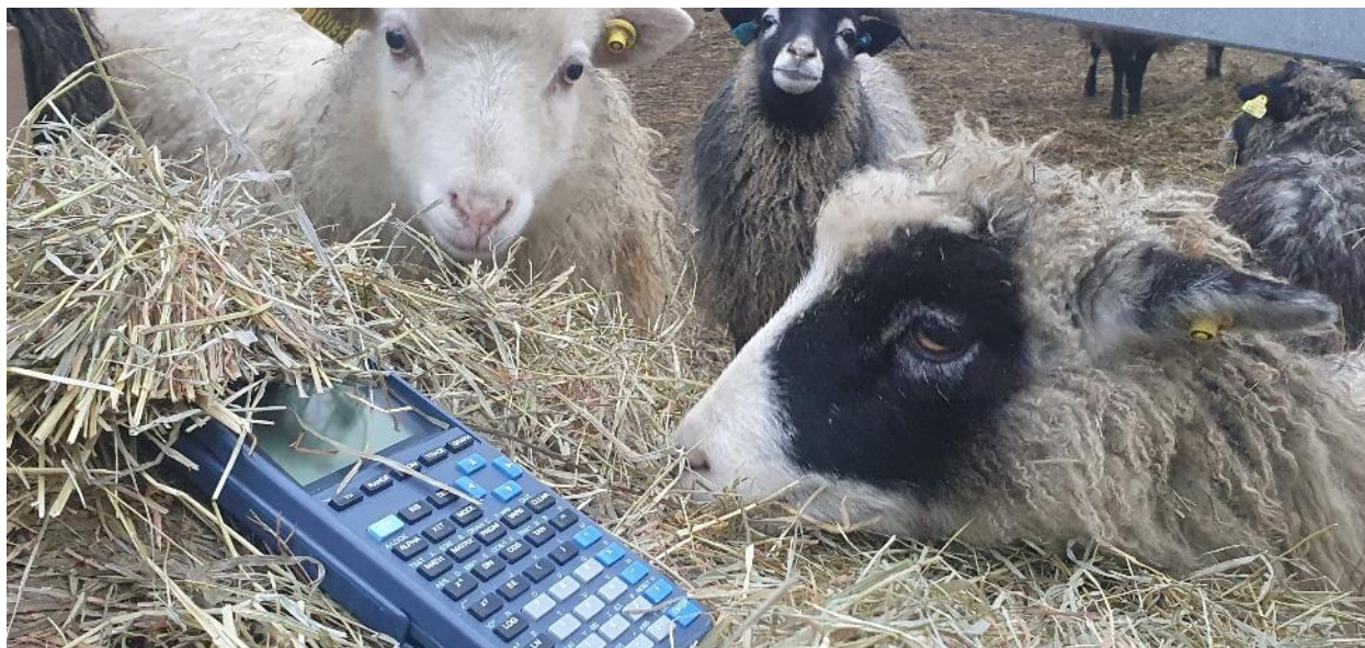
Klimakalkulatoren – et hjelpemiddel i klimarådgivingen.

Liste over rådgivere i Agder er tilgjengelig på Landbruksdirektoratets nettsider, og du finner fylkesvis oversikt over klimarådgivere på Landbruksdirektoratets nettside .