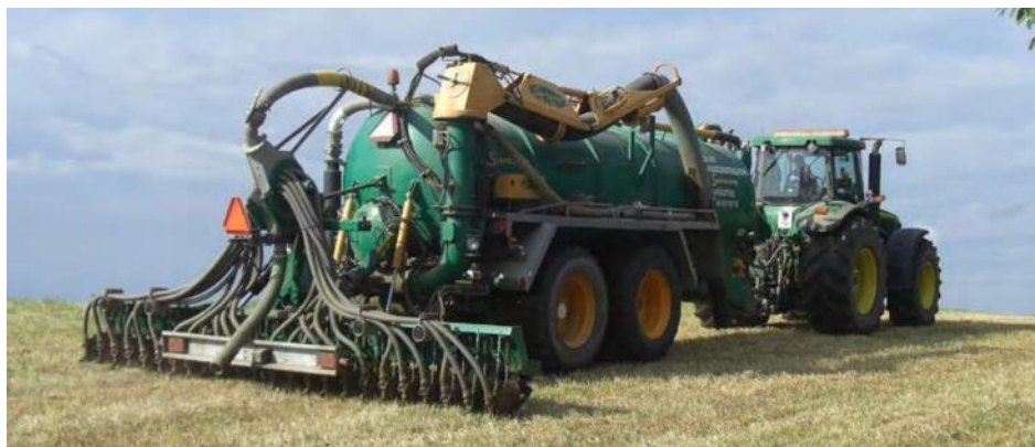
Nedfelling av husdyrgjødsel.

Tilskuddet kan kombineres med § 21 Spredning av all husdyrgjødsel om våren og eller i vekstsesongen på foretaksnivå, men arealet det søkes tilskudd for kan ikke overlappe.