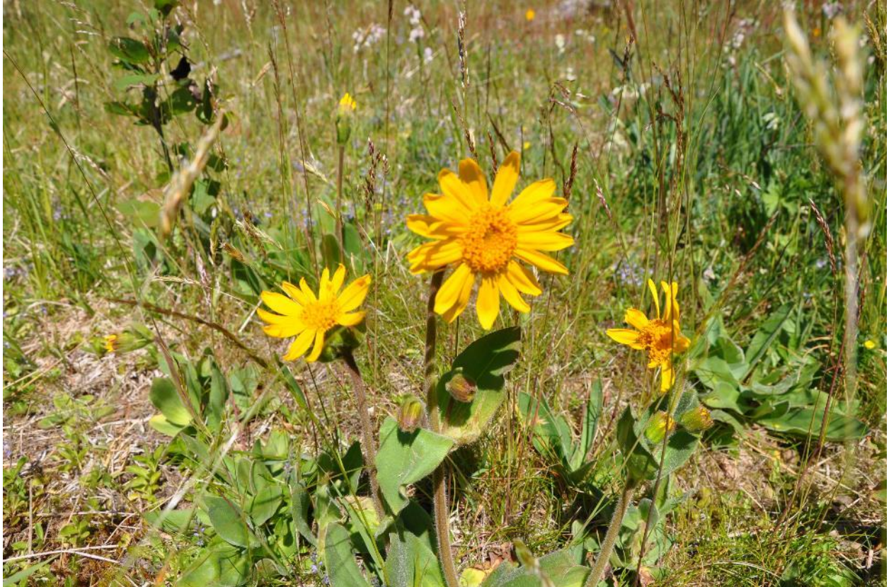
Solblom på slåttemark.

Skjøtselen skal i hovedsak utføres etter generelle skjøtselsråd.