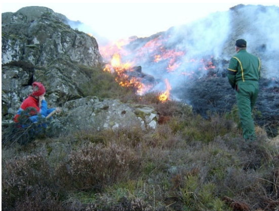
Skjøtsel av kystlynghei på Jølleheia