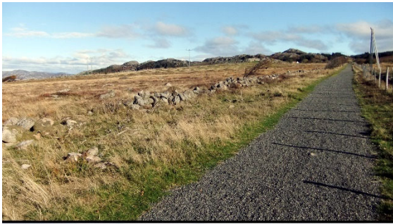
Restaurert steingjerde på Penne