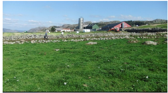
Istandsatte steinmurer på Kjølleberg