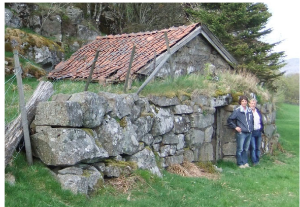
Istandsatt potetkjeller på Senneger