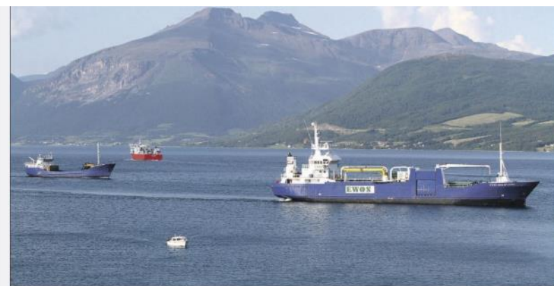
ØKENDT TRANSPORTBEHOV: Tilrettelegging for blant annet industriarealer i Balsfjord fører til et økende behov for transport mellom Balsfjord og resten av Troms både til vanns og til lands. Nå får de 600 000 kroner av Miljødirektoratet for å arbeide mot å bli en miljøvennlig industrikommune.

og klimatilpasset i vårt arkitektur- og område hvor man kan se flere tiltak som er i gang.