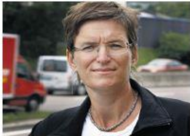
– Vi har prioritert ambisiøse prosjekter som gir store utslippsreduksjoner.

Ordringen ble innført i fjor, som et resultat av budsjettforliket i Stortinget. Miljødirektoratet administrerer den, og har nå behandlet søknadene som kom inn i februar.