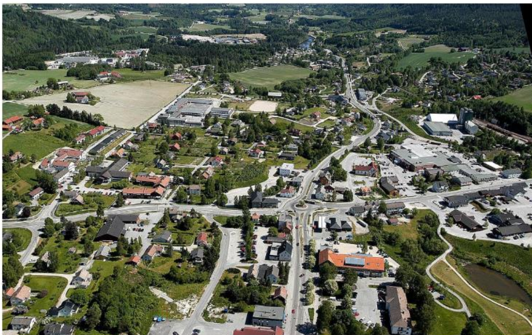
Bø sentrum, flyfoto, telemark sett fra luften, oven. På trykk 20041129