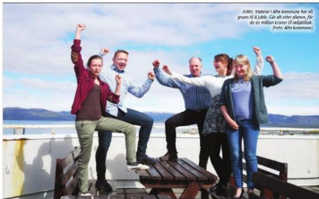
KLUBB: Støtten i Alta kommune har all grunn til å juble. Går alt etter planen, får de en million kroner til miljøtiltak.

■ I tillegg punkter for kommunale tjenestebiler