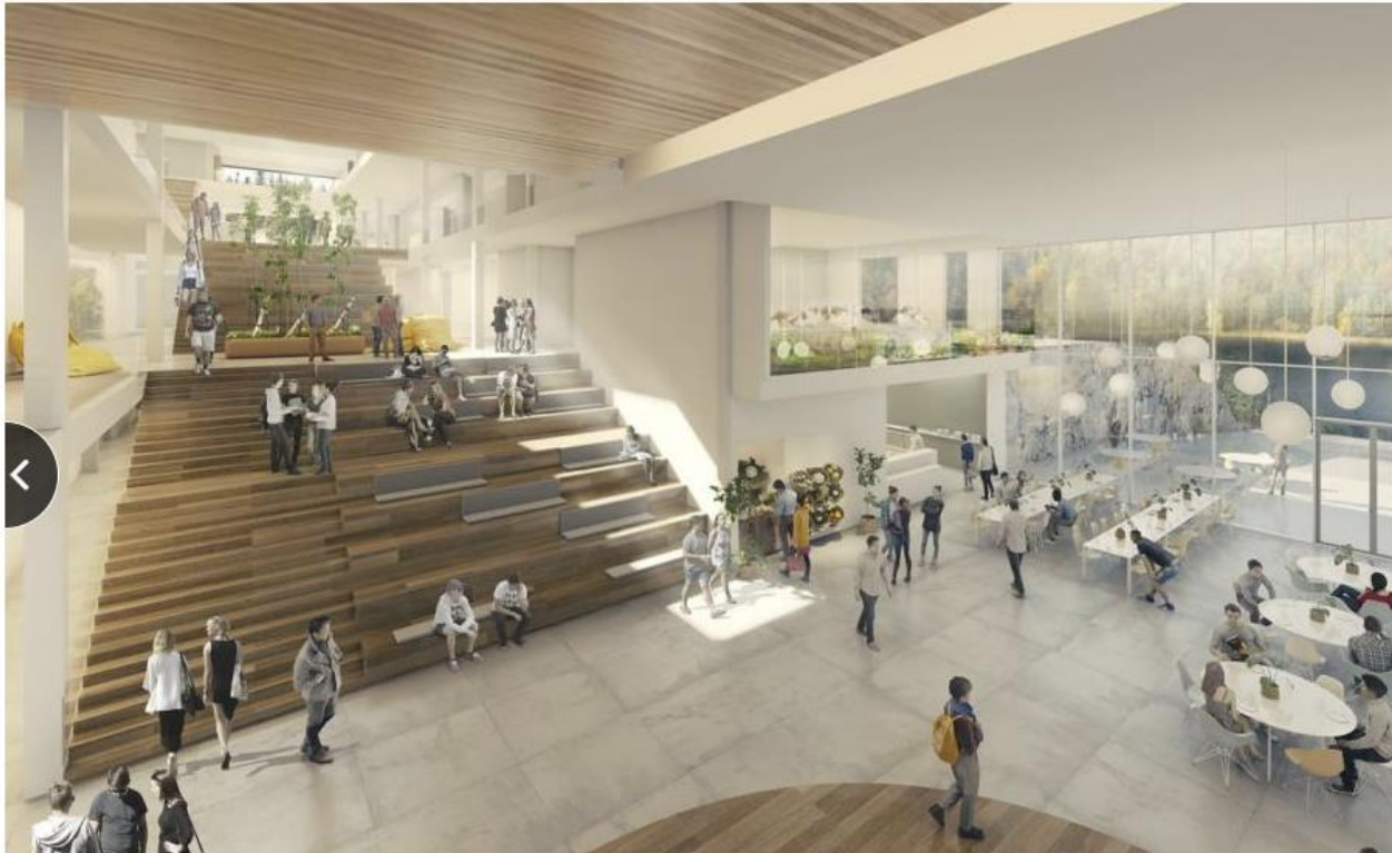
Fra skolens inngangsparti åpner etasjene seg oppover i allmenningen, og de som kommer blir møtt med nydelig utsyn mot Mjøvatn. (Illus: 3D illustratør: Archivisuals, Arkitekt: LINK arkitektur Landskap: Snøhetta)