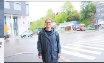
LANDMANNSTORGET: Framover rustes det opp på Landmannstorgtet, og et sykkelhotell må sees slik, mener Ohna.

«At kommunen nå skal utarbeide ny kommuneplan, og lagt opp til flere seminarer for ansatte, kommunestyret, næringslivet, skolen og øvrige innbyggere.