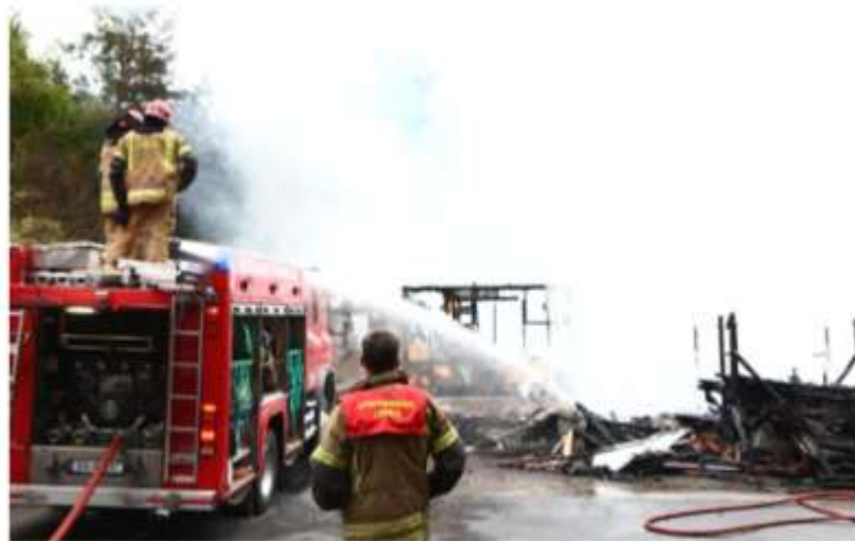
BRANT NED: Et bolighus på Sandeliv i Gjerstad brant til grunnen tidlig fredag morgen. Brannvesenet på plass etter utbruddet i Gjerstad.