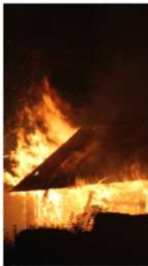
ILL FYR: Gjerstads var overbort da brannvesenet...