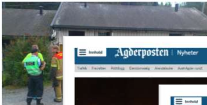
BRANN: Det begynte å brenne i en av...