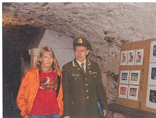
Bilde til venstre. Streif er smake, oppleve og lære, men også nyte naturen