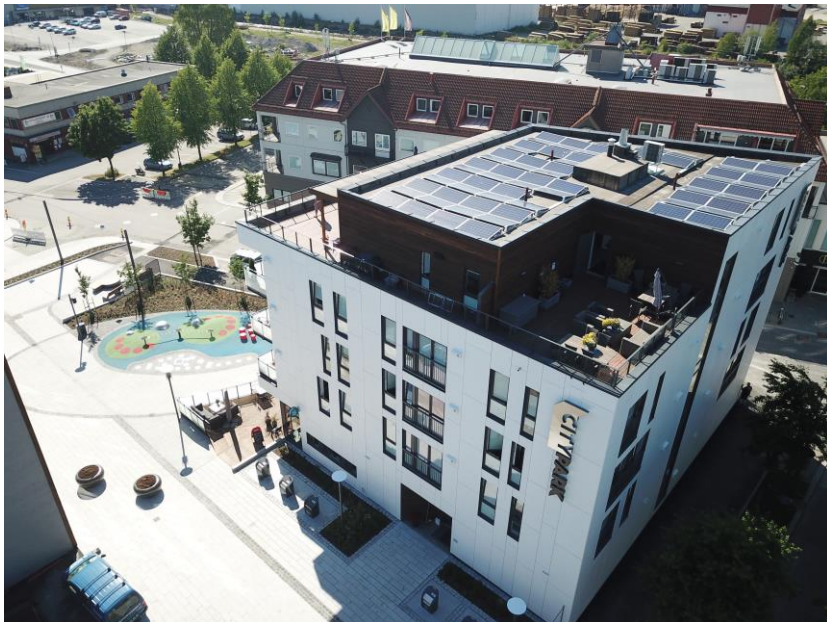
City Park, Brumunddal i Ringsaker kommune