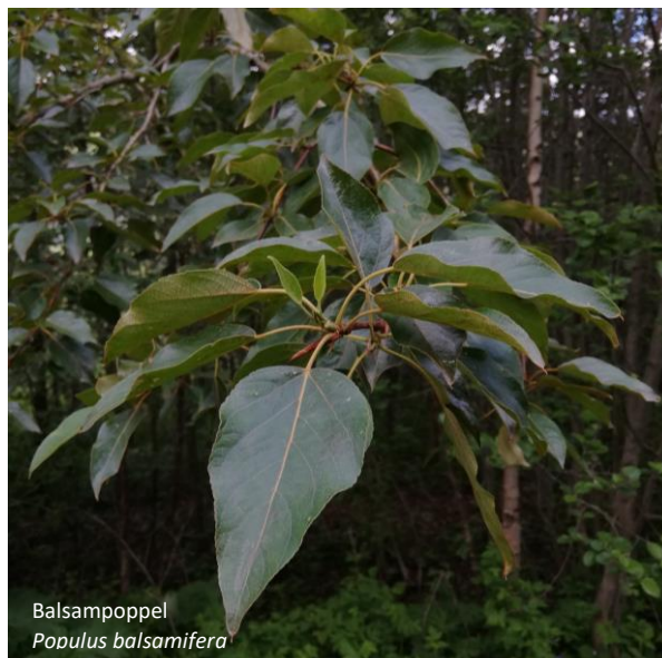
Balsampoppel Populus balsamifera

Tre med grå bark, gulgrønn på unge greiner, med høyde på 5-20 m. Knopper og unge blader med klar lukt av balsam, derav navnet. Arten er hardfør og har effektiv klonedannelse med rotskudd. Den kan forholdsvis effektivt skygge ut og fortrenge andre vekster. Den kan sette frø, men det er noe uklart om den gjør det i Norge.