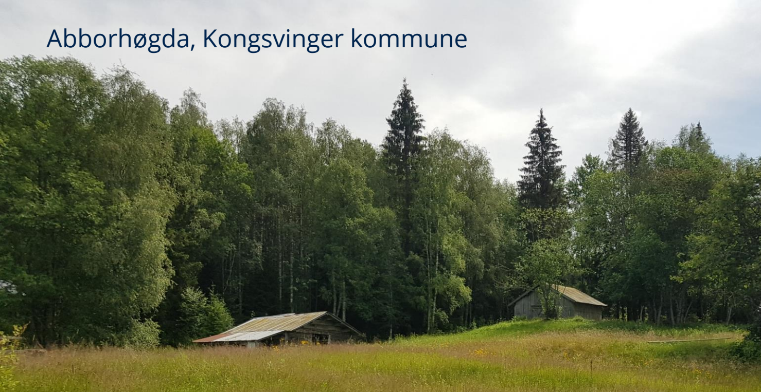
Abborhøgda, Kongsvinger kommune