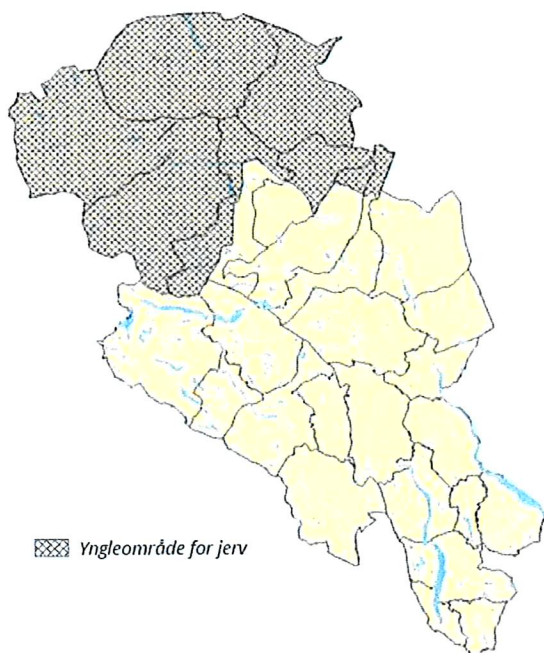
Figur 11a: Alternativ 1. Prioritert jervområde i region 3 (Oppland).