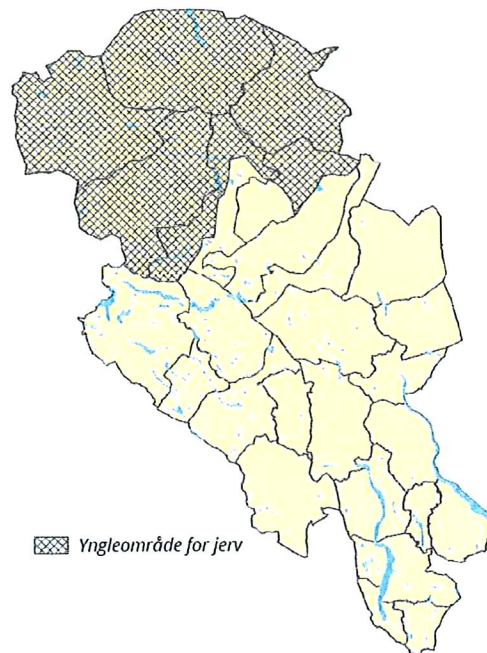
Figur 11b: Alternativ 2. Prioritert jervområde i region 3 (Oppland).

I tillegg til dette er forslaget til forvaltningsplan oppdatert med omsyn til kunnskapsgrunnlaget, der nasjonale føringar er lagt inn i dokumentet. Nemnda har også teke ein gjennomgang av prioriterte verkemiddel og tiltak mellom anna på bakgrunn av dei erfaringane dei har gjort seg sidan planen vart vedteke.