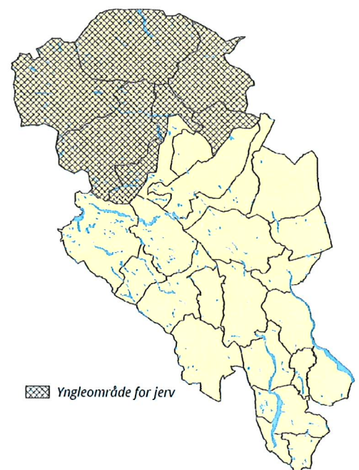
Figur 11b: Alternativ 2. Prioritert jervområde i region 3 (Oppland).

Mysusetter-Kampen beitelag har sendt en høringsuttalelse der de henstiller til at også Musvorddalen/Illmannsdalsområdet i Sel tas inn i området som er prioritert til beitedyr. De viser til høringsdokumentet der det står at det har vært ynglinger av jerv delvis på Fron-siden og Sel-siden av kommunegrensa i dette området, og mener at det derfor vil være naturlig å se disse områdene under ett.