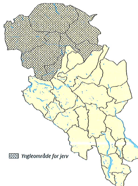
Figur 11b: Alternativ 2. Prioritert jervområde i region 3 (Oppland).

I tillegg til dette er forslaget til forvaltningsplan oppdatert med omsyn til kunnskapsgrunnlaget, der nasjonale føringar er lagt inn i dokumentet. Nemnda har også teke ein gjennomgang av prioriterte verkemiddel og tiltak mellom anna på bakgrunn av dei erfaringane dei har gjort seg sidan planen vart vedteke.