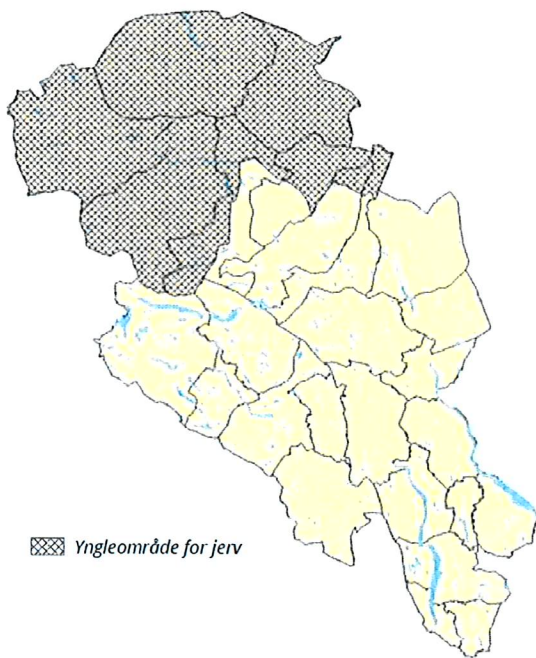
Figur 11a: Alternativ 1. Prioritert jervområde i region 3 (Oppland).