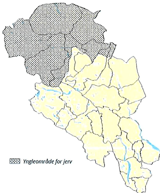
Figur 11a: Alternativ 1. Prioritert jervområde i region 3 (Oppland).

alternativ til ny sonering for jerv. Det eine høyringsalternativet (alternativ 1) er som jervesona har vore sidan 2012. I det andre alternativet (alternativ 2) er heile Fronskommunane i Gudbrandsdalen teke ut av jervesona og i si heilhet fått status som beiteprioritert.