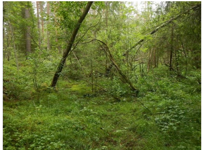
Figur 3a. Skjøtselzone 2. Tv. Rik svartor(-gran)sump/kildeskog med yngre, flerstammete svartorindivider. Til venstre i bilde sees et svært gammelt individ med svartorstamme på en meget grov sokkel/tue. Th. rik gråseljesumpskog i øvre (søndre) del av skjøtselsonen. (foto: TEB).