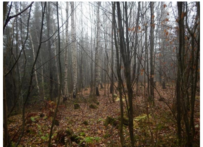
Figur 8. Skjøtselzone 7. Yngre lauvsuksesjon, tv. frisk utforming med gråor, th. mest bjørk, selje.