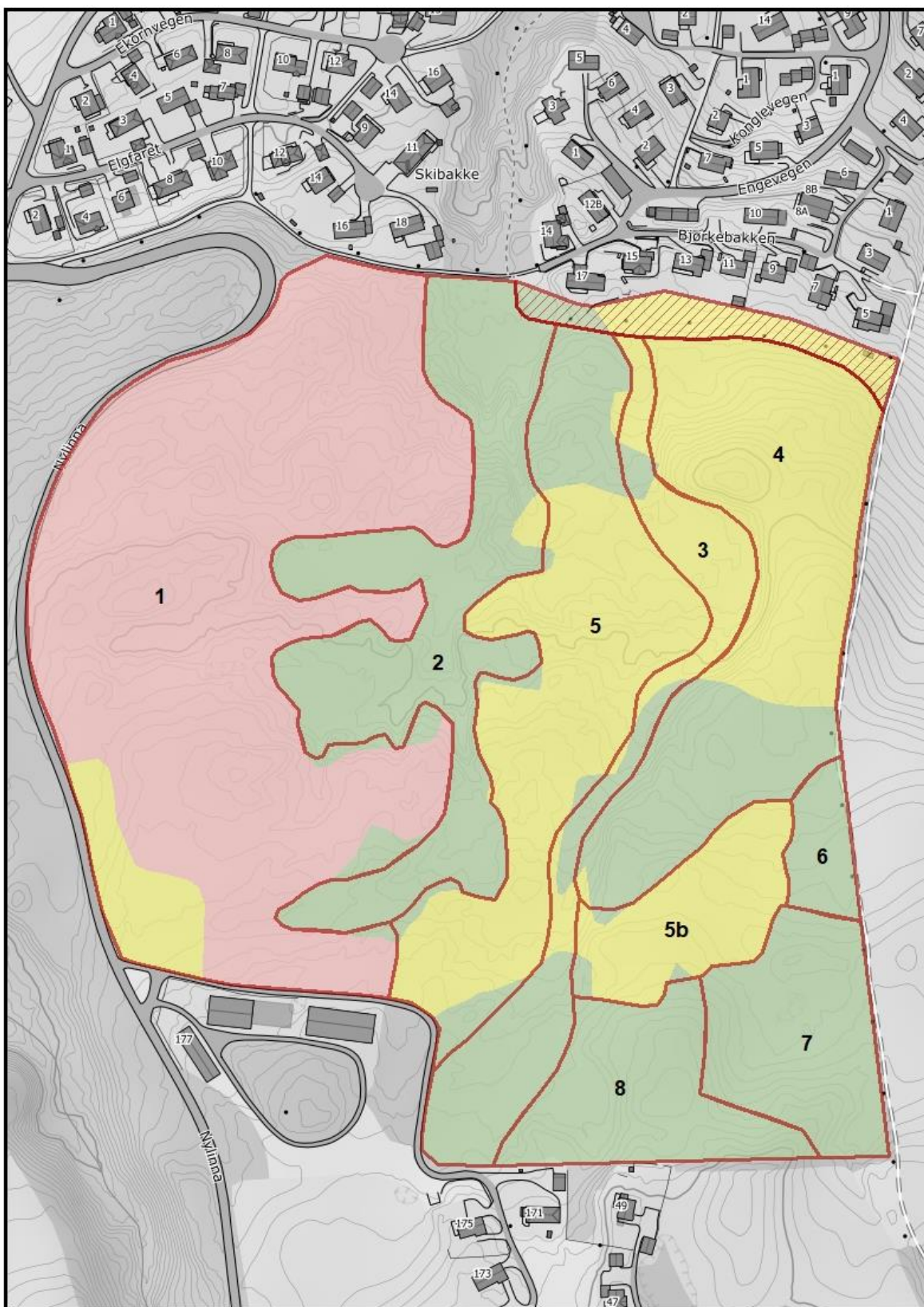
Figur 1. Kile naturreservat, Østre Toten, inndelt i 8 skjøtselsoener, samt inndelt i hogstklasser. Rødt: hogstklasse 5 (hogstmoden). Gult: hogstklasse 4. Grønt: hogstklasse 3 (yngre skog; flatehogd på 1970-80 tallet). Rød skraver i NØ representerer en stripe mellom gangveg og bebyggelse som vil bli foreslått tatt ut av reservatet gjennom en grensendring.