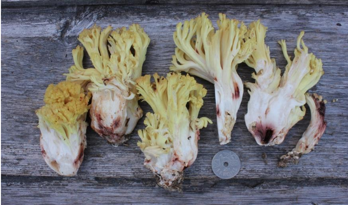
Blodflekkorallsopp Ramaria sanguinea (VU), en av flere kalkbarskogsopper som er registrert i reservatet.

skjøtsel (NINA), (ii) statsforvalteren(/fylkesmannens) prioriteringer og omfang av tiltak, samt (iii) gjennomføring av konkrete tiltak (Kistefos Skogtjenester). Kart med skjøtseloner er utarbeidet av Tor Erik Brandrud, og digitalisert og oppdatert av Statsforvalteren i Innlandet v/ Harald Klæbo og Victoria Kristiansen.