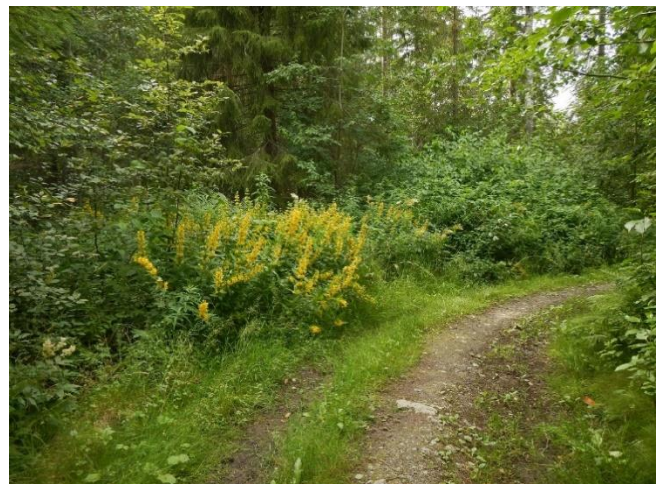
Figur 3b. Skjøtselzone 2. Tv. Kalkgranskog langs ravine i nedre del (lokalitet for bruntuppkorallsopp VU). Th. Forekomst av flere fremmearter (bl.a. fagerfredløs, sibirkornell) langs gangvei helt nederst.