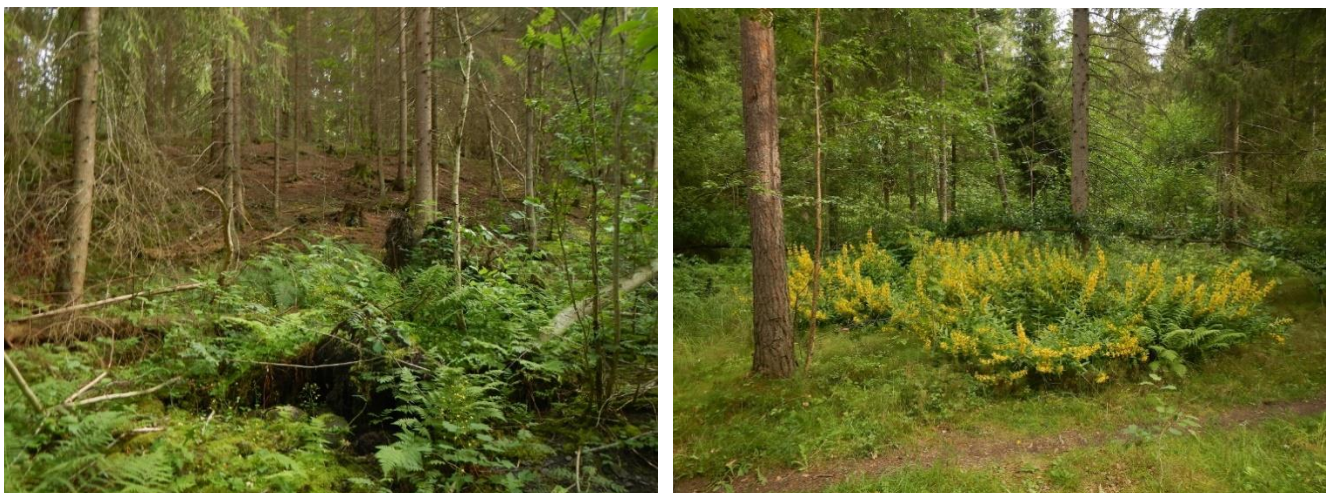
Figur 4. Skjøtselzone 3. Tv.: Gråorsumpskog med noe ask langs bekk (midtre del). (Plantet granskog i sone 4 i bakgrunnen.) Th.: En liten forekomst (klon) av fagerfredløs mellom bekk og sti i nedre del. (foto: TEB).

Prioritet: 1. prioritet i nærmeste 5-års periode. Fristilling av ask prioriteres både i sone 3 og 4.