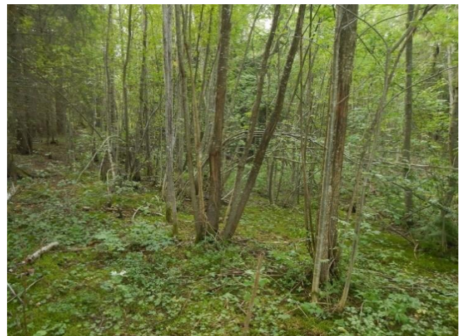
Figur 5. Skjøtselzone 4. Tv.: fra kolle i NØ; bjørk-osp-dominert lauvsuksesjon fra tidligere mer åpen hagemark. Tv.: Frisk lauvsuksesjon med bl.a. gråor, hegg, ask. Merk flerstammete individer fra gamle stubber.