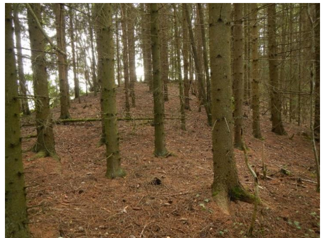
Figur 9. Skjøtselzone 8. Tett til meget tett, ca 50 år gamle granplantefelt. Th. fra kolle mot jorde i S (foto: TEB).