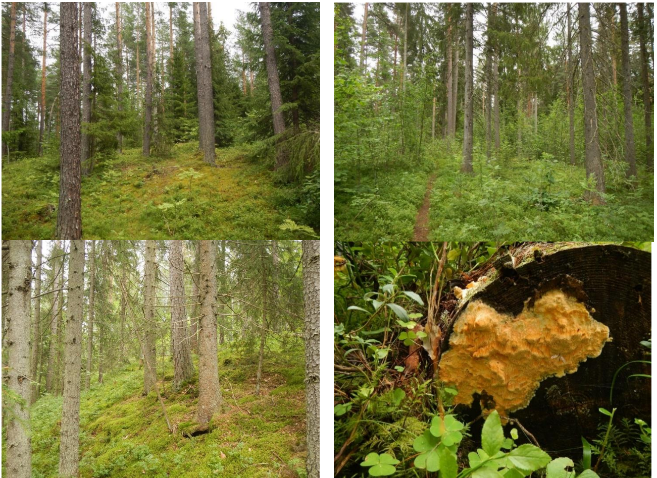
Figur 2. Skjøtselzone 1. Øverst tv.: Moserik lågurtfuruskog med typisk, gammelt beiteskogspreget, med overstandere av furu, og en del yngre gran. Øverst th.: Stedvis en del lauvoppslag etter plukkhogst for 20 år siden. Nederst tv.: Parti med grunnlent, moserik kalkgranskog ned mot sump/dam; hotspot for rødlistede kalkbarskogsopper. Nederst th.: Oransjekjuke Hapalopilus aurantiacus (NT) på furubult.

Prioritet: 1 prioritet for skjøtsel. Det bør i første 5-års periode prioriteres både inngjerding av furuforyngelse, i hvertfall et lite antall på forsøksbasis, samt fristilling av furuer, dessuten uttak av granoppslag, og noe lauvoppslag. Effekter av fortetning bør overvåkes.