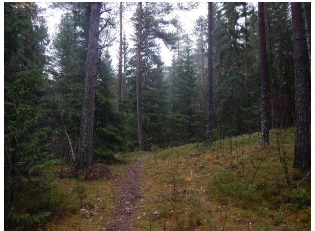
Figur 6. Skjøtselzone 5. Eldre lågurtfuruskog, med innslag av gran. Tv. fra referanseområde sone 5b.