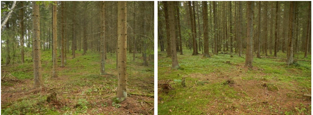
Figur 7. Skjøtselzone 6. Plantet, drøyt 50 år gammel granskog, Noe tynning har vært foretatt, inkludert etablering av enkelte små åpninger (th.).

Prioritet: 1. prioritet for skjøtsel. Tiltak her prioriteres i rekkefølge etter tiltak i sone 8, siden det er allerede foretatt noe tynning.