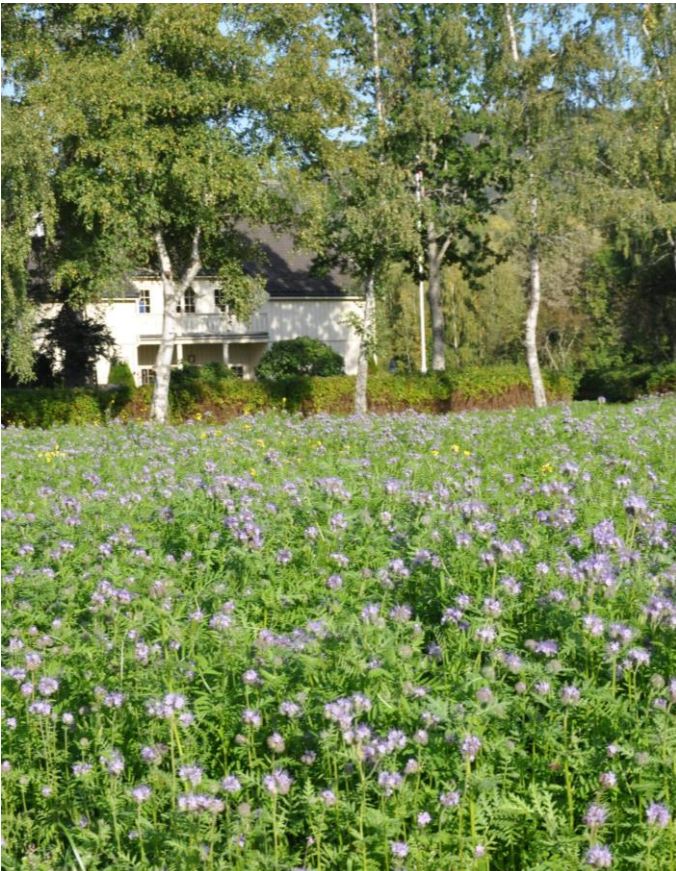
Blomstrende stripe med honningurt langs jordekant.