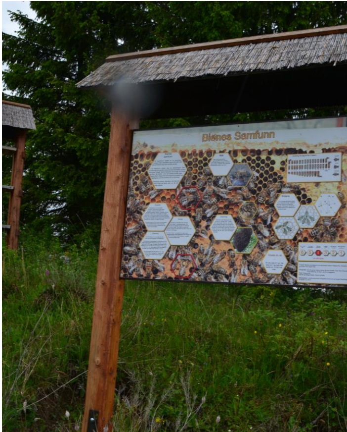
Informasjonsplakat ved biestien på Helgøya