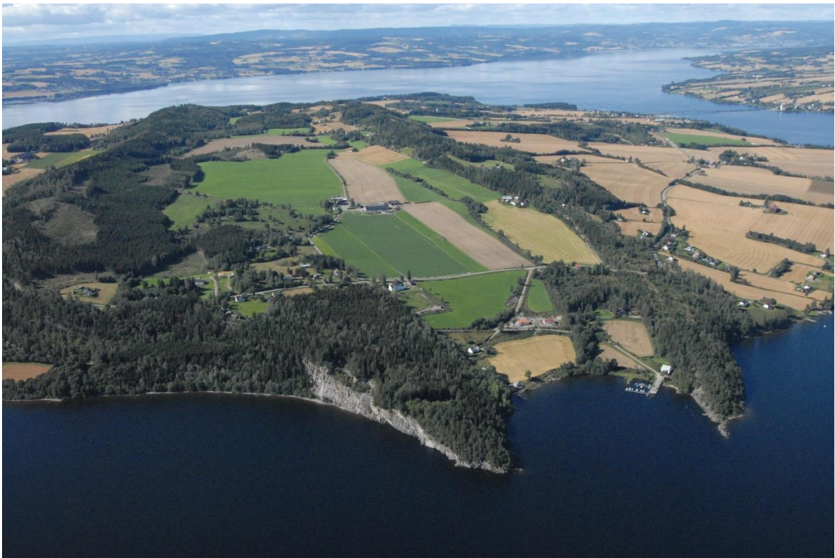
Helgøya - midt i Mjøsa.

Utarbeidet av Fylkesmannen i Hedmark i samarbeid med arbeidsgruppa for Helgøya oktober 2017.