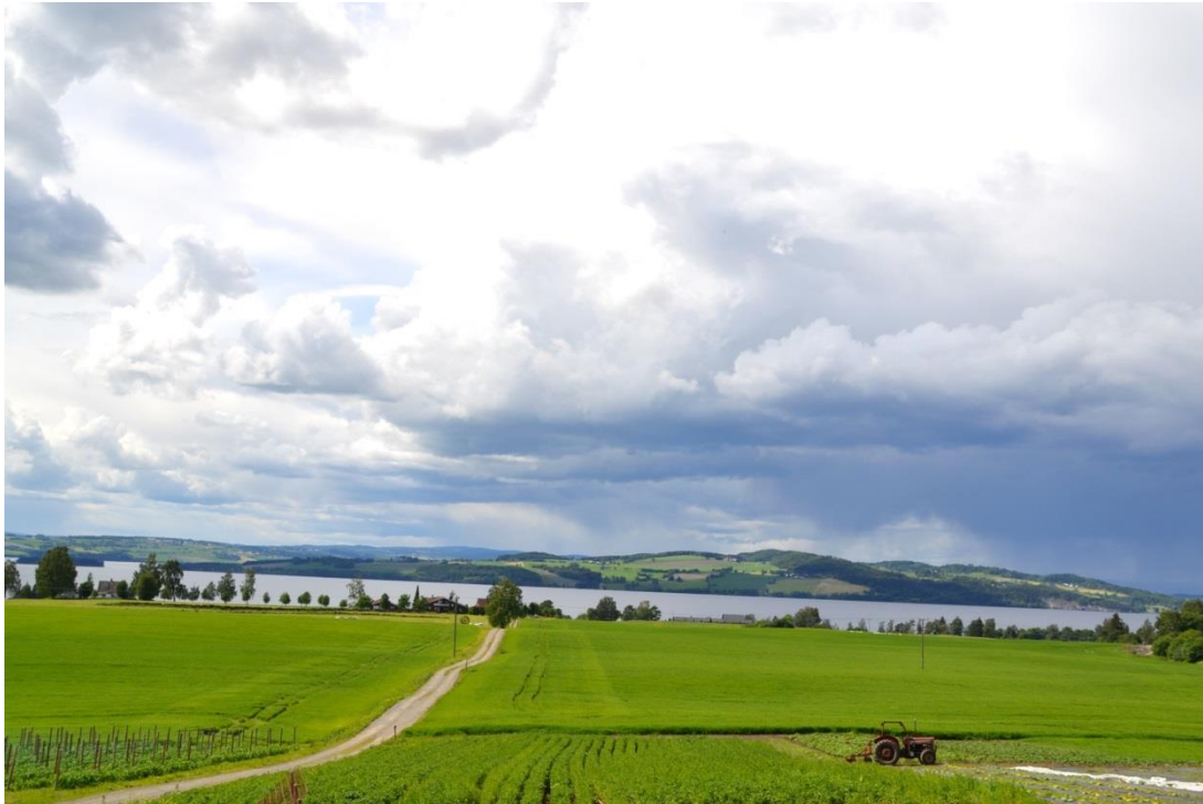
Helgøya sett fra Stangelandet.

Helgøya ligger midt i Mjøsa og er Norges største innlandsøy. Øyas areal er totalt 18,4 km 2 . Fra østsida er det god utsikt over Stangelandet og Hamar, fra vestsida ser vi over til Kapp og Toten. I nord er øya bundet sammen med fastlandet på Nes med ei bru over Nessundet. Eksberget strekker seg som en høyde tvers over øya i øst-vest-retning og fra toppen av berget (300 m.o.h.), omtrent midt på øya, heller landskapet ned mot Mjøsas bredd.