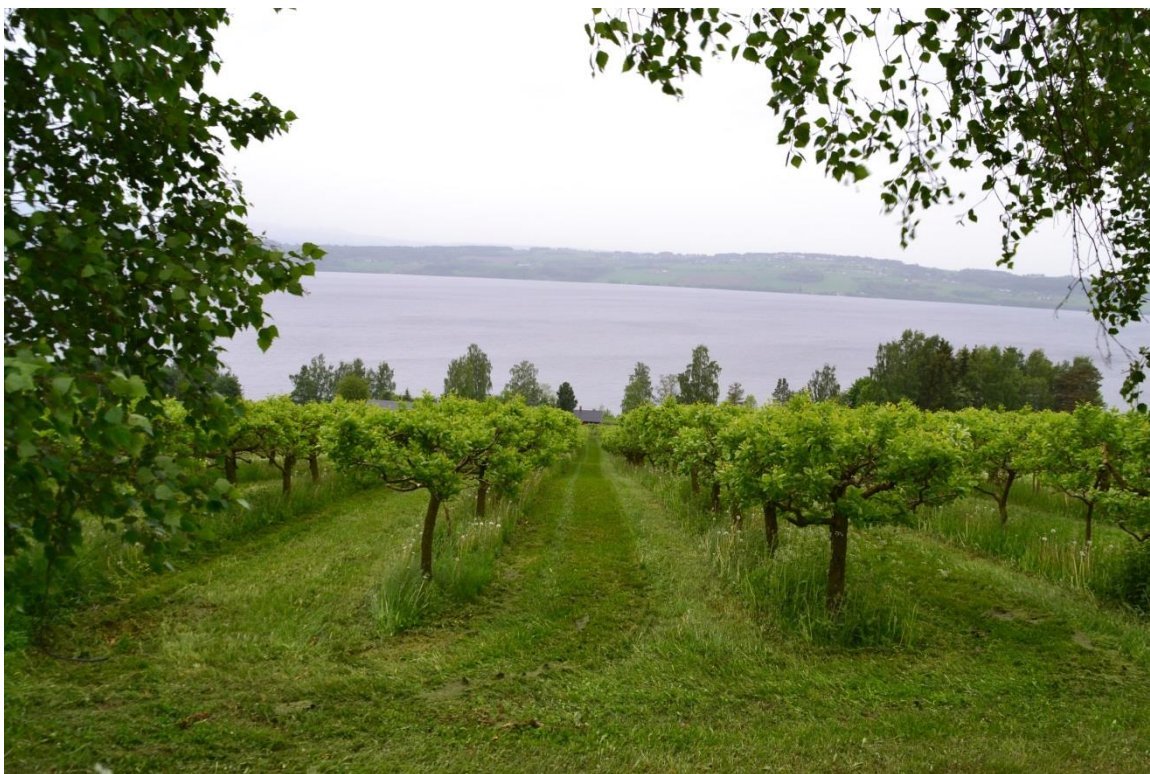
Variasjonen i antall produksjoner er stor. Her dyrkes epler.

Helgøya er et svært godt besøkt område. Flere tusen turister besøker øya hvert år. Både Skafferiet på Hovinsholm, 1840-tallshagen på Hovelsrud og klatreparken trekker store mengder besøkende. I tillegg er øya i seg selv et besøksmål for både turgåere, syklende, båtfolk og bilturister som ønsker å oppleve de unike kvalitetene øya har å by på.