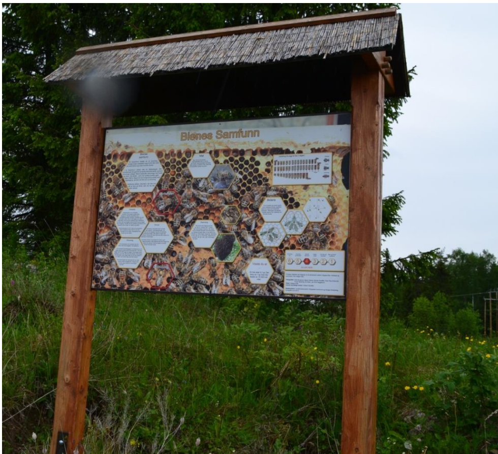
Biestien ble etablert i 2014.

Det er gjort en stor jobb lokalt på øya i forhold til tilrettelegging for rekreasjon og friluftsliv . En sykkelsti rundt øya er tilrettelagt og merket. Det har også vært gjennomført et prosjekt som er kalt "Trygg skolevei" der gutuer og gamle ferdsselsveier på øya er tatt i bruk. Det er lagt ned mange dugnadstimer med å merke og rydde stier og det er tilrettelagt med raste- og hvileplasser både i gapahuker og benker. I 2014 ble Biestien etablert. Langs denne stien er det satt opp biehoteller og det er satt opp tavler med informasjon om bier og nytten vi har av insekter.