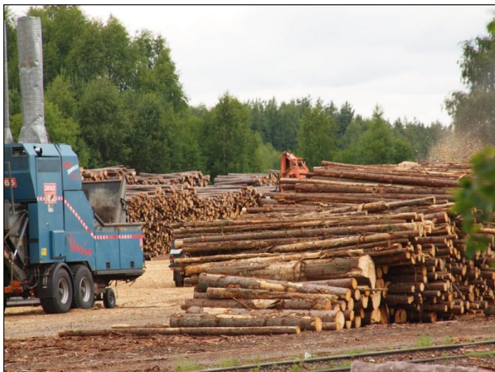
Tømmerlager på industritomt.

Se også: www.fmhe.no > Landbruk > Skogskader