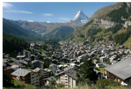
Bildet oppgitt med å tegne Norge valvise, mest truslede, innsatsene og fastgjorte miljøet til fjell, sier Erling Døkk Holm. Her fra oppgitt. Bildet er tatt.

Den uberørte naturen man lokker nye hytteeiere med, er det samme godet man bygger ned.