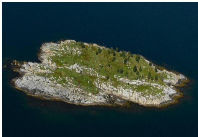
Figur 2: Flyfoto av Prestholmen naturreservat.

Forvaltningsmål er eit samleomgrep for alle målsetjingar knytte til eit verneområde, t.d. verdiar knytte til areal, artar eller brukar- og næringsinteresser.