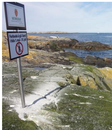
Figur 4: Merking av Grip naturreservat.

Med ein stadig veksande privat småbåtflåte på kysten og i fjordane, er det viktig å informere sjøfarande om vernet og om ferdselsforbodet i hekketida. Vi ser det også som eit mål å informere om fuglelivet og naturkvalitetane i sjøfuglreservata. Fylkesmannen vil utarbeide informasjonsplakatar om naturreservatet med m.a. kart, foto og vernereglar til å hengje opp på plassar der båtfolk ferdast, t.d. småbåthamna.