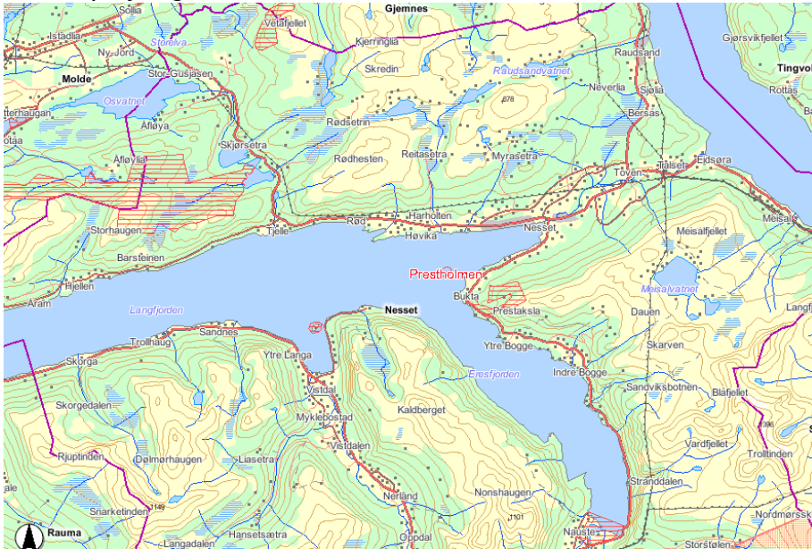
Figur 1: Prestholmen naturreservat ligg i Nesset kommune ( www.dirnat.no/kart/naturbase ).

Prestholmen naturreservat vart oppretta ved kongeleg resolusjon av 28. mai 2010 i samband med verneplan for hekkande sjøfugl i Møre og Romsdal. Formålet med vernet er i følgje § 2 i verneforskrifta; “å ta vare på eit område som har særskilt verdi for biologisk mangfald og som inneheld trua, sjeldsynt og sårbar natur. Området omfattar ein av svært få opne holmar i indre fjordstrøk i fylket som er urørt. Saman med omliggande sjøområde og naturleg tilhøyrande plante- og dyreliv. Området utgjør ein viktig hekkelokalitet for sjøfugl som blant anna krykkje og måker,”