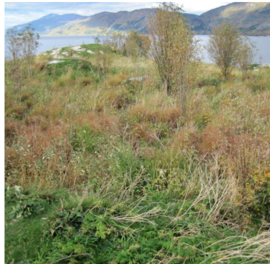
Figur 3: Prestholmen er under gjengroing. Bildet er tatt mot vest.

Tre, buskar og kratt må fjernast før dei blir så høge og av eit slikt omfang at det reduserer kvaliteten på området som hekkeplass for sjøfugl. Vegetasjonen bør haldast så låg at han ikkje tek den frie utsikta for fuglar som ligg på reir, gir færre reirplassar eller kan fungere som sitjeplassar/skjul for eggrøvarar som kråke og ramn.