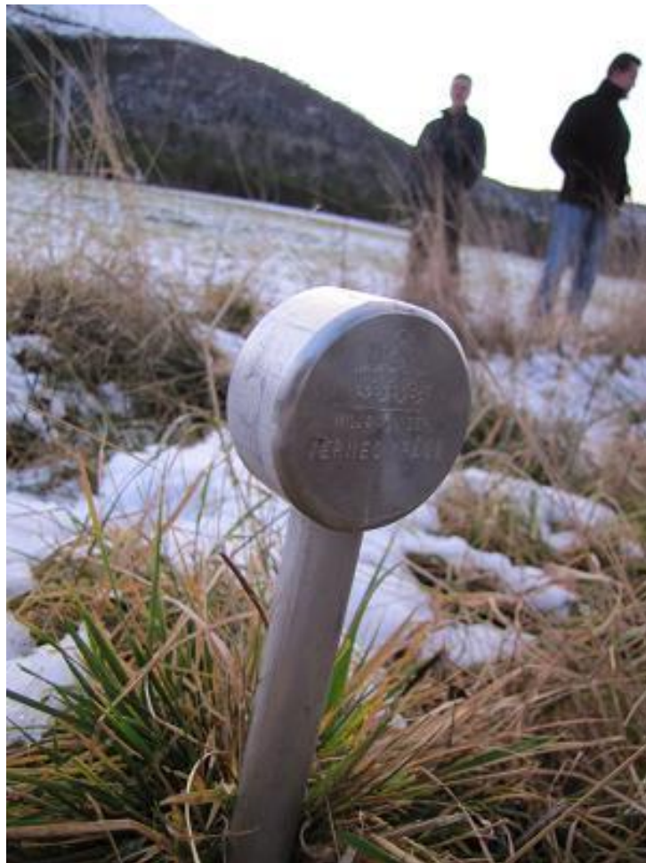
Fig. 12. Grensemerke for verneområde

Forvaltingsplanen for Farstadbukta naturreservat gjeld fram til ny forvaltingsplan er vedtatt. Fylkesmannen er ansvarleg for revideringa av planen. Ein tek sikte på å gjere dette ca. kvart 10. år, første gong ca. 2020. Fylkesmannen kan revidere planen på eit tidligare tidspunkt om det er nødvendig. Bevaringsmåla vil bli reviderte i samsvar med nasjonale standardar når desse føreligg, uavhengig av rulleringa av forvaltingsplanen.