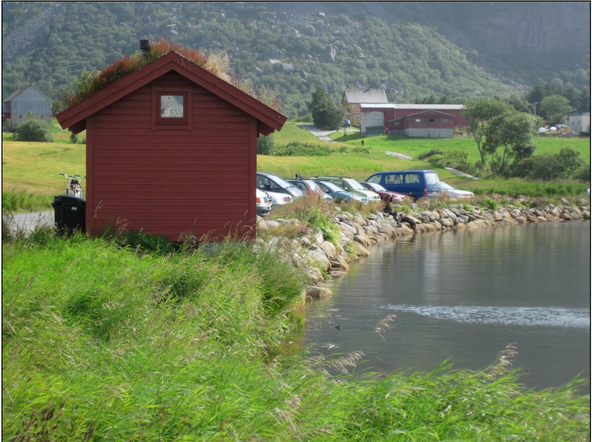
Fig. 6. Det er lagt til rette med parkering og toalettbygg for friluftsområdet.