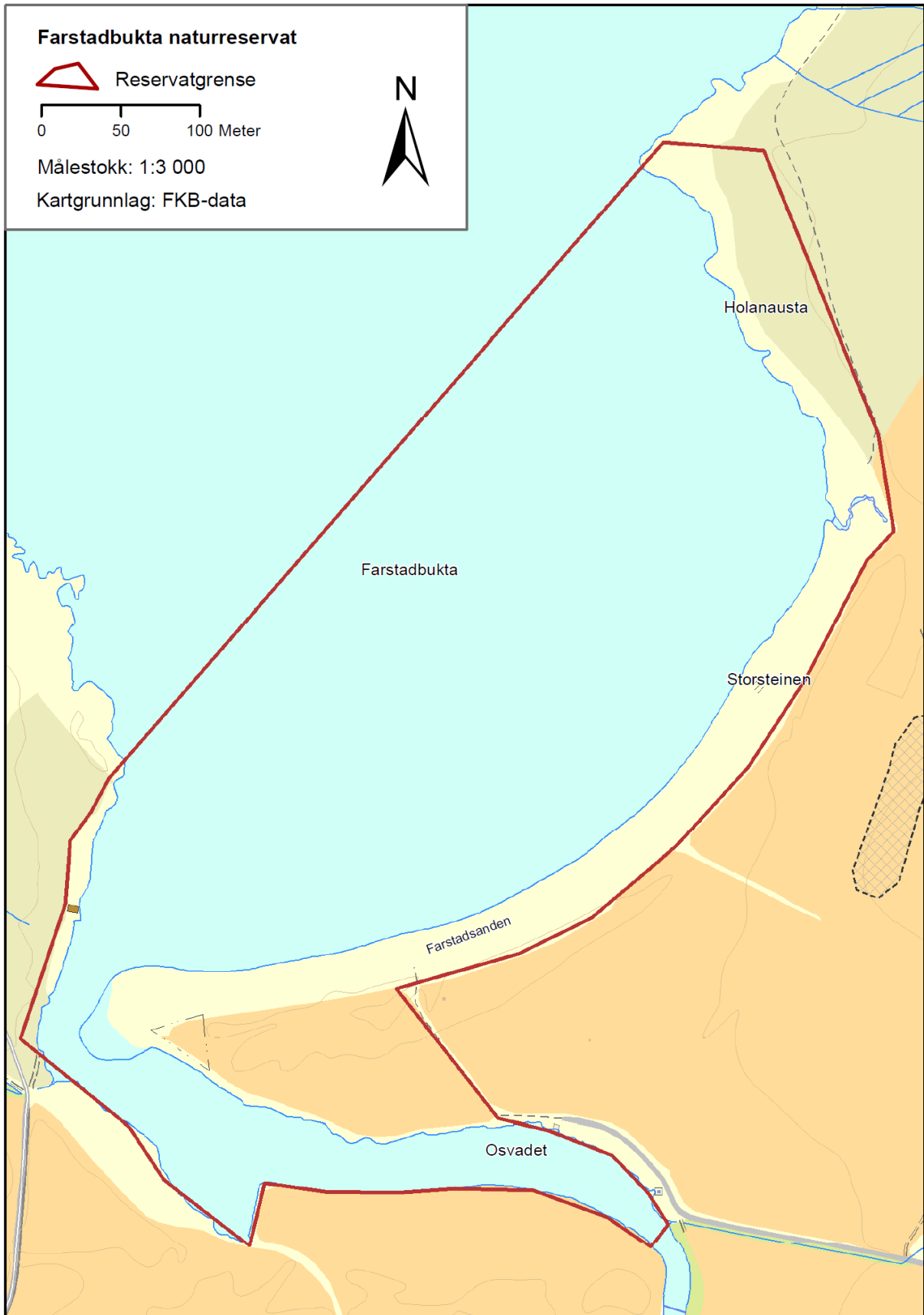
Fig 1. Kart over Farstadbukta naturreservat