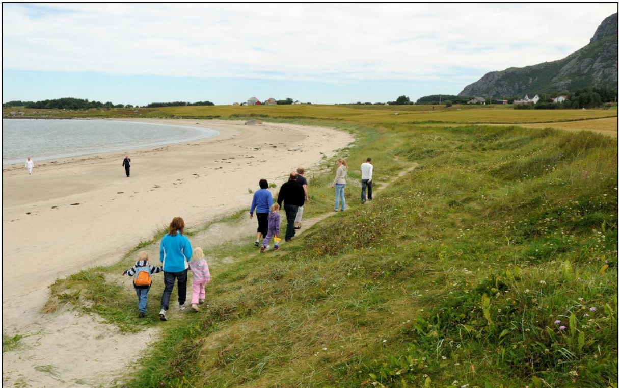
Fig. 7. Farstadstranda er eit populært turområde, men dette gjev slitasje på sanddynene