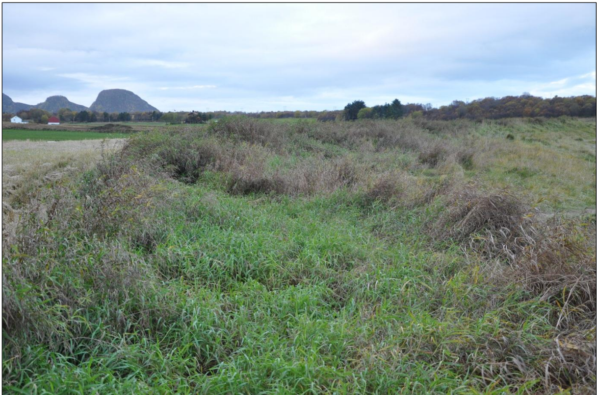
Fig 9. Det er kraftig gjengroing i bakkant av stranda.

Bak sanddynene på Farstadsanden er det aukande gjengroing. Her er det tilførsel av gjødsel frå dyrkamarka bakom. Gras- og urtevekstene bør fjernast, anten ved beiting, eller ved at området vert slått seint i sesongen og biomassen vert fjerna.