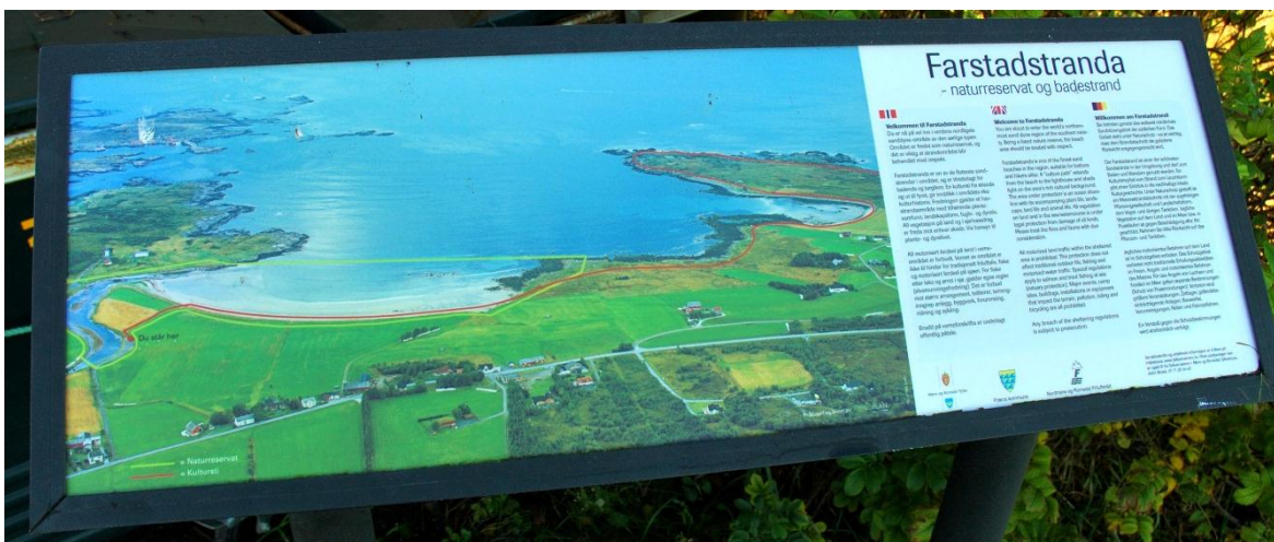
Fig. 11. Informasjonstavle om friluftsområdet inkl. info om naturreservatet

Det er sett opp ei informasjonstavle for Farstadsanden friluftsområde der det også er informasjon om naturreservatet. Det er ikkje nok informasjon om vernekvalitetane, så difor bør det supplerast med meir naturinformasjon. Det er sett opp skilt om bandtvang. All informasjon skal utarbeidast av eller i samarbeid med fylkesmannen.