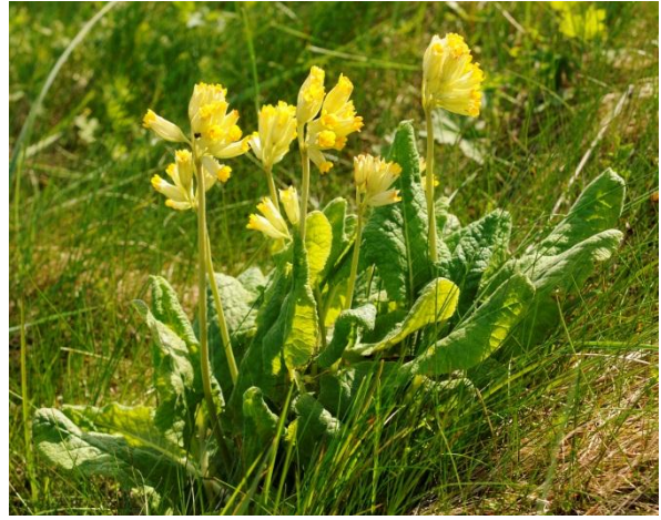
Fig 4: Marianøkleblom har ein av to førekomstar i fylket i Farstadbukta