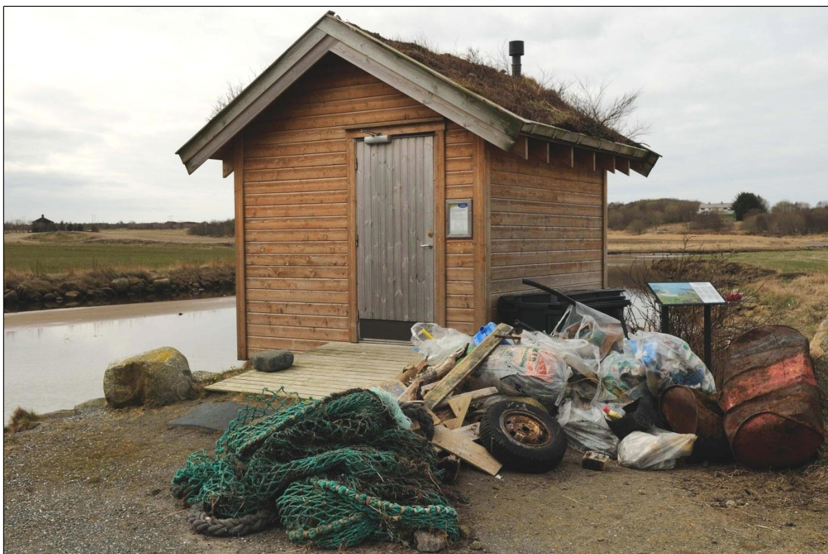
Fig. 10. Det er behov for årleg rydding av strandsøppel. Toalettbygget til friluftsområdet.

Søppel langs stranda må følgjast med, og ryddast når det er naudsynt. Verneområdet er vendt mot nord og vest og samlar av den grunn ein god del søppel frå sjøen.