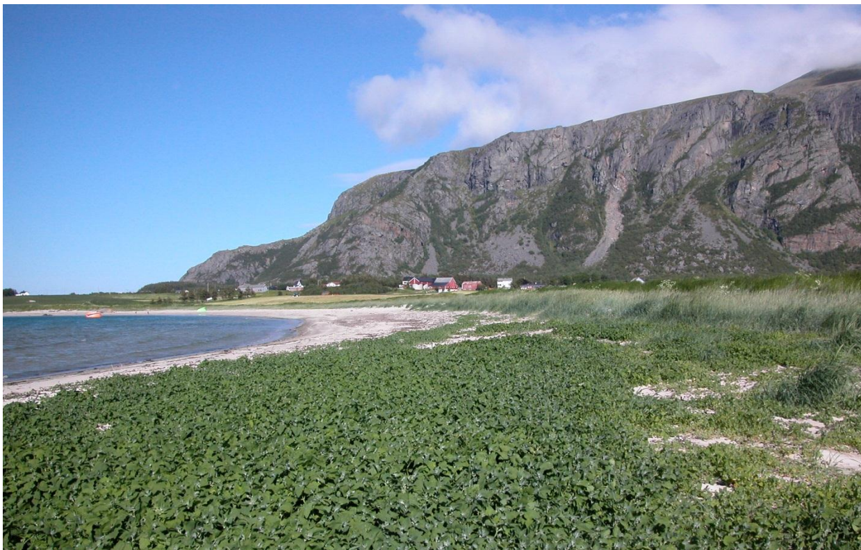
Fig 2. Sandstranda med typisk vegetasjon som tangmelde i framgrunnen og strandrug på sanddynene bakom.