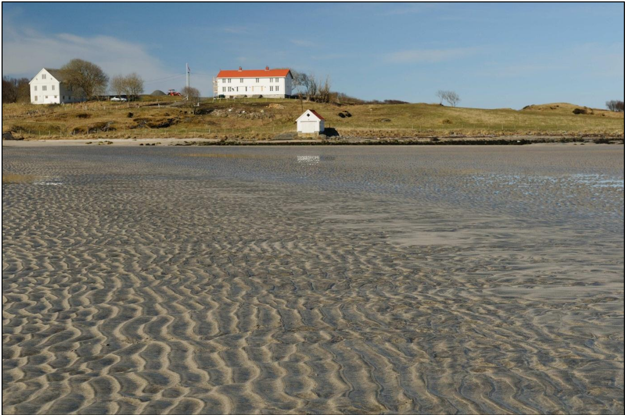
Fig. 8. Mot Farstadberget