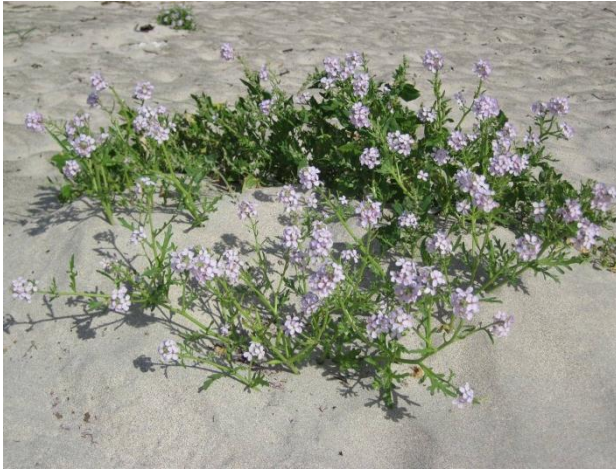
Fig 3: Strandreddik veks på sandstrendene

aff. phlebophorus ). Bleikløte, sandsiv, strandkveke og sandslirekne synest å vere utgått. (Jordal 2005).