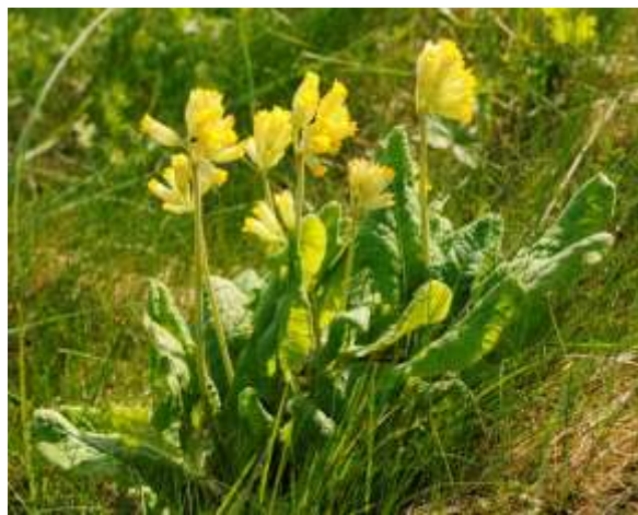
Fig 4: Marianøkleblom har ein av to førekomstar i fylket i Farstadbukta