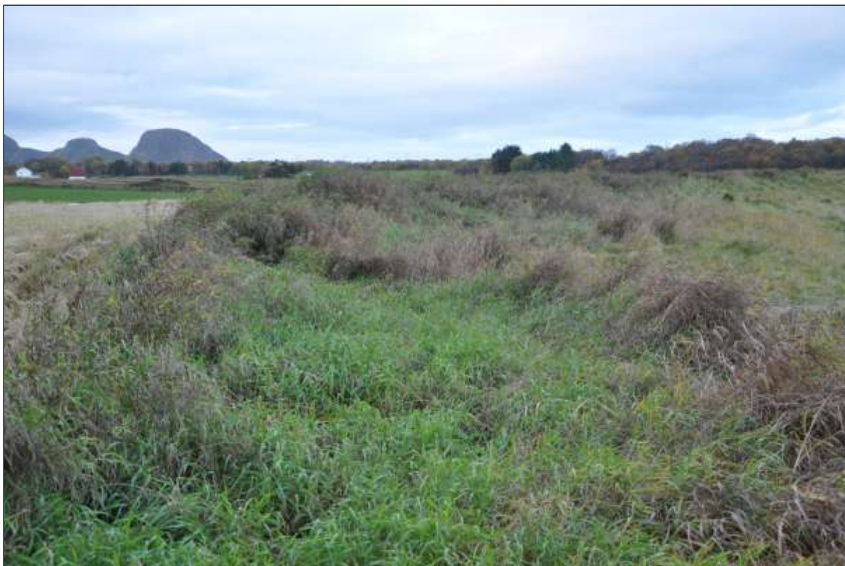
Fig 9. Det er kraftig gjengroing i bakkant av stranda.

Bak sanddynene på Farstadsanden er det aukande gjengroing. Her er det tilførsel av gjødsel frå dyrkamarka bakom. Gras- og urtevekstene bør fjernast, anten ved beiting, eller ved at området vert slått seint i sesongen og biomassen vert fjerna.