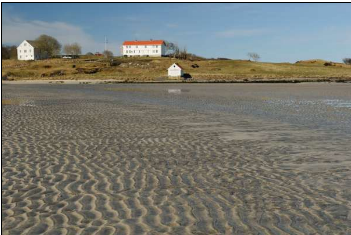
Fig. 8. Mot Farstadberget