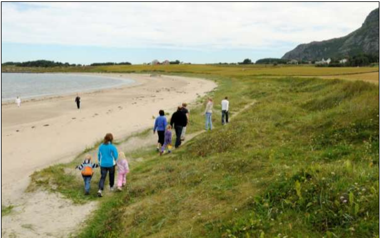
Fig. 7. Farstadstranda er eit populært turområde, men dette gjev slitasje på sanddynene