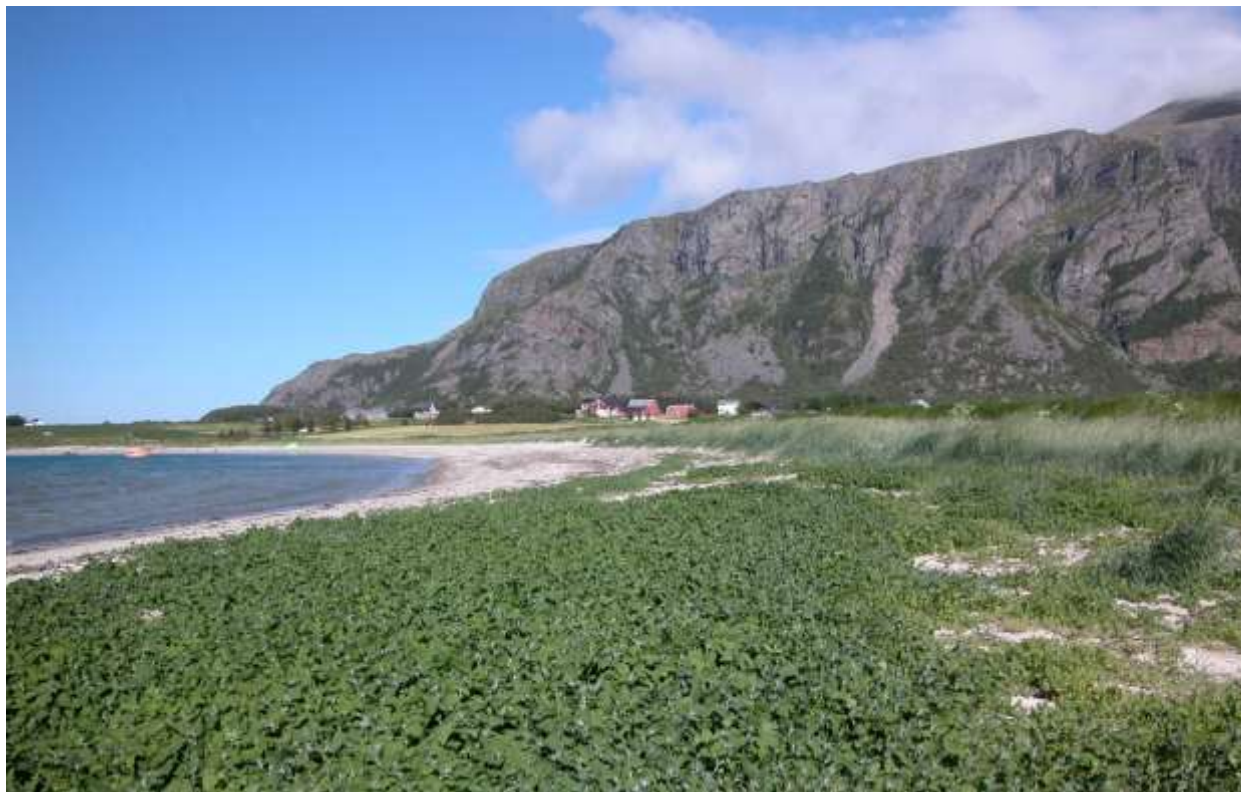
Fig 2. Sandstranda med typisk vegetasjon som tangmelde i framgrunnen og strandrug på sanddynene bakom.