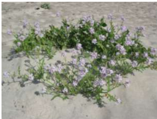
Fig 3: Strandreddik veks på sandstrendene

aff. phlebophorus ). Bleiksøte, sandsiv, strandkveke og sandslirekne synest å vere utgått. (Jordal 2005).