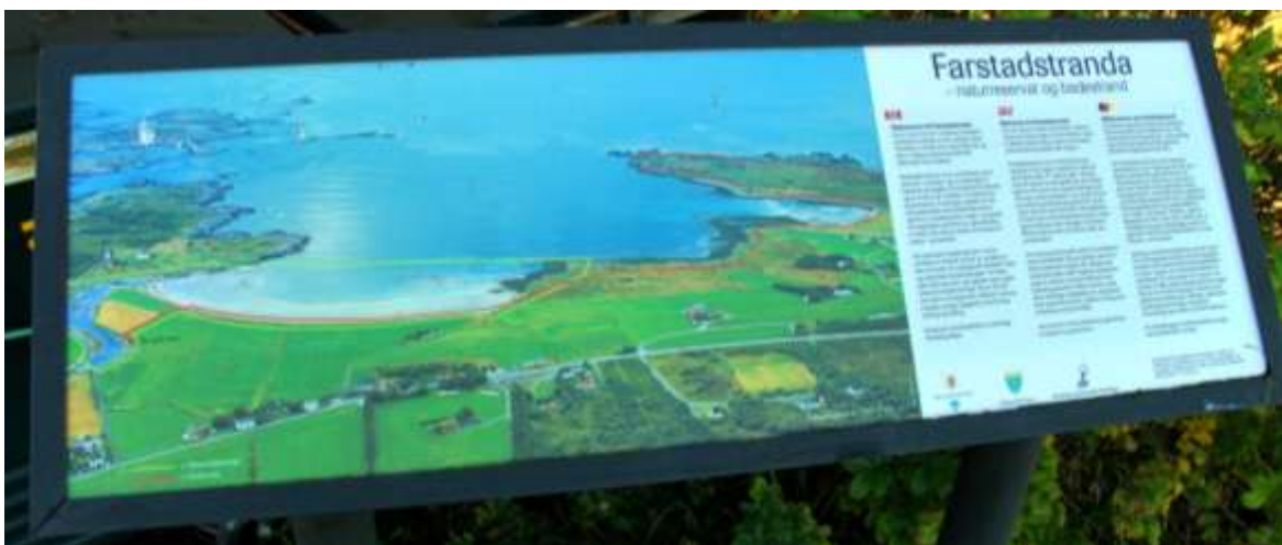
Fig. 11. Informasjonstavle om friluftsområdet inkl. info om naturreservatet

Det er sett opp ei informasjonstavle for Farstadsanden friluftsområde der det også er informasjon om naturreservatet. Det er ikkje nok informasjon om vernekvalitetane, så difor bør det supplerast med meir naturinformasjon. Det er sett opp skilt om bandtvang. All informasjon skal utarbeidast av eller i samarbeid med fylkesmannen.