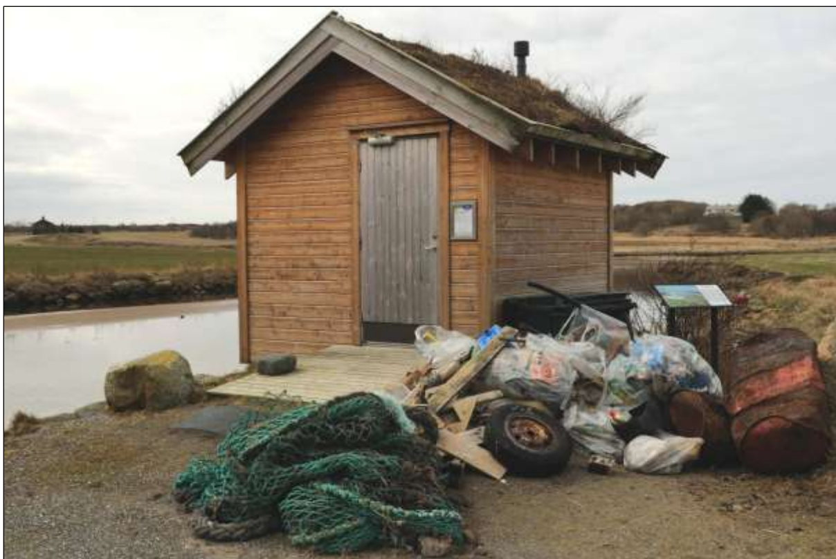
Fig. 10. Det er behov for årleg rydding av strandsøppel. Toalettbygget til friluftsområdet.

Søppel langs stranda må følgjast med, og ryddast når det er naudsynt. Verneområdet er vendt mot nord og vest og samlar av den grunn ein god del søppel frå sjøen.