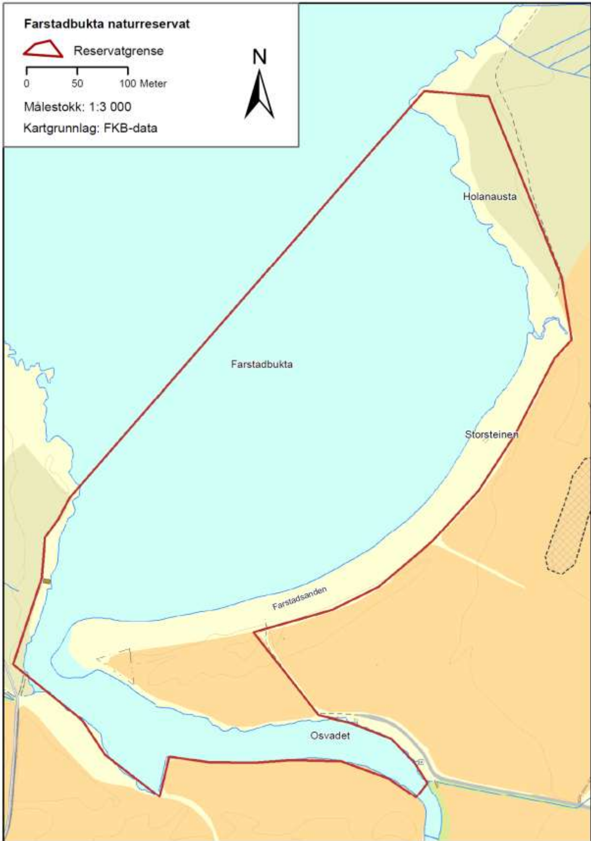
Fig 1. Kart over Farstadbukta naturreservat