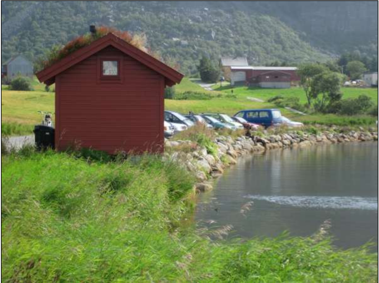
Fig. 6. Det er lagt til rette med parkering og toalettbygg for friluftsområdet.