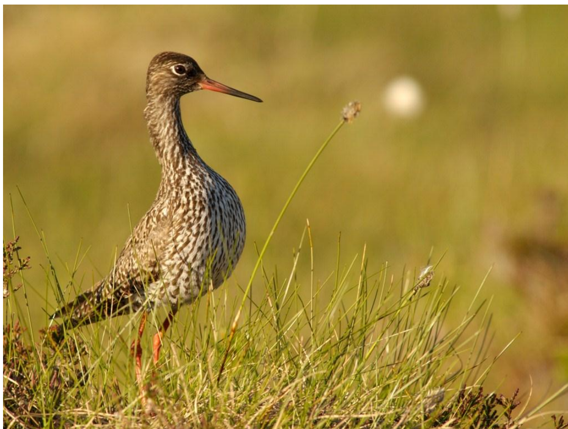
Rødstilk er ingen jaktbar art