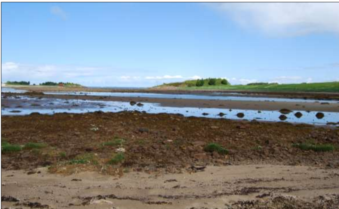
Fig. 2. Store delar av elveosen og bukta fell tørre ved fjære sjø.