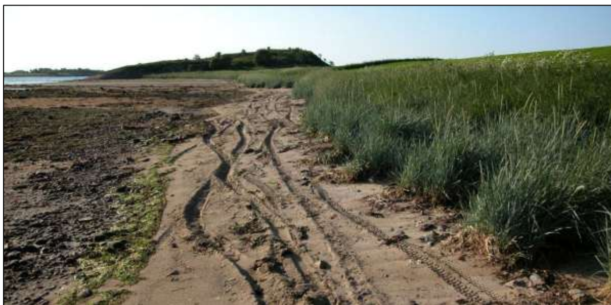
Fig.7. Terrengsykling i reservatet gjev slitasje

6. "Bruk av sykkel og hest utanom eksisterande vegar er forbode"