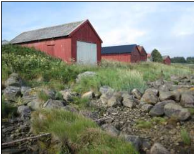
Fig. 10. Naustrekka i vest ligg utanfor, med støene som ligg i reservatet