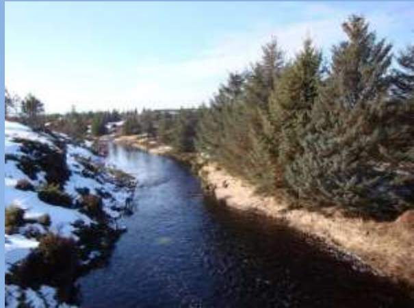
Fig 5. Faktaboks sitkagran.

Sitkagran har si opphavlege utbreiing i det nordvestlege Nord-Amerika. Den blei innført til Noreg grunna evna til å vokse fort samt evna til å motstå høgt saltinnhald i lufta. Difor er den i størst utstrekning planta langs vestkysten av Noreg, og plantefelt er svært vanlege heilt nord til Troms. Den har stor spreiiingsevne og fortrenger annan vegetasjon. Treet kjennest på den blågrønne fargen på nålene og på dei skarpe nålene. Sitka er kategorisert med Svært høg risiko i norsk svarteliste. Les meir på www.artsdatabanken.no .