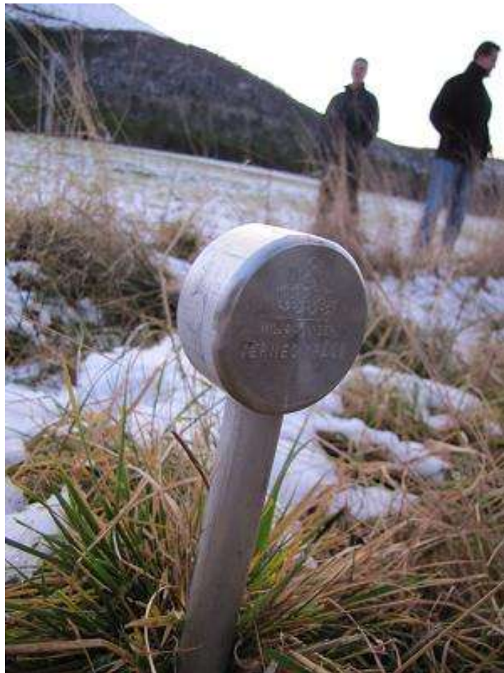
Fig. 13. Grensemerke for verneområde

Forvaltingsplanen for Hustadbukta naturreservat gjeld fram til ny forvaltingsplan er vedtatt. Fylkesmannen er ansvarleg for revideringa av planen. Ein tek sikte på å gjere dette ca. kvart 10. år, første gong ca. 2020. Fylkesmannen kan revidere planen på eit tidligare tidspunkt om det er nødvendig. Bevaringsmåla vil bli reviderte i samsvar med nasjonale standardar når desse føreligg, uavhengig av rulleringa av forvaltingsplanen.