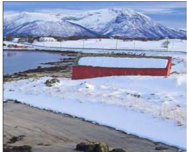
Fig. 11. Enkeltnaust i nord-vest, vegfylling i bakgrunnen