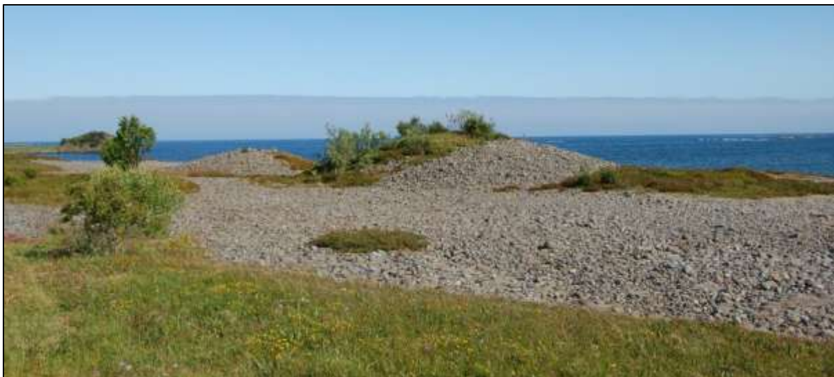
Fig. 8. Gravrøysene før skjøtsel