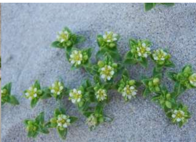
Fig. 4: Strandarve er derimot vanleg

Ved Nerland (austsida av bukta) og Malefeta (vestsida av bukta) finst sørlege sanddyner med sandstorr og strandreddik. Ved Malefeta er det sparsamt med sanddyner i dag. Lokaliteten har ifølgje Holten (1986b) mellom anna det sjeldne plantesamfunnet strandreddik-forstrand (V4a), elles fordyne med strandarve (V6c), tangmeldevoll (V1c), fordyne med strandrug (V6b), og etablerte sanddyner (W2). I indre deler finst ulike saltenger, somme stader også strandberg. I nordre del ved Malefeta mot gravhaugane finst dels skjelsandenger og kalkrike strandberg som no er i attgroing.