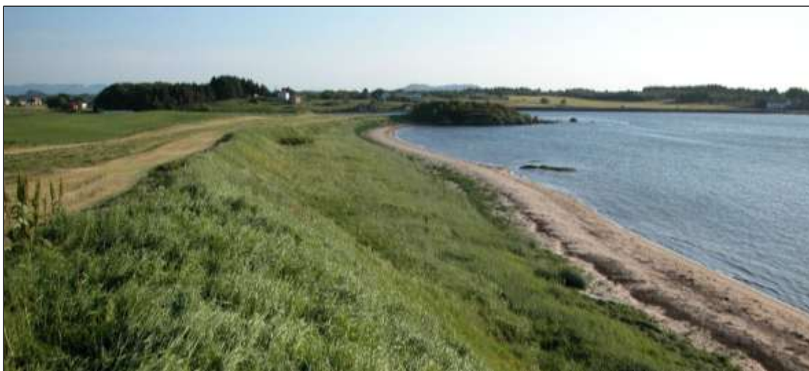
Fig 12. Det er kraftig gjengroing i bakkant av stranda.

Ved Auså er det også aukande gjengroing i bakkant av sanddynene. Her vert det litt tilførsel av gjødsel frå dyrkamarka bakom. Gras- og urtevekstane bør fjernast, anten ved beiting, eller ved at området vert slått seint i sesongen og biomassen vert fjerna.