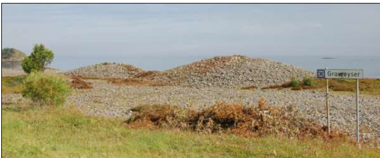
Fig. 9. Gravrøysene etter skjøtsel