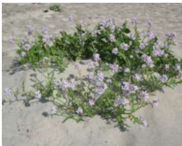
Fig. 3: Strandreddik er sjeldan å finne i reservatet

Fræna kommune kartla naturtypane i kommunen i 2004 (Jordal 2005). Avgrensa lokalitetar blei sorterte og verdsette etter naturtype på ein skala frå A – C (A=svært viktig, B=viktig, C=lokalt viktig), der Hustadbukta blei klassifisert som Havstrand/kyst med verdi A. Historisk er Hustadbukta er ein klassisk lokalitet for botanikkinteresserte, og mykje av den systematiske informasjonen er samla tilbake i 1897 (Dahl). Analyser er gjort i 1974, 1984 og 2004.