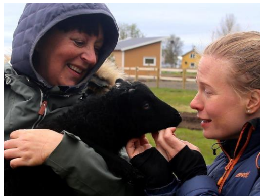
Deltakere fra Hadsel kommune besøkte våren 2019 Vågan kommune og en av Inn på tunet-tilbyderne der for å lære mer om hvordan man kan etablere Inn på tunet som en del av en kommunes tjenestetilbud.