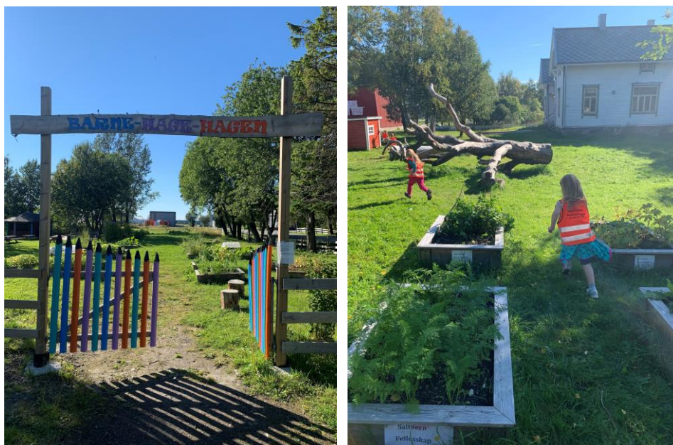
Barnehagehagen til Bodin 4H-gård i Bodø kommune.

Bodø kommune skal være erfaringskommune for Inn på tunet-piloten for grunnskole. Også Bodø kommune er én av de større landbrukskommunene i fylket og har i dag tre godkjente tilbydere av Inn på tunet, én Ut på vidda-tilbyder, og gårder som er i godkjenningsprosess for å bli godkjente Inn på tunet-tilbydere. Inn på tunet er forankret politisk og administrativt i kommunen. Bodø kommune tilbyr Inn på tunet til barnehagebarn, grunnskoleelever, foresatte som trenger avlastning (barnevern som kjøper), sommeraktivitetstilbud, samt som dagaktivitetstilbud til personer med demens. Blant annet gir Bodø kommune et tilbud til alle 4. klassinger om å få ha én hel skoledag på gården. I tillegg er alle femteklassingene én hel skoledag i Ersvika Sami Siida, for å lære om reindrift og samisk kultur. Fylkesmannen i Nordland har ved flere anledninger benyttet kommunedirektøren i Bodø kommune og Bodin 4H-gård som gode eksempler på samarbeid, i sitt informasjonsarbeid til de øvrige kommunene i Nordland. Det er verdt å nevne at Bodø kommune er i oppstarten av et eget prosjekt knyttet til urbant landbruk, og i dette prosjektet inngår også Inn på tunet som en naturlig del.