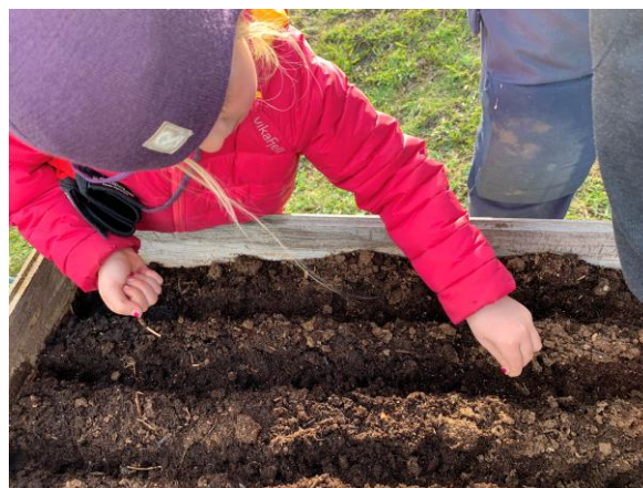
Såing, dyrking og høsting er en av mange aktiviteter som elevene kan ta del i på en Inn på tunet-gård.