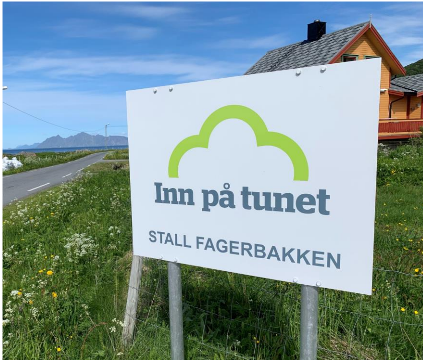
Inn på tunet-merket som vist på skiltet til Stall Fagerbakken i Vågan kommune.

Matmerk er en uavhengig stiftelse som skal bidra til økt mangfold, kvalitet og verdiskaping, og har ansvar for kvalitetssystemet i landbruket (KSL). Godkjenningsordningen for Inn på tunet trådte i kraft 1. januar 2014. Inn på tunet er registrert som et beskyttet fellesmerke og ordmerke. Alle norske gårdsbruk som oppfyller kravene i godkjenningsordningen for IPT har rett til å omtale tilbudet sitt som IPT og bruke merket for IPT. En tilbyder av IPT skal være godkjent av Matmerk. Gjennom KSL har Matmerk ansvaret for godkjenning og oppfølging av IPT-tilbydere. En kontinuerlig kvalitetssikring skjer gjennom revisjoner og tett oppfølging av IPT-tilbyderne.