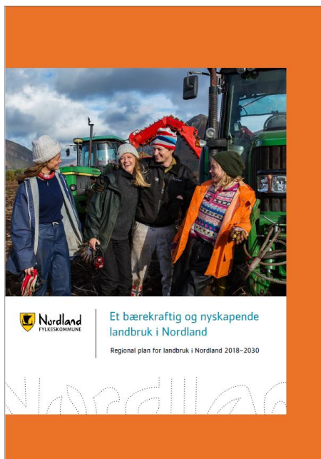
Regionalt næringsprogram for landbruket i Nordland 2019-2022 og Regional plan for landbruk i Nordland 2018-2030