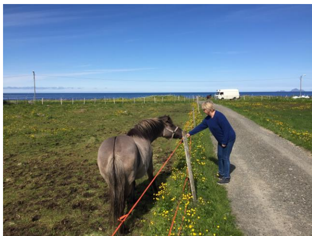
Stall Fagerbakken i Vågan kommune har dagaktivitetstilbud til personer med demens.

Samlet sett utgjør de fire kommunene, Hadsel, Meløy, Vestvågøy og Vågan, gode kandidater som pilotkommuner for Inn på tunet i grunnskolen. Selv om de har ulik kjennskap til, og erfaring med Inn på tunet, ser alle et stort potensial i å kunne gi elevene i grunnskolene et Inn på tunet-tilbud. Fordelene ved ulikhetene mellom kommunene er flere. For det første, vil kommunene kunne lære av hverandres