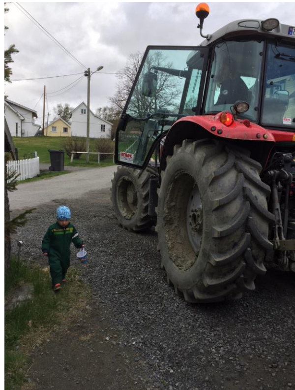
Barn er en av brukergruppene som kan benytte Inn på tunet-tjenester.