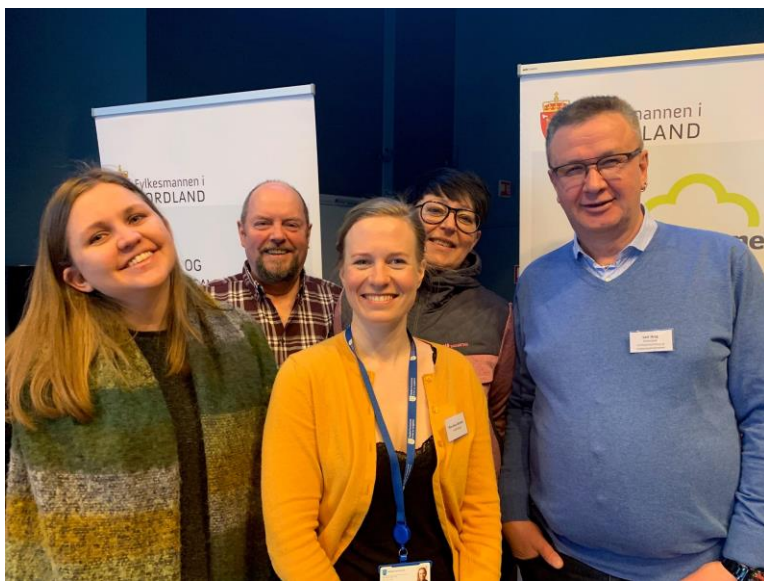
Deltakere fra Hadsel kommune deltok på Fylkesmannens Inspirasjonsseminar for Inn på tunet våren 2019.

Hadsel kommune har et sterkt ønske om å kunne gi ulike brukergrupper i kommunen et Inn på tunet-tilbud. Dette er forankret både politisk og administrativt. Fylkesmannen i Nordland har gjennomført informasjonsmøte i kommunen for en tid tilbake, og flere av de kommuneansatte har deltatt på aktiviteter i regi av Fylkesmannens pågående Inn på tunet-prosjekt, deriblant konferanse, seminar og studietur. Imidlertid har ikke kommunen i dag godkjente tilbydere av Inn på tunet, men landbruksansvarlig sier at det er flere gårdbrukere som kunne tenke seg å gi et slikt tilbud. Vi anser Hadsel kommune som en god kandidat for å delta i pilotprosjektet om Inn på tunet for grunnskolen.