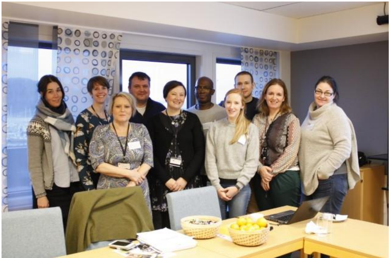
Fylkesmannen i Nordland inviterte Bodø kommune til informasjonsmøte desember 2018.