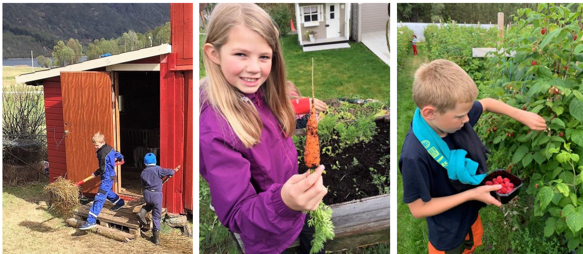
Meningsfylte aktiviteter for barn.