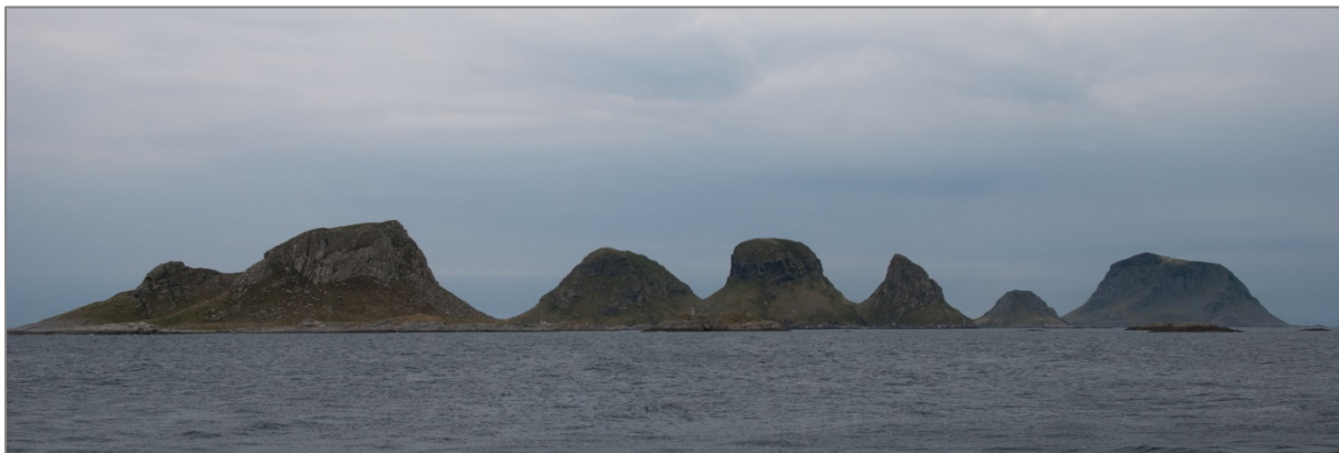
Nykan naturreservat med Storfjellet i bakgrunnen