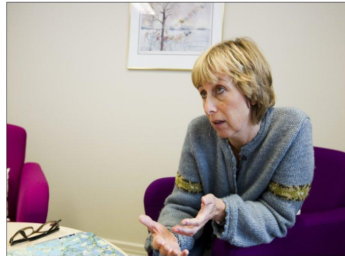
Leder ved Statens barnehus Oslo