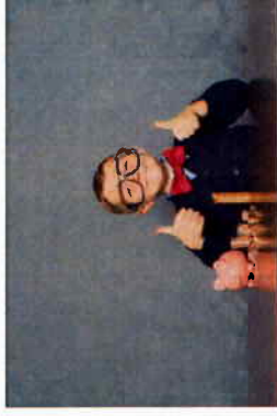
Sett inn furua