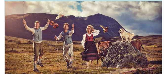
Brimi sæter, Foto: Cathrine Dokken/Kreativ Strek

Tema: Reiseliv og mat; Fra ide til virkelighet—med fokus på de gode eksemplene