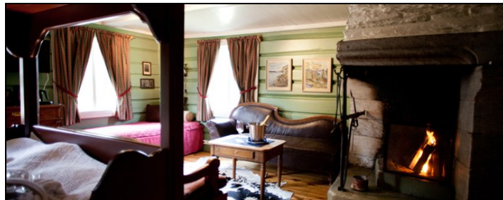
Nordre Ekre gård