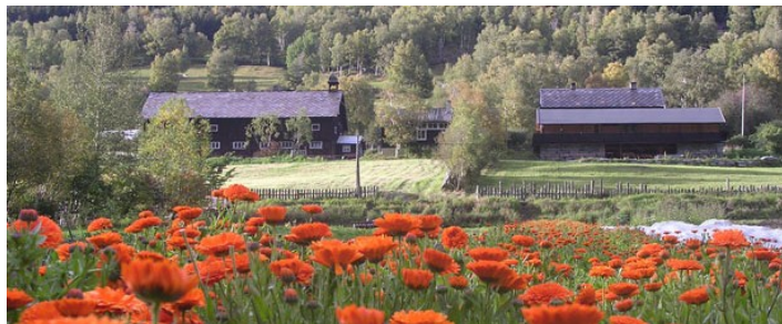
Nordgard Aukrust