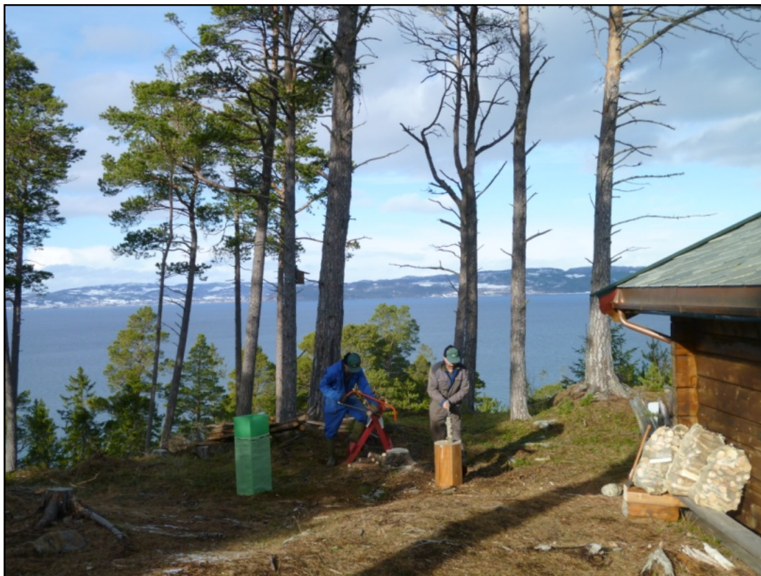
Skogen og utmarka byr på varierte arbeidsoppgaver.

IPT-satsingen skal utvikle samfunnsnyttige velferdstjenester med gården som arena. Grunnet at å utvikle gården som arena er at gårdsressursene kan styrke håndteringen av samfunnets velferdsoppgaver. Dette kan oppfylles enten ved at tjenestene tilfredsstillende gjeldende kvalitetsstandarder med økt mulighet for individ- og brukertilpasning, eller at gitt kvalitet kan fremskaffes på en mer effektiv måte.