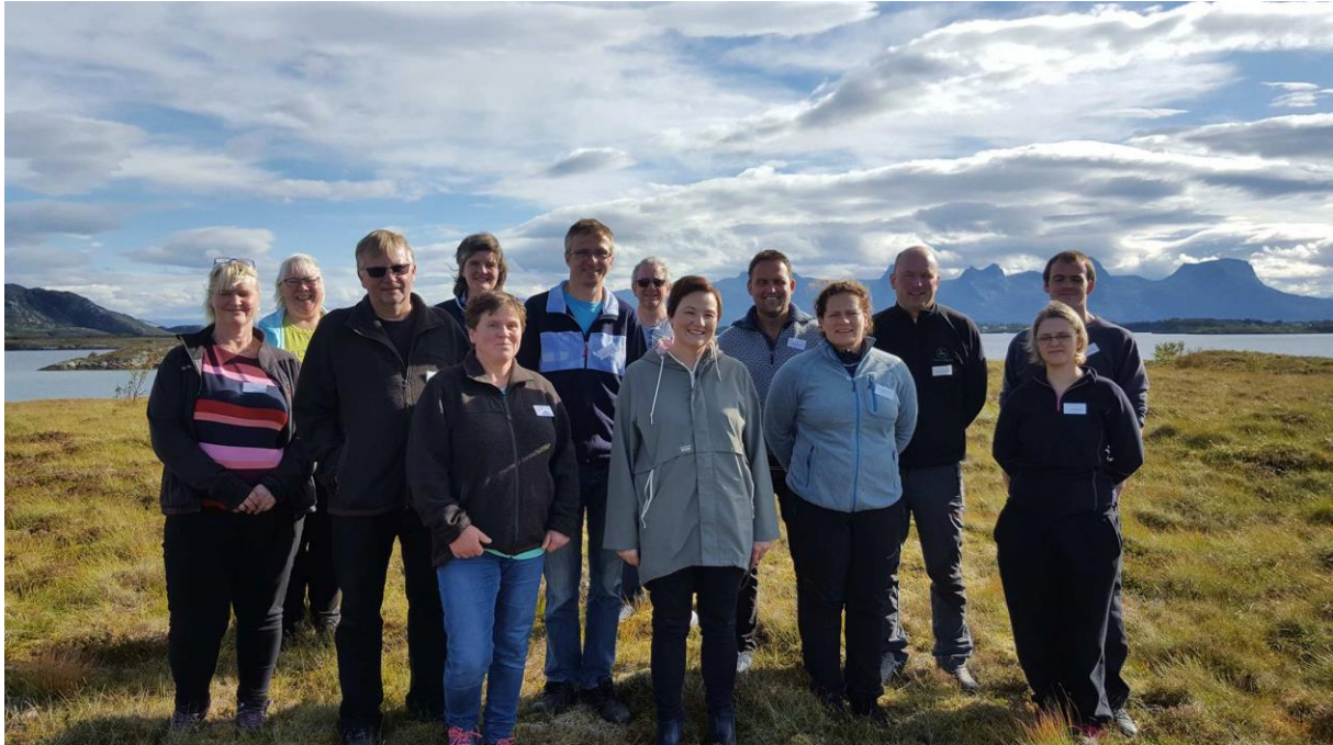
Kursdeltakerne med utsikt fra Herøy til fjellene De syv søstre