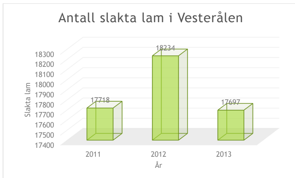
Figur 2: Figuren viser utviklingen i antall slakta lam gjennom prosjekt perioden

«Øke produksjonen av lam i Vesterålen med 20 % innen 2014»