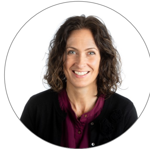
Statssekretær Wenche Westberg