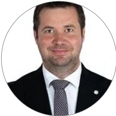
Landbruks- og matminister Geir Pollestad