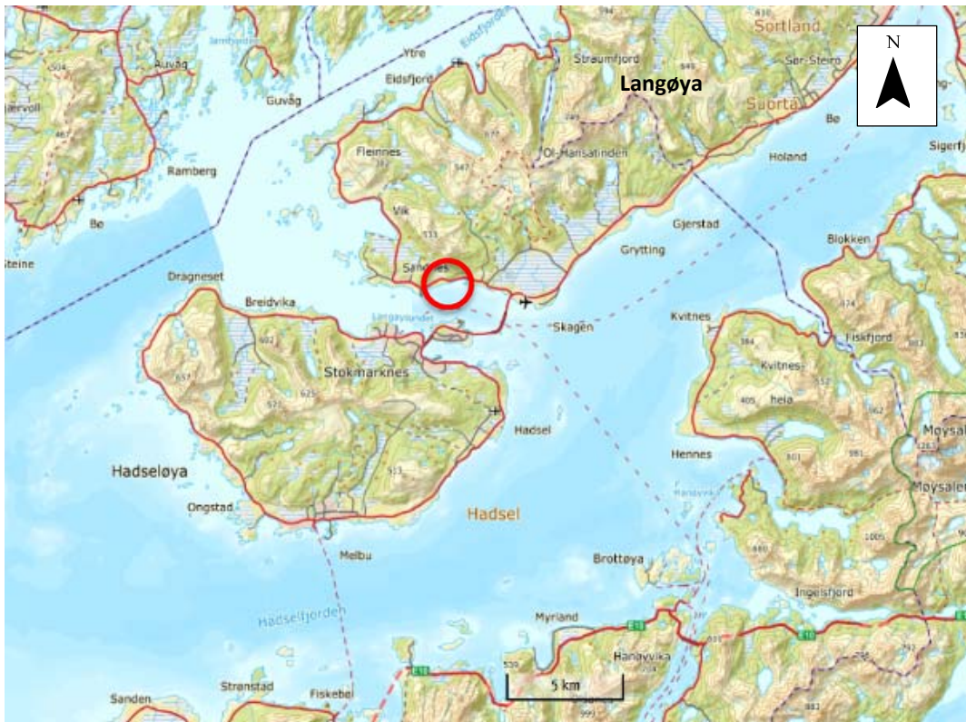
Figur 1: Oversiktskart Lundneset, Hadsel kommune. Lokaliteten er markert med rød ring.