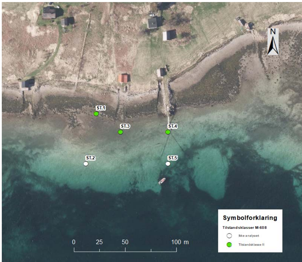
Figur 7: Lundneset. Prøvestasjoner markert med fargesymbol for høyeste påviste tilstandsklasse.