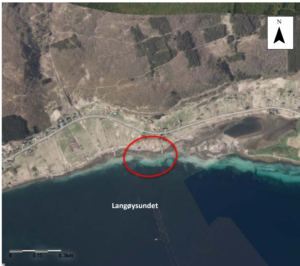
Figur 2: Flyfoto Lundneset. Undersøkt område er innenfor rød sirkel.