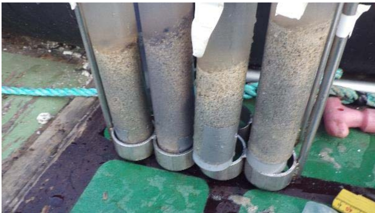
Figur 6: Lundneset. Foto av prøver fra ST.4. Foto: Multiconsult, oktober 2018.