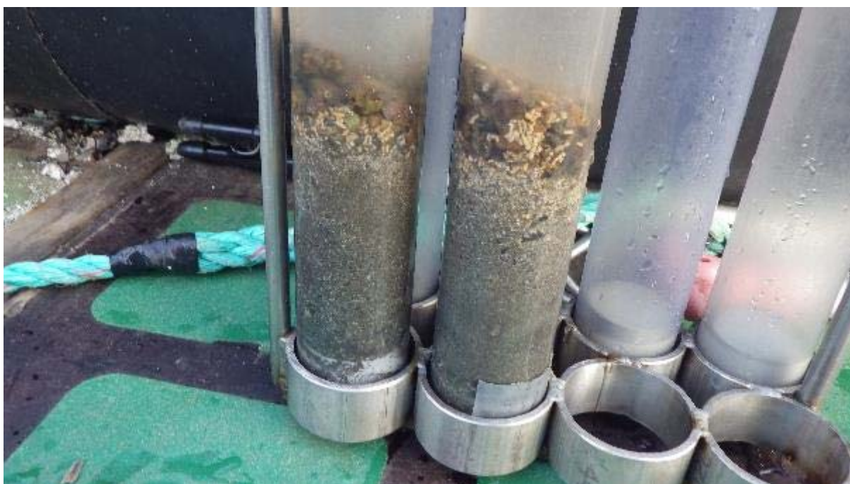
Figur 5: Lundneset. Foto av prøver fra ST.1. Foto: Multiconsult, oktober 2018.