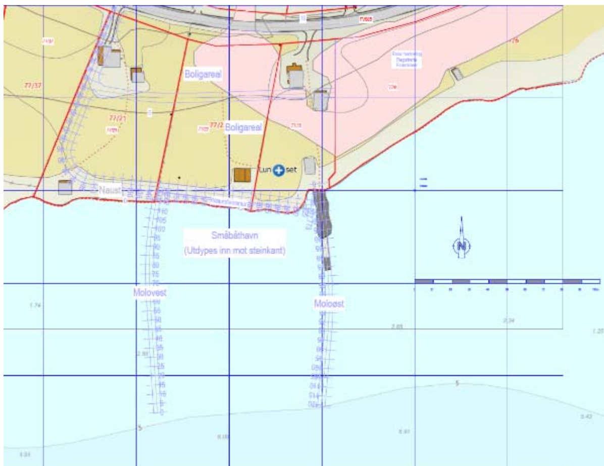
Figur 3: Lundneset. Planlagte moloer for ny småbåthavn er vist på vedlagte plan. Tegning mottatt fra Sivilingeniør Bård Sørensen AS.

Inge Berg planlegger å etablere en småbåthavn ved Lundneset. Prosjektet innebærer utfylling av to moloer i sjø, Molovest og Moloøst, samt utdyping inn mot land, se Figur 3.