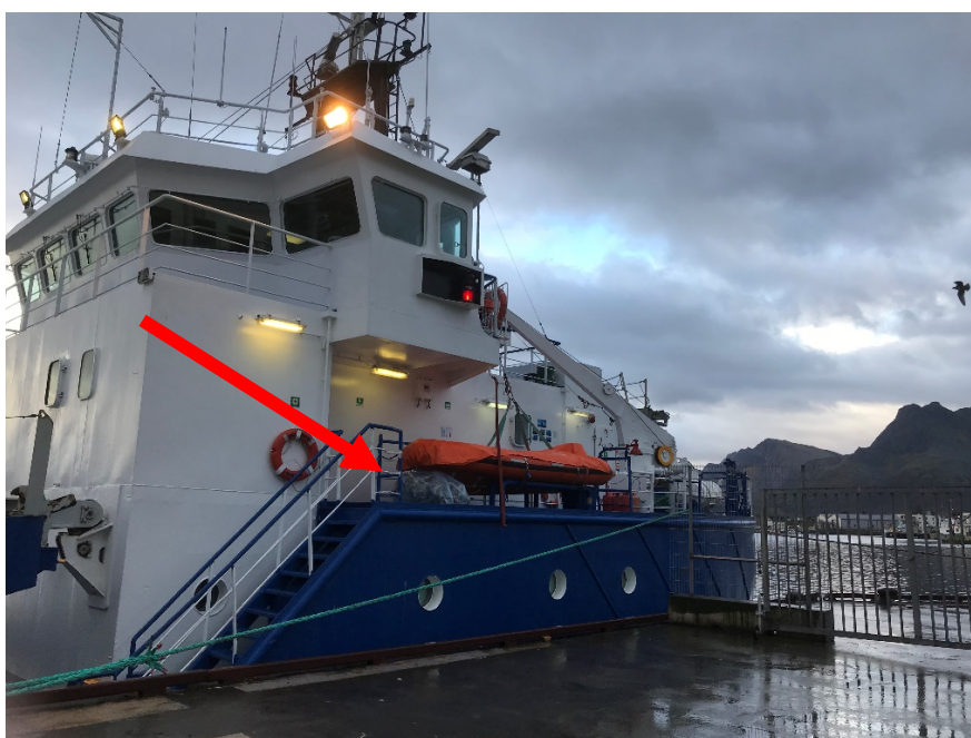
Bilde 5, skip som anløper med råvarer, sekk med mulig innhold av avfall vist med pil