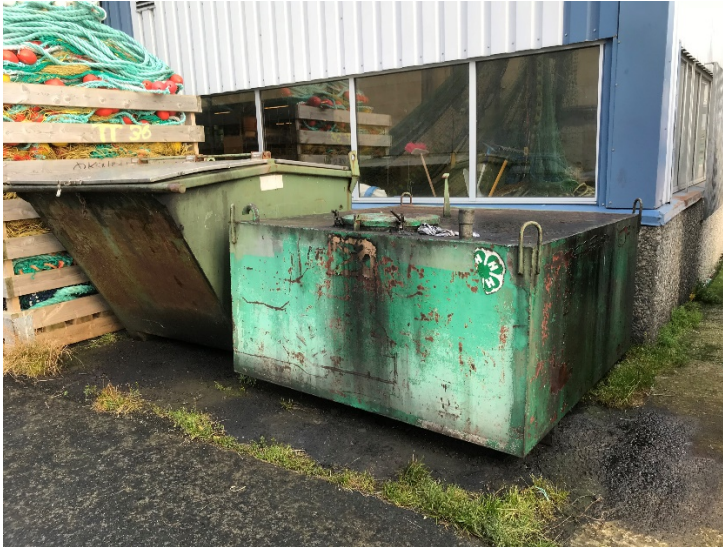
Bilde 1 , stasjon for mottak av farlig avfall på Myre Redskapsentral.

avfallscontaineren stod ulåst og plassert direkte på grus. Grunnen bærer tydelig preg av å være forurenset av olje og det finnes ingen mulighet for oppsamling i tilfelle lekkasje. Ved mottaket finnes det ingen informasjon om hvilke typer farlig avfall som mottas. I tillegg finnes det ingen kontaktinformasjon eller logo der det framkommer hvem som har ansvaret for denne stasjonen.