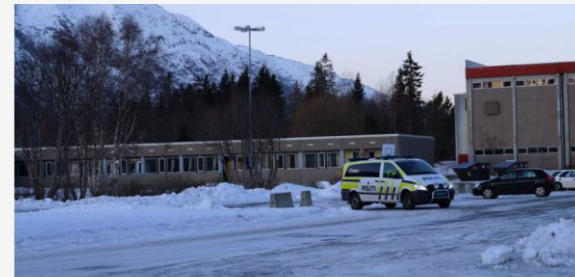
Til sammen tre skoler, en ungdomskole og to videregående, er stengt etter at det er framsatt trusler på appen Jodel.