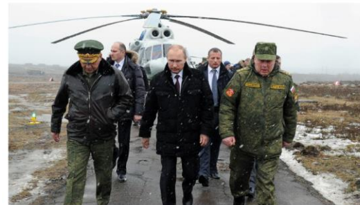
Putin til stede på øvelsesstedet Kirilovskij i for, sammen med blant andre forsvarsminister Sergej Sjogin og sjefen for den russiske hærens avdeling for kampforberedelser, Ivan Buvalttsev.

Russlands militære tilstedeværelse i Arktis vil bli styrket ved utgangen av 2015 med sjo- og luftforsvar.