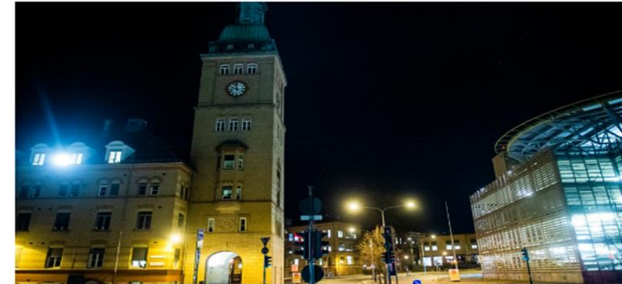
Oslo universitetssjukehus er lokalsjukehus for store delar av Oslo si befolkning. Dei driv mellom anna OUS Ullevål.

Sjukehuset skriv at det er sterkt beklageleg og at slikt ikkje skal skje.