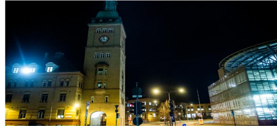
Oslo universitetssjukehus er lokalsjukehus for store delar av Oslo si befolkning. Dei driv mellom anna OUS Ullevål.

Sjukehuset skriv at det er sterkt beklageleg og at slikt ikkje skal skje.