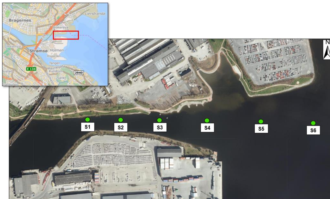
Figur 1. Oversiktskart som viser området (rød ramme) og flyfoto med lokalisering av stasjoner for sedimentprøver ved Brakerøya.