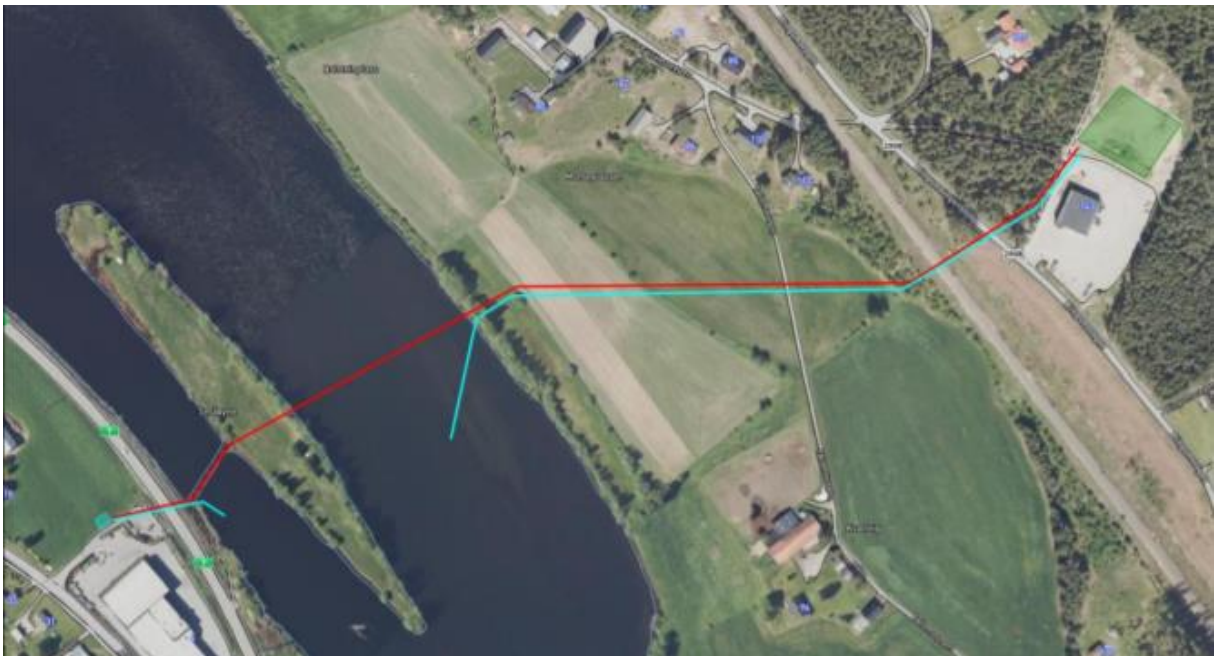
Figur 3. PST Bringø, overføringsledning og utslippsledning.

Med tanke på at det forutsettes at alt avløp fra Nesfjellet på sikt kan «trykkes» inn på renseanlegget gjennom trykkledning vil det ikke være behov for et større buffervolum i forbindelse med pumpestasjonen. Det kan dermed etableres en mindre og enklere pumpestasjon PST Bringø. Det må imidlertid klargjøres for drenering av «trykkledning» fra fjellet. Prinsippet for ny pumpestasjon, overføringsledninger og utslippsledning er vist i figur 3.