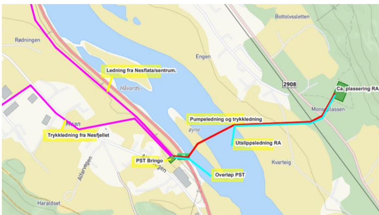
Figur 2. Prinsipp nytt ledningsnett (utsnitt kommunekart.com)