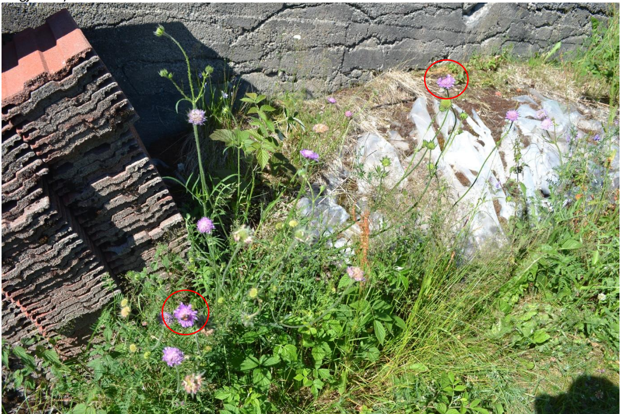
Bilde 3: Oversiktsbilde av rødknapp ved låvebrua. Rød sirkel viser rødknappsandbie.