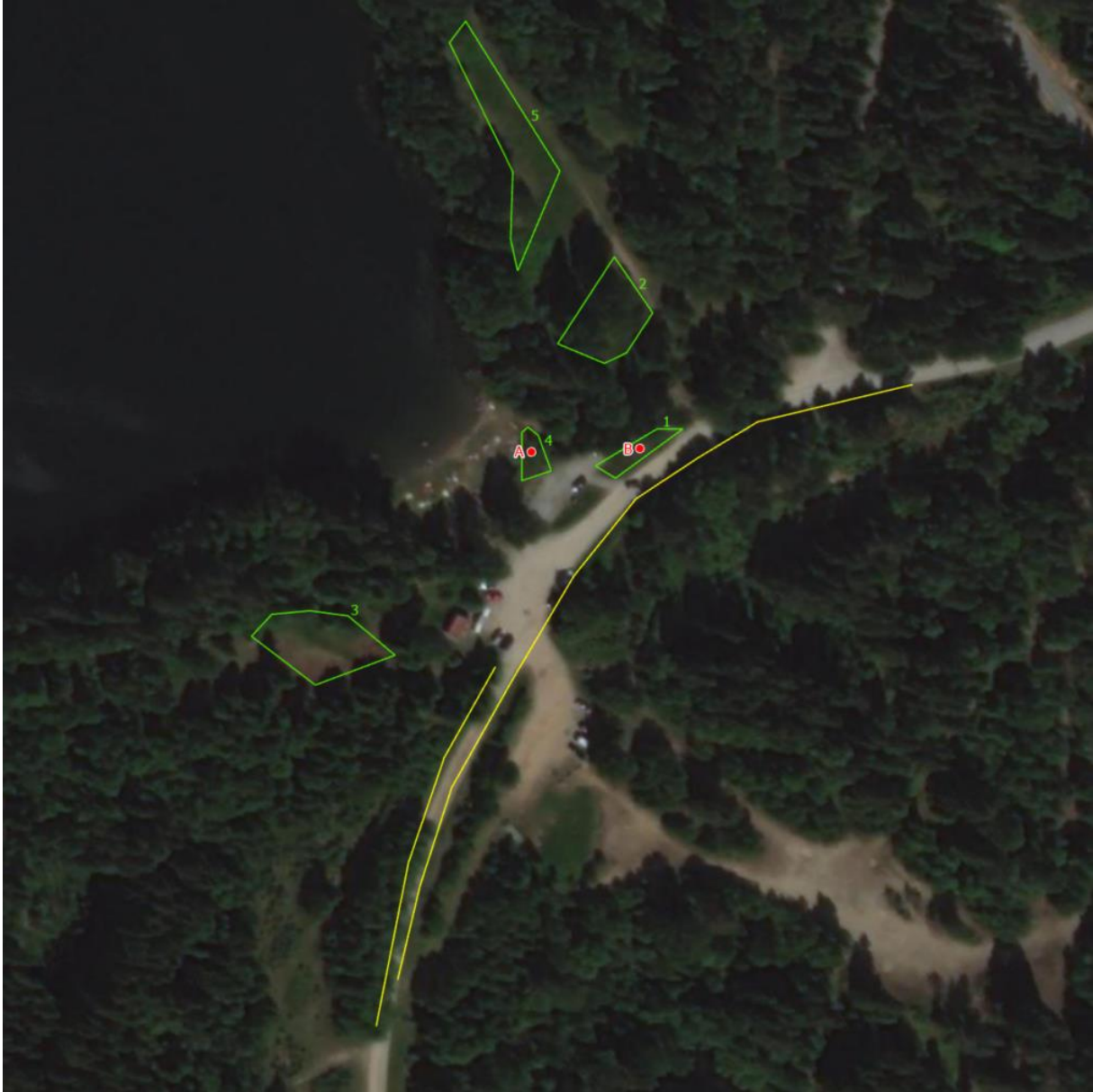
Oversiktsbilde av lokaliteten ved Aurtjern

Leting etter rødknappsandbie mellom kl. 12.00 og 13:30. Sol med litt skyer ca. 20 grader.