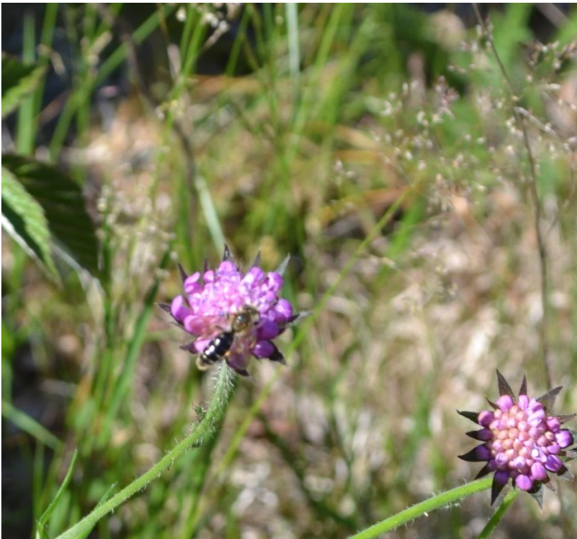
Bilde 6, 7 og 8: Male 1