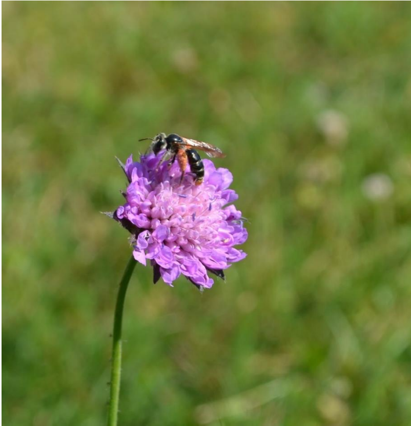
Bilde 4: Hunn 1