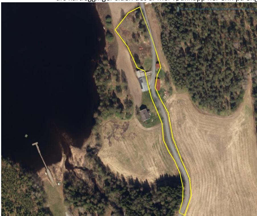
Bilde 1. oversigtskart over lokaliteten ved Bjørkebekk, også kjent som Holmgil.