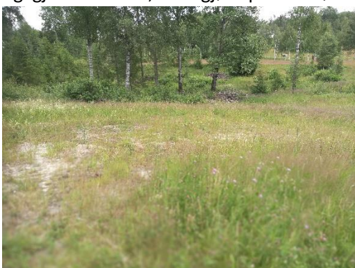
Oversiktsbilde av lokaliteten

Det finnes lite, men noe hagelupin i nærområdet som bør bekjempes før den får spredt seg inn på lokaliteten. I tillegg bør arealet bak rødknappforekomstene (ned mot bjørketræene) slås tidlig i juni, og igjen sent i Juli, for å gjøre plass til rødknapp, som i dag er begrenset av Geitrams.