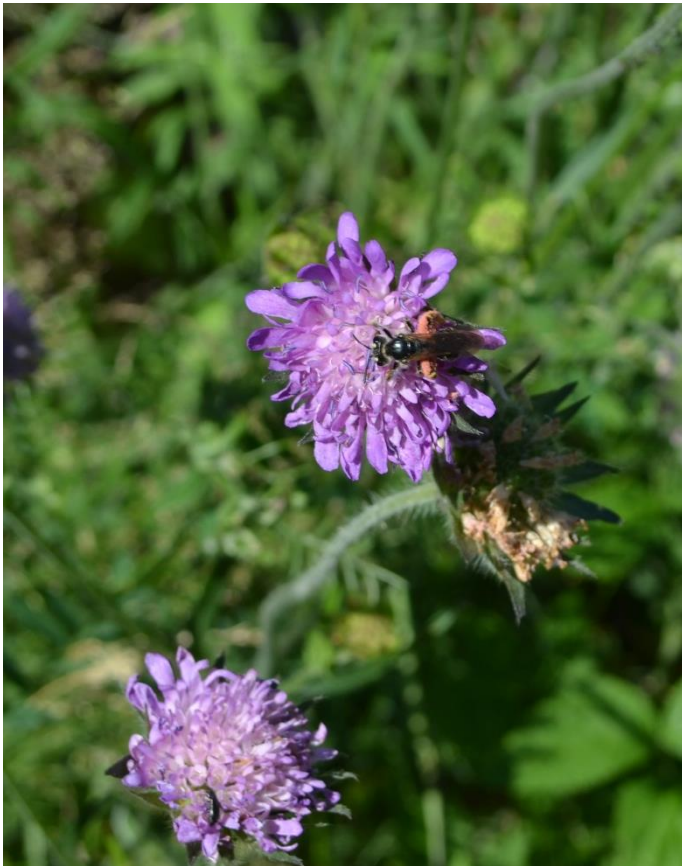
Bilde 5: Hunn 2