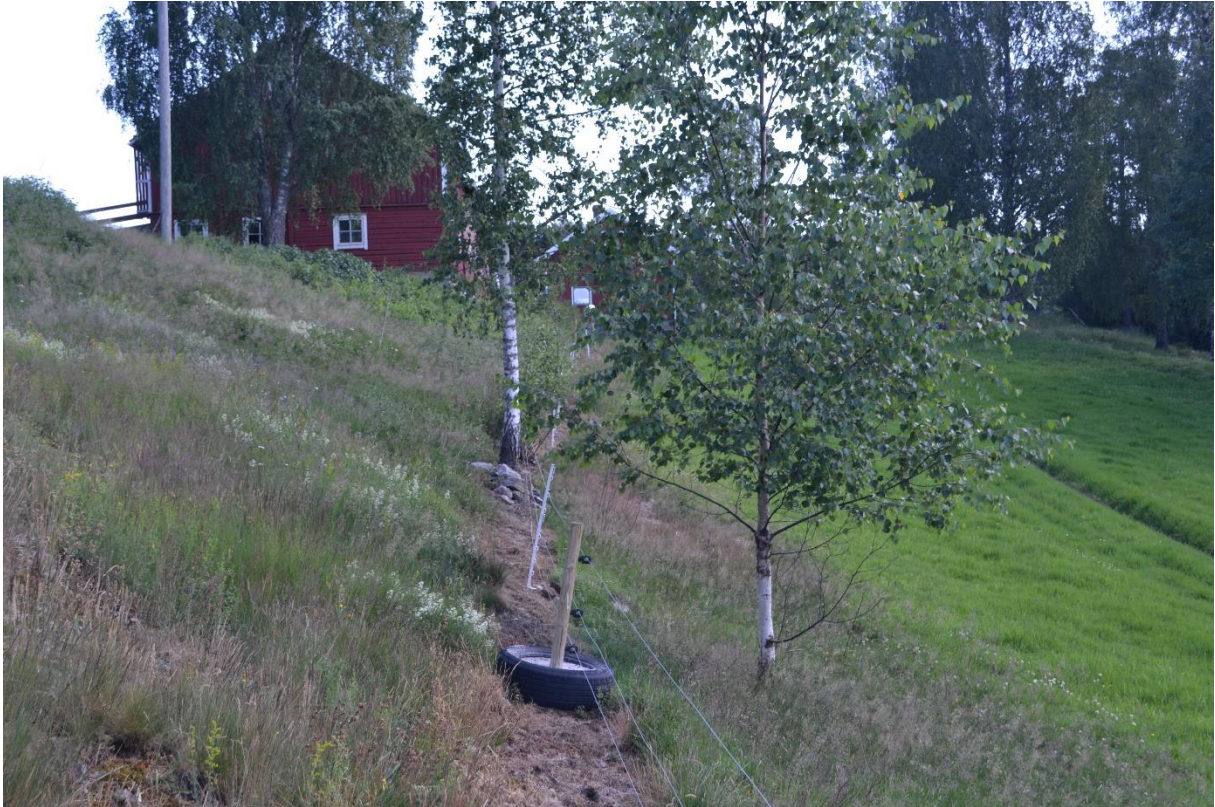
Bilde 2: Den tidligere bestanden av rødknapp i 2019 var 2-3 meter nedenfor gjerdet. Man kan se skillet hvor det vanligvis har vært beite (grønt gress T.H.) og hvor slåttmarken var (forskjellig gras T.H. av gjerdet)