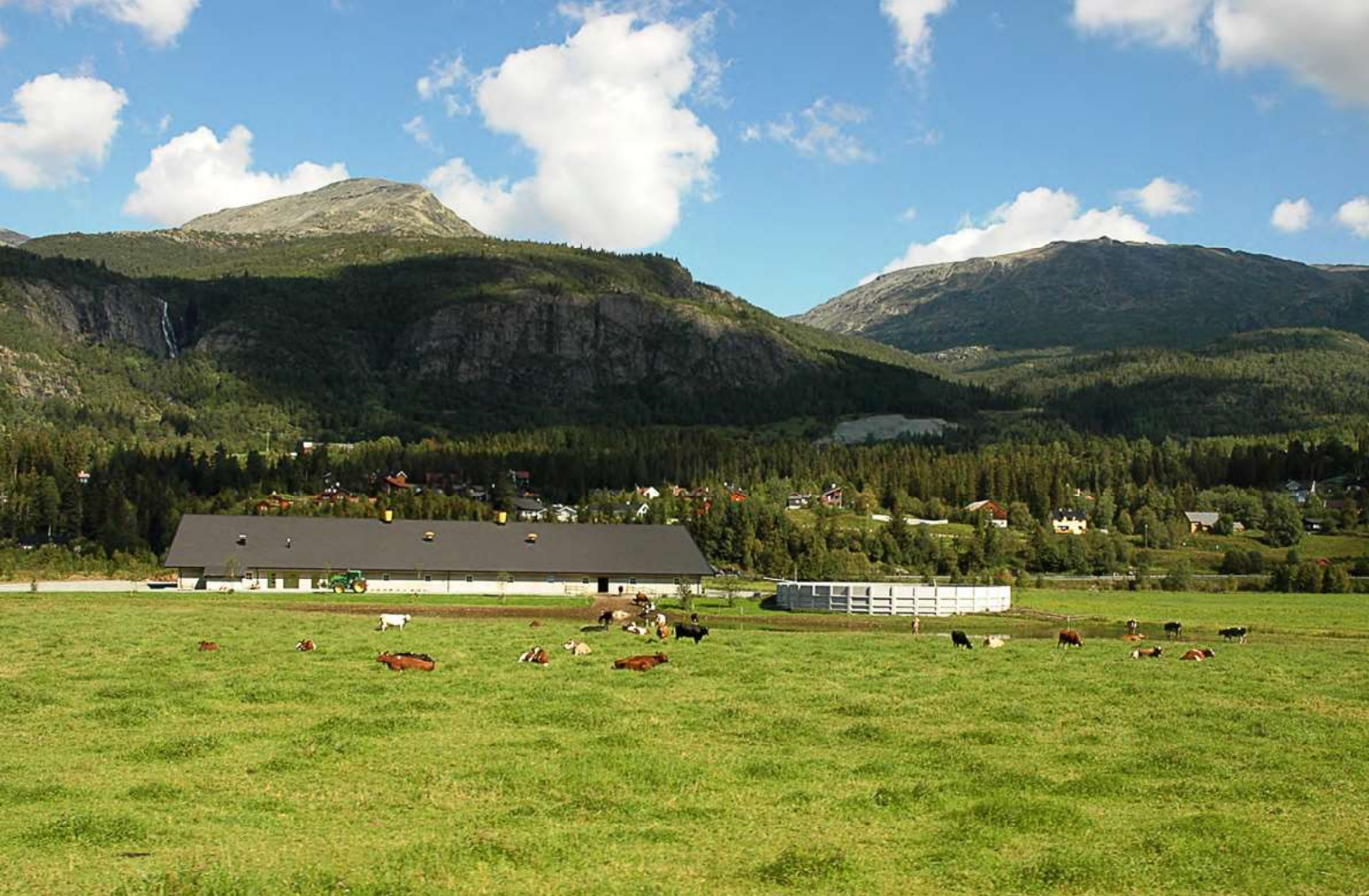
Fellesfjøs Hemsedal