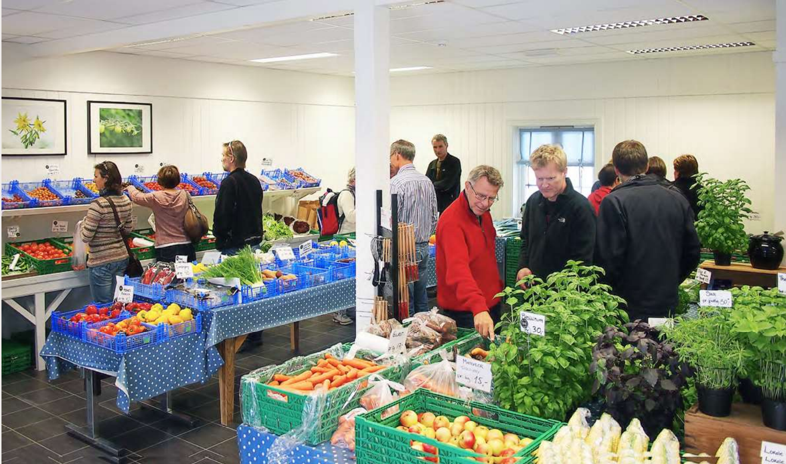
Gårdsutsalg - gartneri