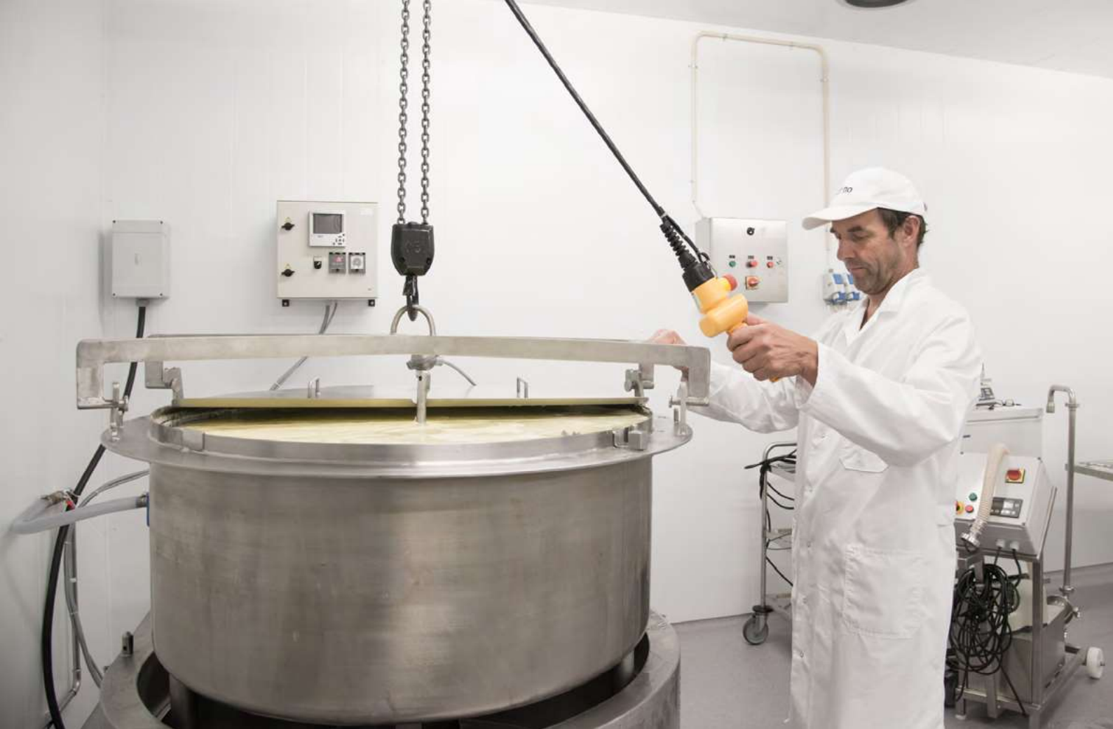
Grøndalen Gårdsmeieri