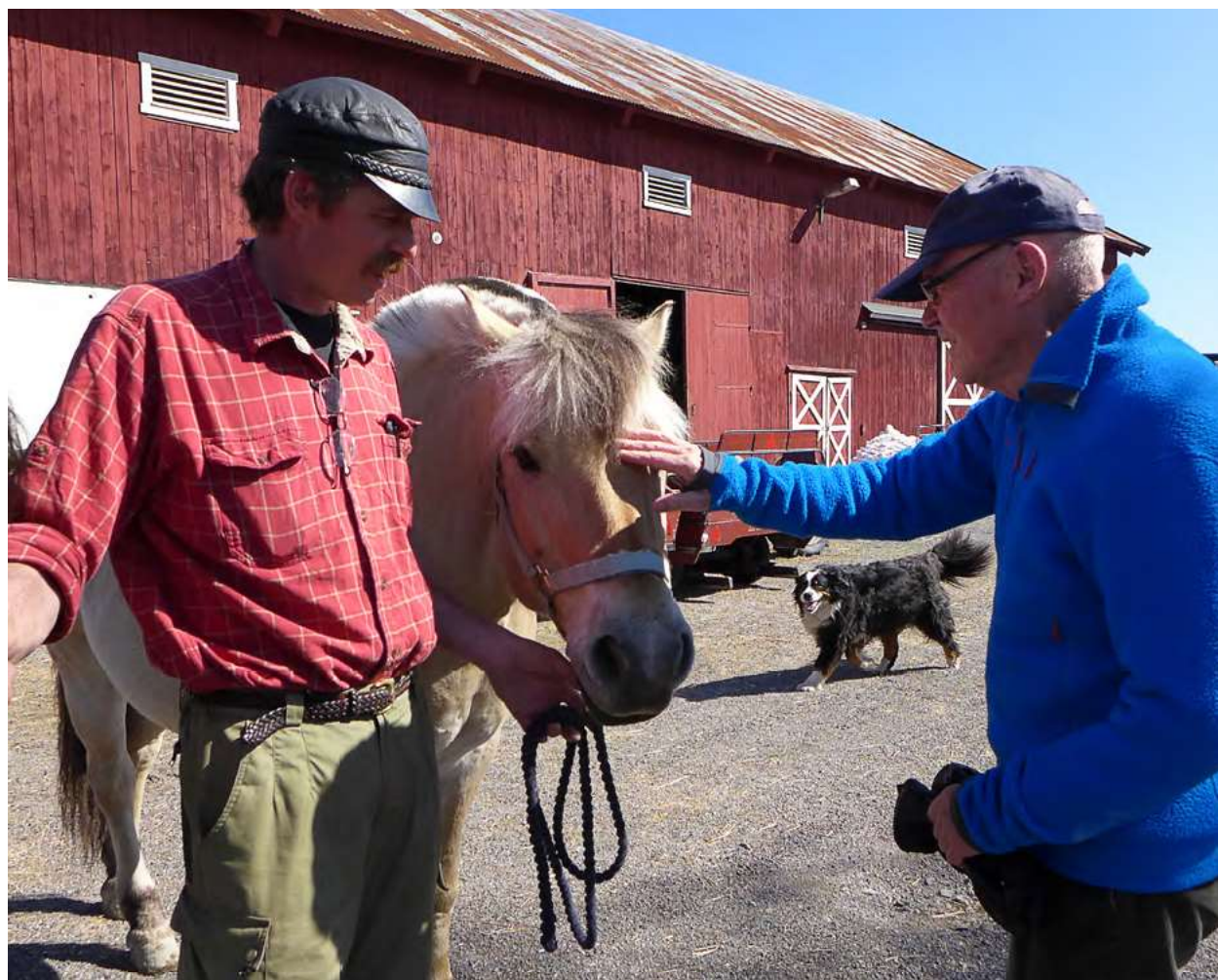
Inn på tunet Demens og Alderspsykiatri

Kommunens vurdering av om tiltaket er i tråd med LNFR-formålet er ikke et enkeltvedtak etter forvaltningsloven. Derfor kan ikke denne avgjørelsen påklages til overordnet myndighet.