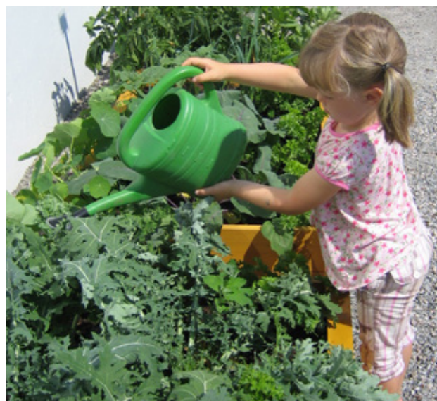
Skolehagen til NORSØK på Tingvoll Gard.