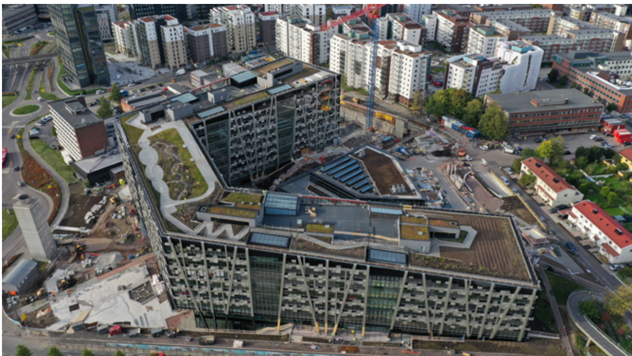
Økern Portal, Nord-Europas største takpark på syv mål (7000 m 2 ) med parsellhager, bikuber og friluftsområder. Her skal barn og voksne få lære om dyrking og sirkulære kretsløp. Avfall fra bygget skal komposteres og brukes som gjødsel.

Bygninger og asfalt lagrer varme, og bidrar dermed til å øke overflatetemperaturen i urbane områder. Innslag av grønt bidrar til å redusere mengde asfalt og harde