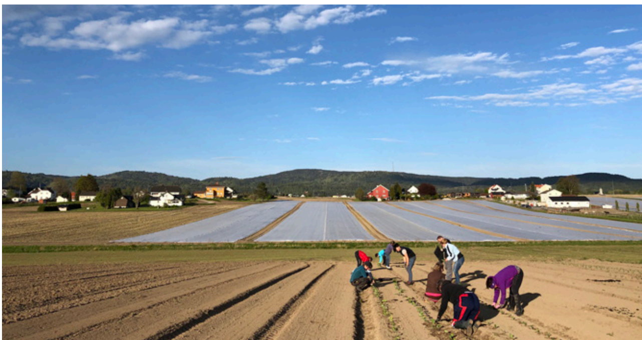
Dugnad på Århus gård, Skien.

Tiltakene som er omtalt i strategien kan gjennomføres innenfor gjeldende budsjetttrammer. Det er ikke forventet økte administrative kostnader.