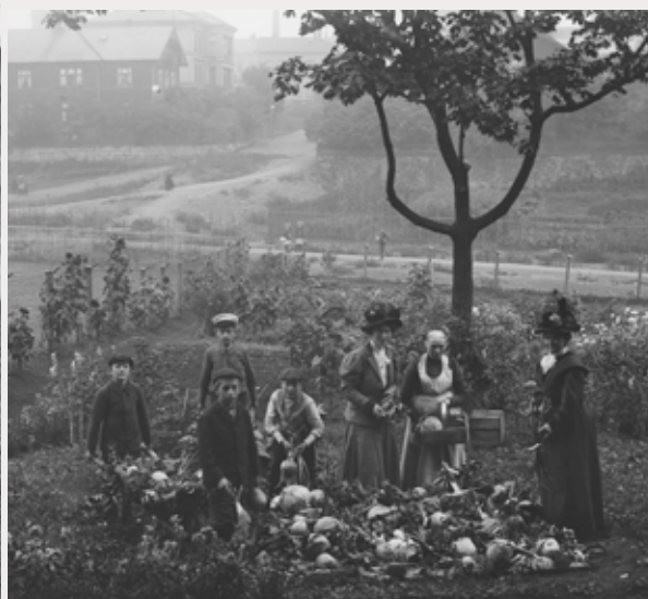
Skolehage på Bondejordet på Frogner i Kristiania i 1907 og 1909.

Den første skolehagen startet i 1906 på Bondejordet på Lille Frogner, og den kommunale driften kom i gang i 1909. Da vedtok formannskapet at en del av Geitmyra på Sagene kunne benyttes til skolehager for barn i indre by, og på det meste omfattet virksomheten opp mot 90 skoler med en deltakelse på ca. 4000 barn per år. Det var ansatt fire gartnere og en rektor i full stilling, ca. 150 lærere på deltid samt sommervikarer. Fra skolehagegartneriet på Geitmyra ble det levert planter til utplanting i hagene og på de botaniske feltene, og til innendørs plantestell i skolen.