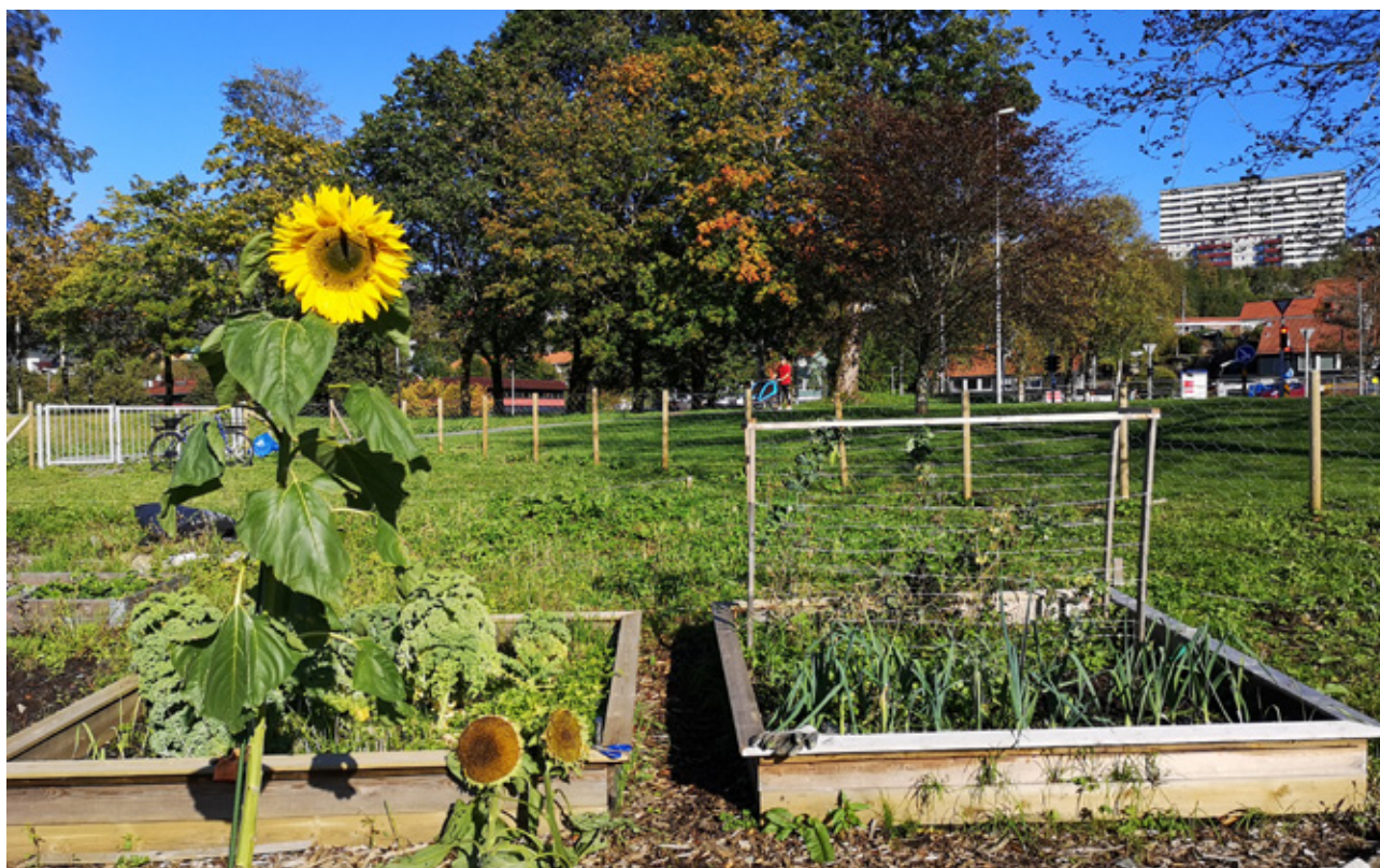
Stortveitmarken parsellhage i Bergen – sneglegjerde på pallekarmen.

Den økte interessen for urban dyrking, og det faktum at mange ikke har et sted å dyrke, gjør at etterspørselen etter parseller, og ønsket om å utnytte restarealer øker. Det er mange arealer som ligger ubrukt. Det kan være uavklart hva arealet skal brukes til, eller at eier ikke har tatt arealet i bruk. Midlertidig dyrking på slike arealer er bærekraftig bruk av ressurser, og er gjennomført mange steder.