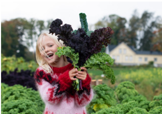
Grønnkålshøsting Århus gård, Skien.

Skolehager kan også være en egnet arena for fysisk aktivitet i skolehverdagen. Det er barnehagene og skolene som velger hva slags metoder de tar i bruk.